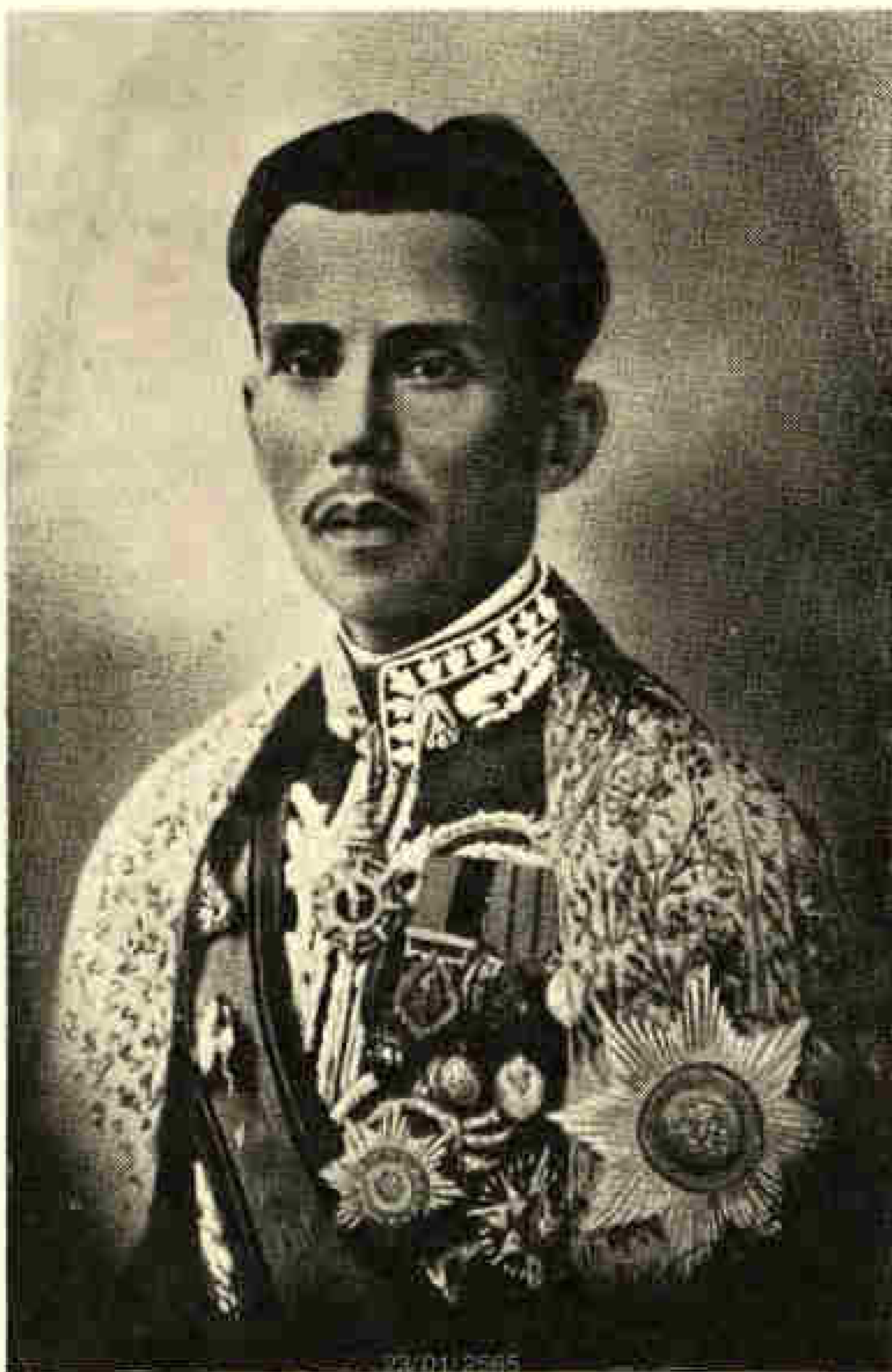
มหาอำมาตย์โท พระยามหินทรเลขาณูวัฒน์ "ใหญ่ สยามานนท์"