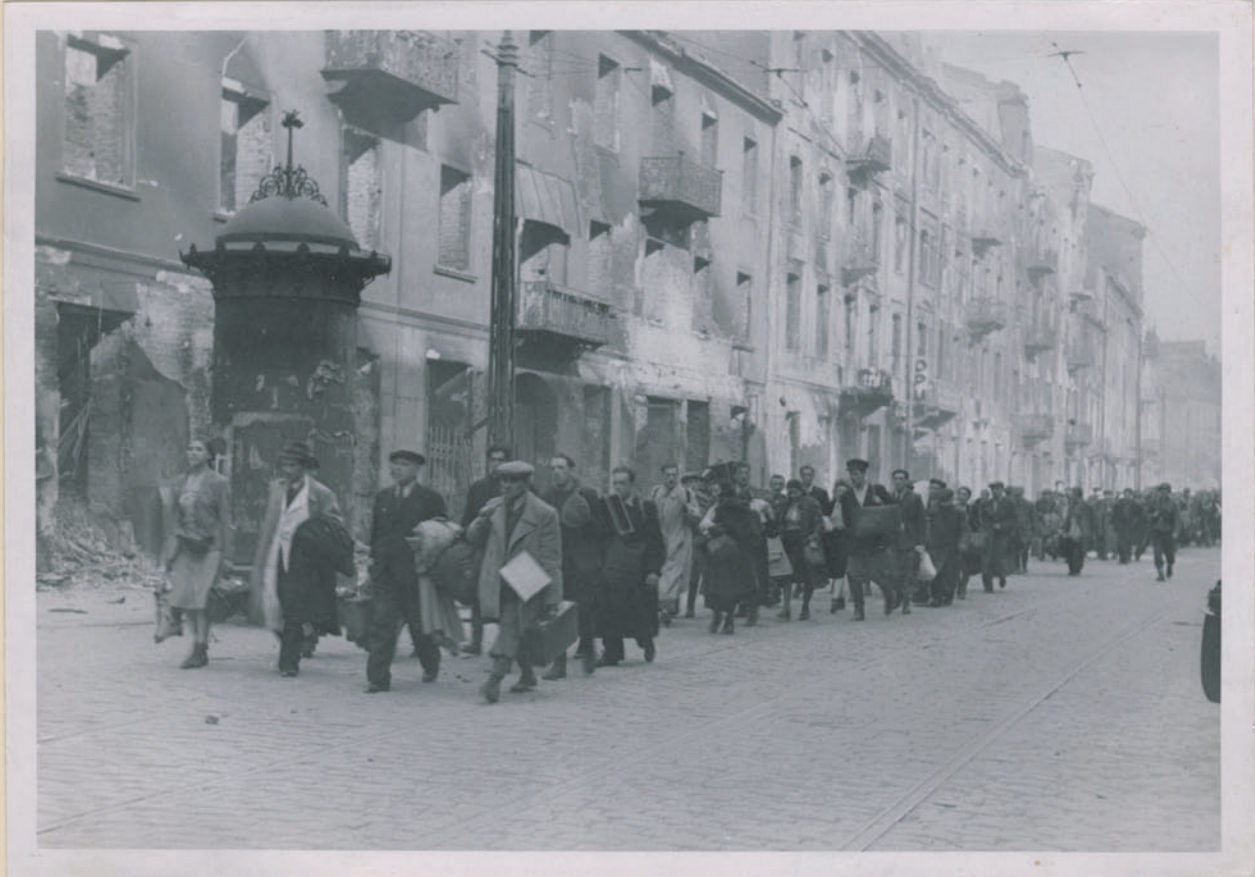
~ Martę zimą Dworcową w Łodzi. ~

Archiwum Główniej Komisji Badania Zbrodni Niem. w Polsce Dok. N. 5/202 x-Str. 4499 4531