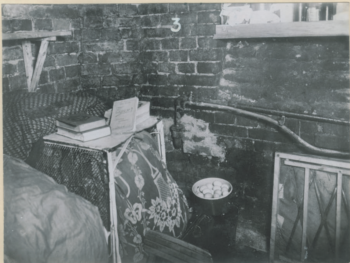
~ Bildnis aus dem Lager der Gefangenen. ~

Archiwum Głównej Komisji Badania Zbrodni Niem. w Polsce Dok. N. 26/2022-705.4524