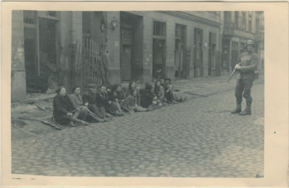
~ Osiad w Brinkowen unter der Erde während der Gefangenschaft. ~

Główna Komisja Badania Zbrodni Niem. w Polsce