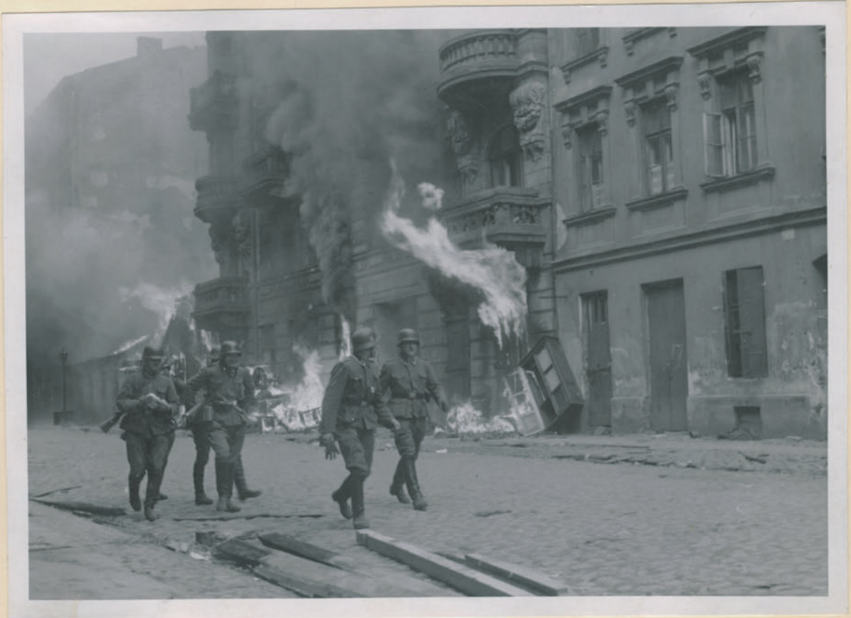
~ Ein Großtrupp. ~

Archiwum Głównej Komisji Badania Zbrodni Niem. w Polsce