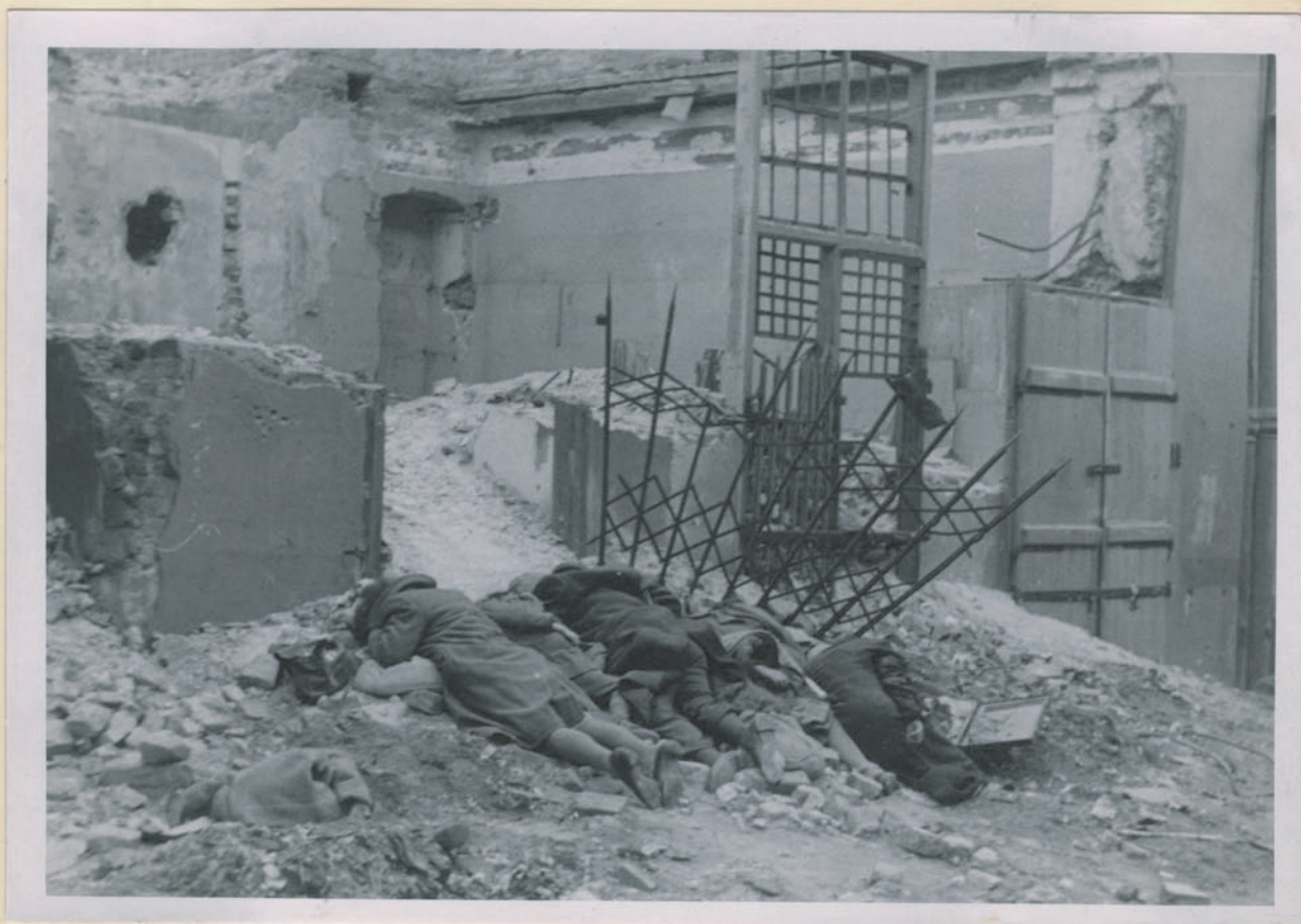
~ Im Ocamp rozciągata Banditów. ~

Archiwum Główniej Komisji Badania Zbrodni Niem. w Polsce Dok. N. 16/2022-Inv. 4519.