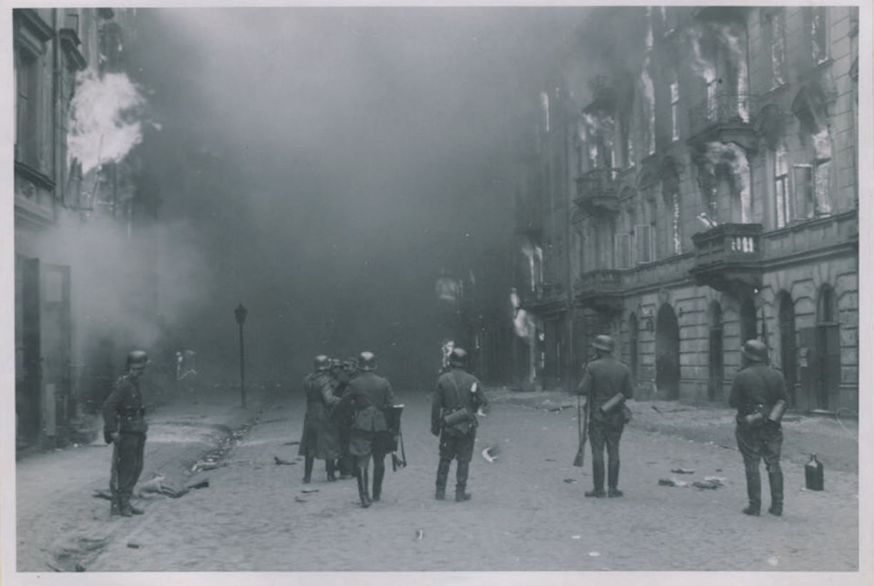
— Обстрел улицы в Варшаве немцами. —

Dok. N. 19/202 x - Jns 4579