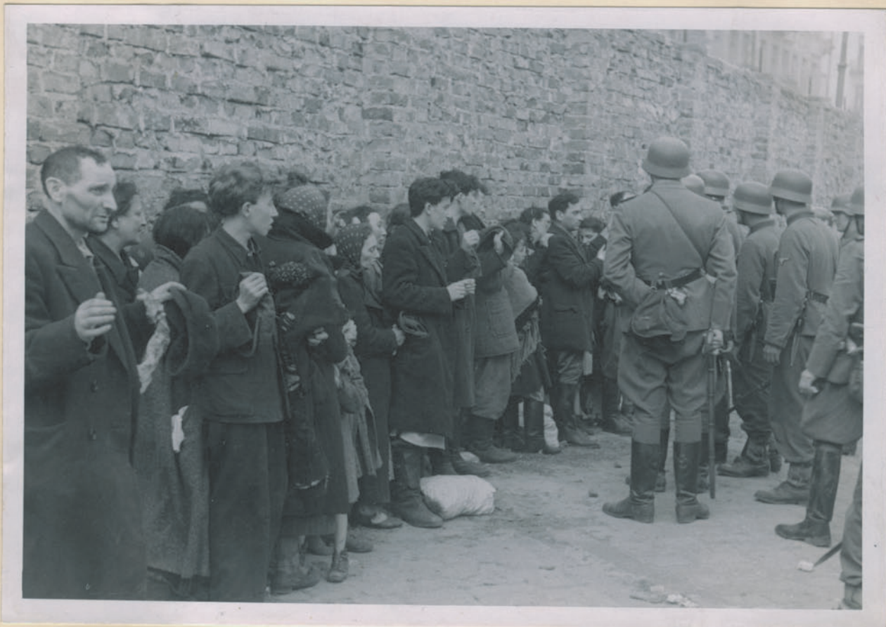
— Durchsicherung und Durchf. —

Archiwum Głównej Komisji Badania Zbrodni Niem. w Polsce Dok. N. 8/202x-Inv. 4502