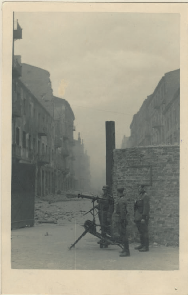
~ Dok. Dok. Dinspüßing ~

Archiwum Głównej Komisji Badania Zbrodni Niem. w Polsce Dok. N. 28/2028-Inv. 4528