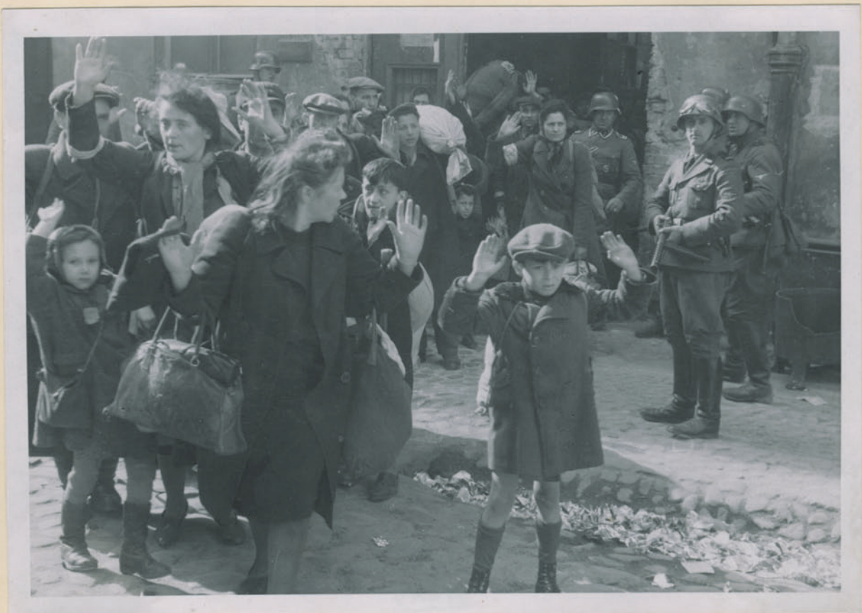
~ Życie Ojca i matki z Bratniejowia, 1945. ~

Archiwum Głównej Komisji Badania Zbrodni Niem. w Polsce Dok. N. 12/2024-100 4304