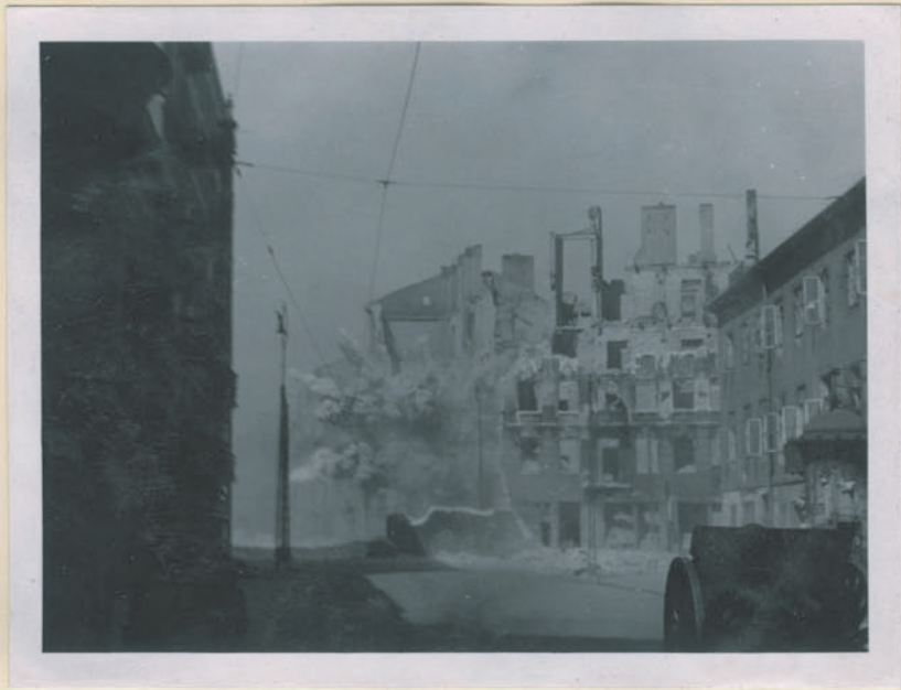
~ Die Ruinspinnung eines Wohnhauses in Breslau. ~