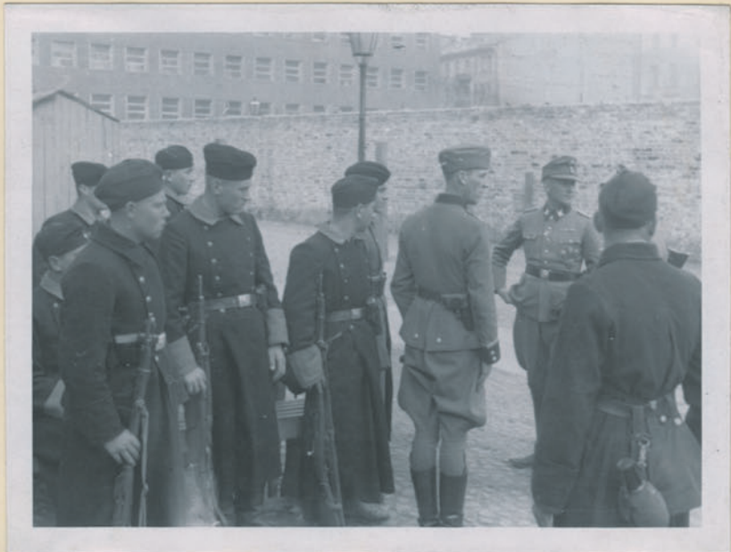
~ Oberleit, die mit einzugelagt worden. ~

Archiwum Głównej Komisji Badania Zbrodni Niem. w Polsce Dok. N. 58/2022 Ino. 4535