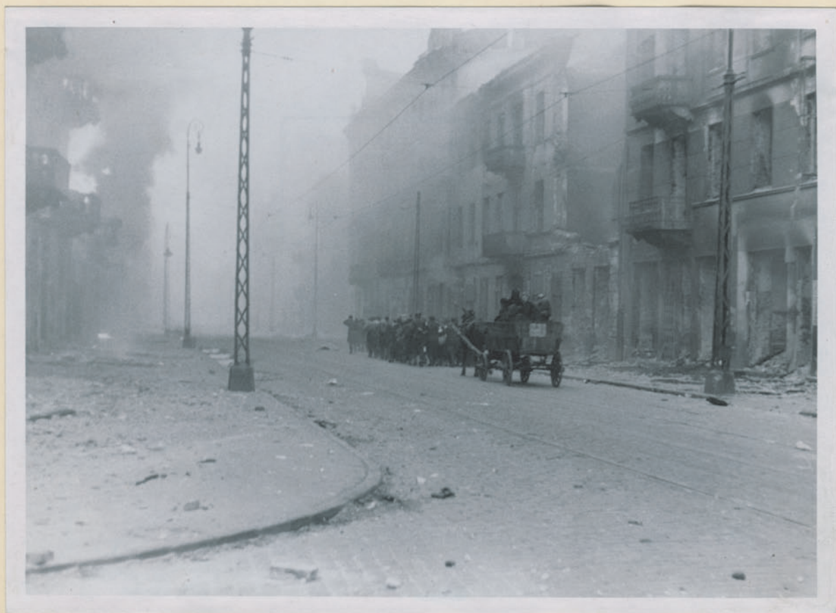
~ To jest ulica w Krakowie. Jechał tu oddział niemiecki na wozach konnych. ~

Archiwum Głównego Komisariatu Badania Zbrodni Niem. w Polsce Dok. N. 35/2022 - Ino 43292 4541