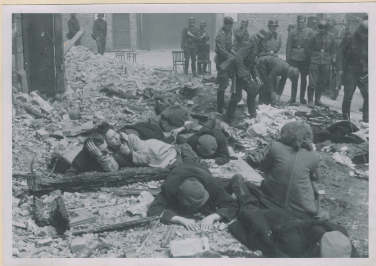
~ Totem mit einem Bruder in Kriegsgefangen. ~

Archiwum Głównej Komisji Badania Zbrodni Niem. w Polsce Dok. N. 14/202 X - Jm. # 4509