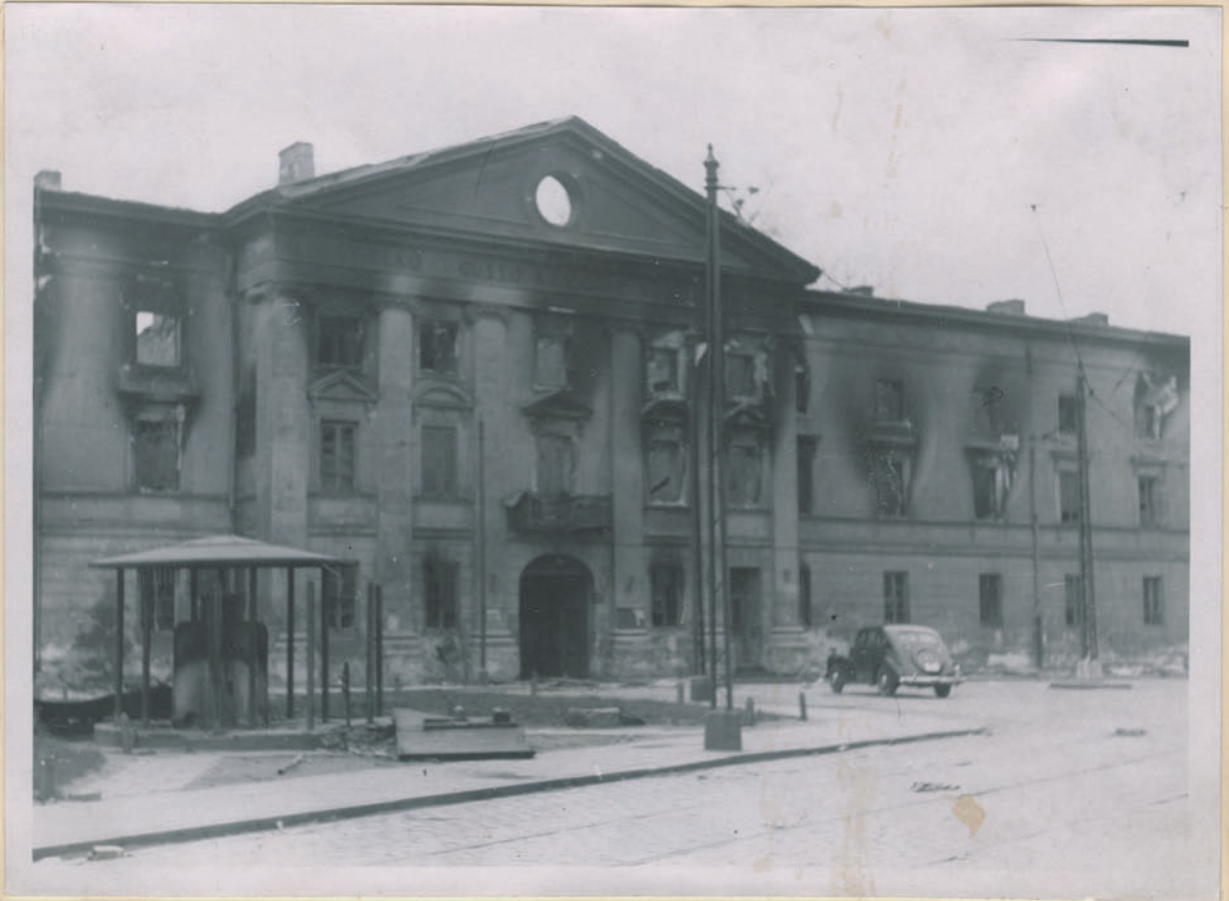
— Das Gebäude des nationalen Judentums. —

Archiwum Główniej Komisji Badania Zbrodni Niem. w Polsce