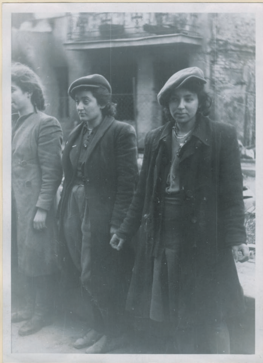
~ Wit Doffmeyerowa Dwiercowa z Galiżmowa ~