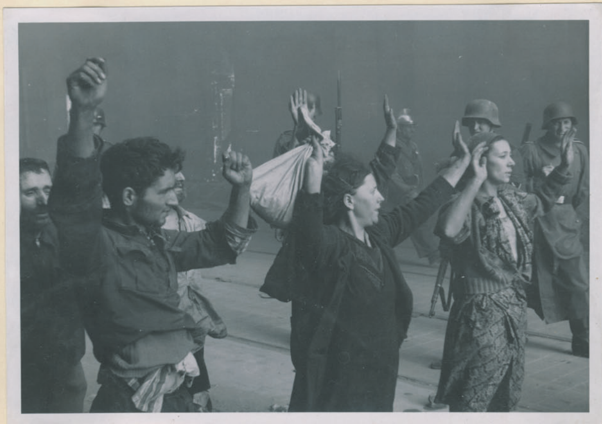
~ Diebstahlbanditen verweigerten sich mit der Waffe. ~