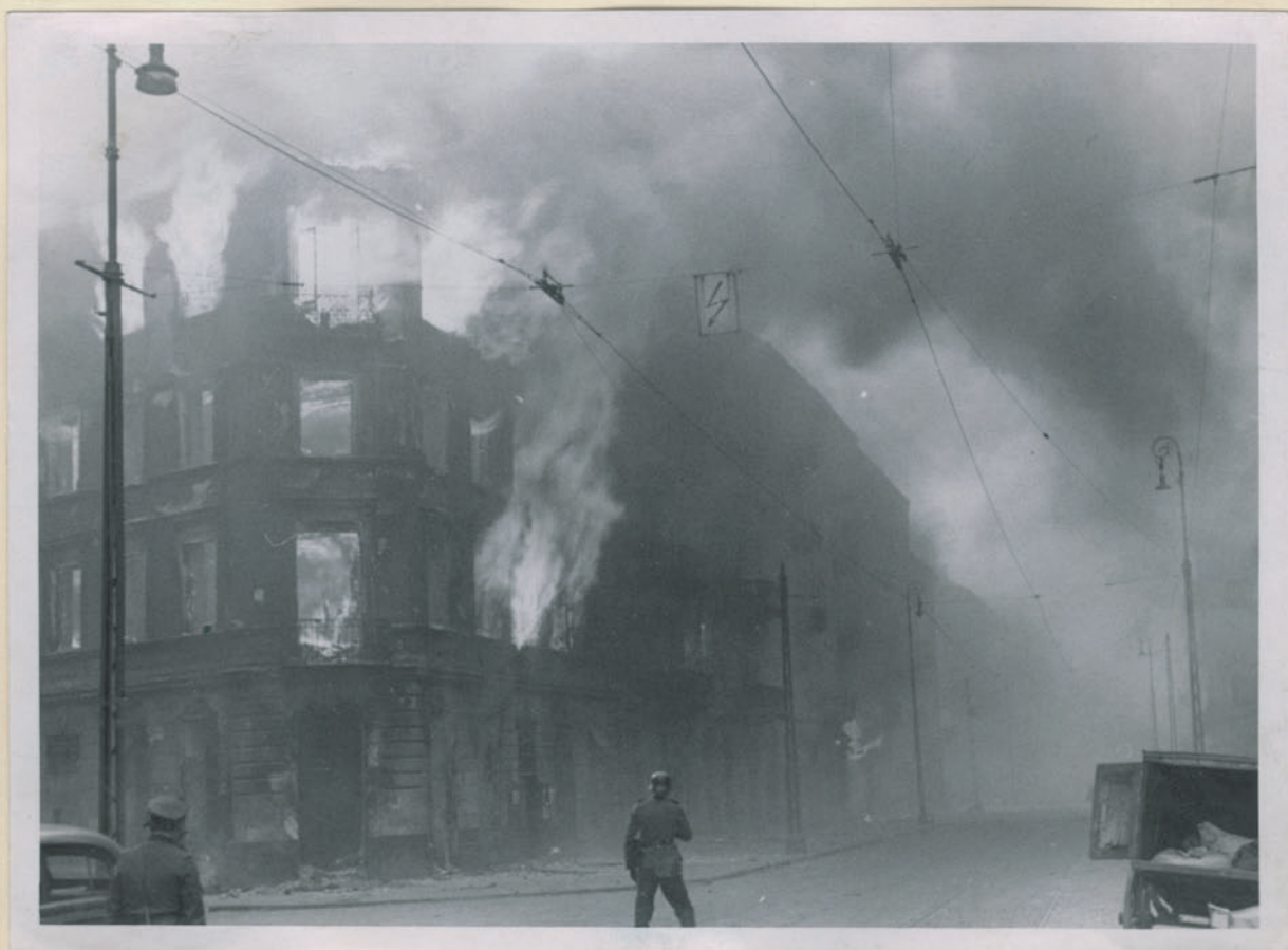
~ Brennpunkt eines Bombenbetr. ~

Archiwum Głównej Komisji Badania Zbrodni Niem. w Polsce Dok. N. 21/2022-Lnc 4574