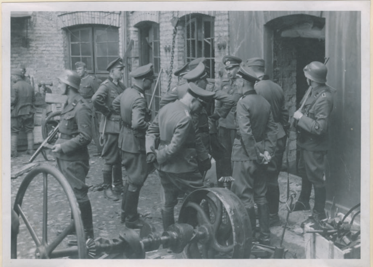
— Die Deutschen sind Briten und sind im Krieg.

Archiwum Głównej Komisji Badania Zbrodni Niem. w Polsce Dok. N. 5/202x-Inv. 4499