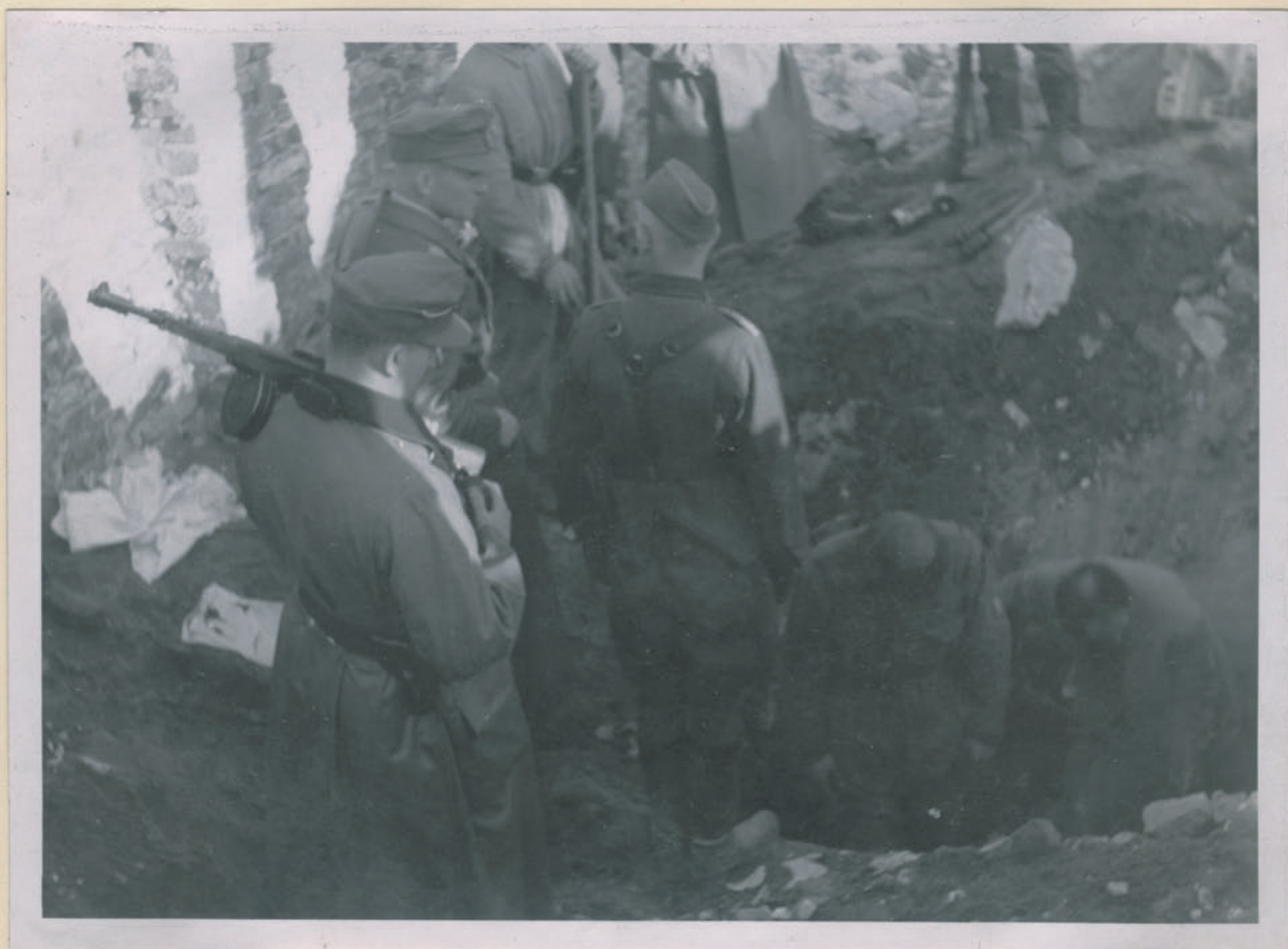
— Ein Bündel wird geöffnet. —

Archiwum Głównej Komisji Badania Zbrodni Niem. w Polsce Dok. N. 12/2028-Lw. 45-12