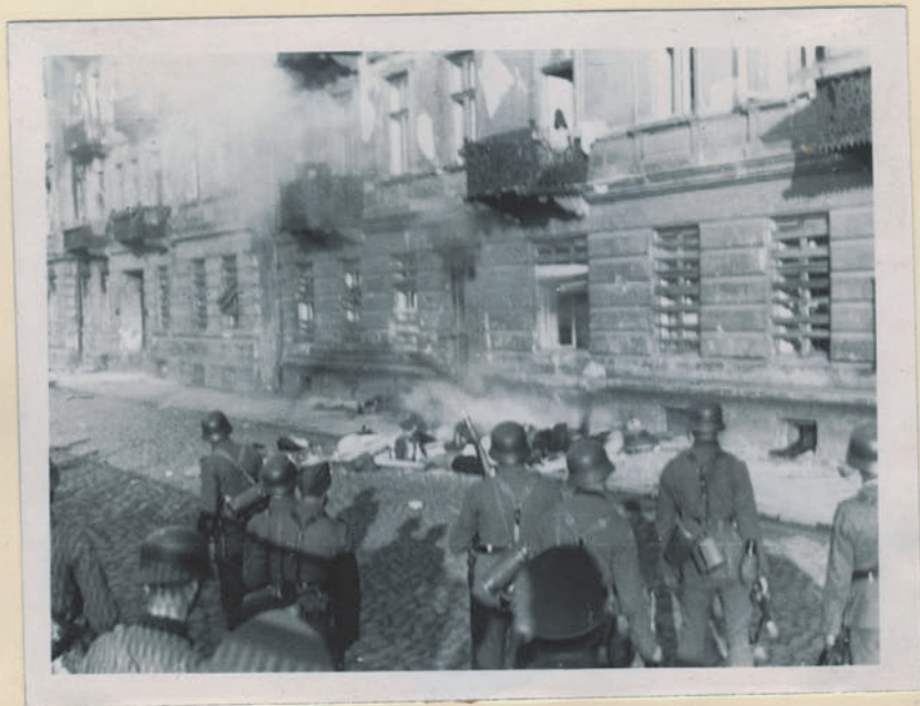
~ Олсгипкннгам Вондтан. ~