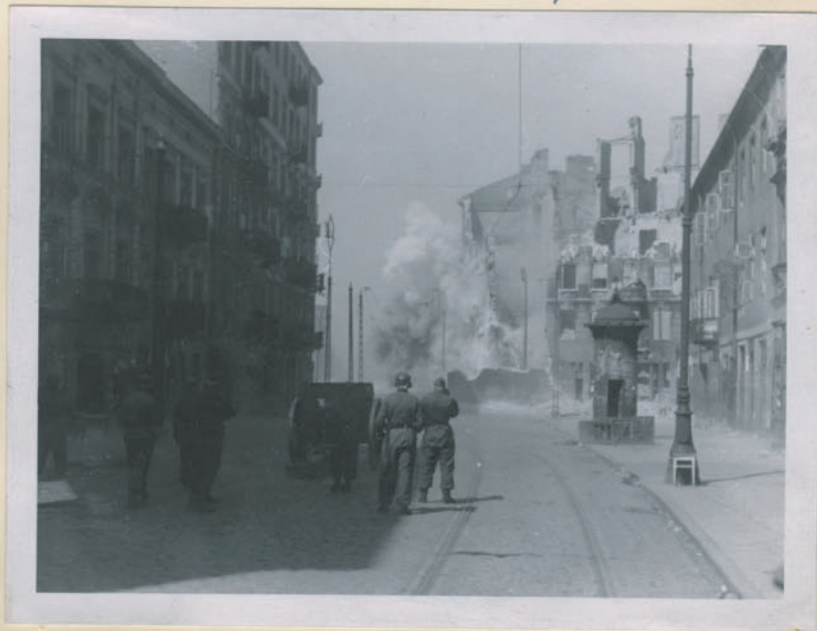
~ Brückengänge unter der Erde während der Gefangenschaft. ~