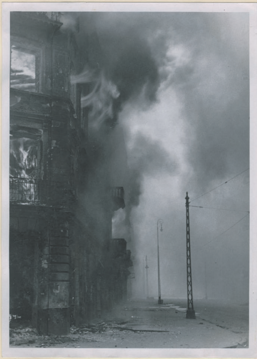
— Ein Bombensturz wird verurteilt. —

Dok. N. 84/208 x - Lns. 4520