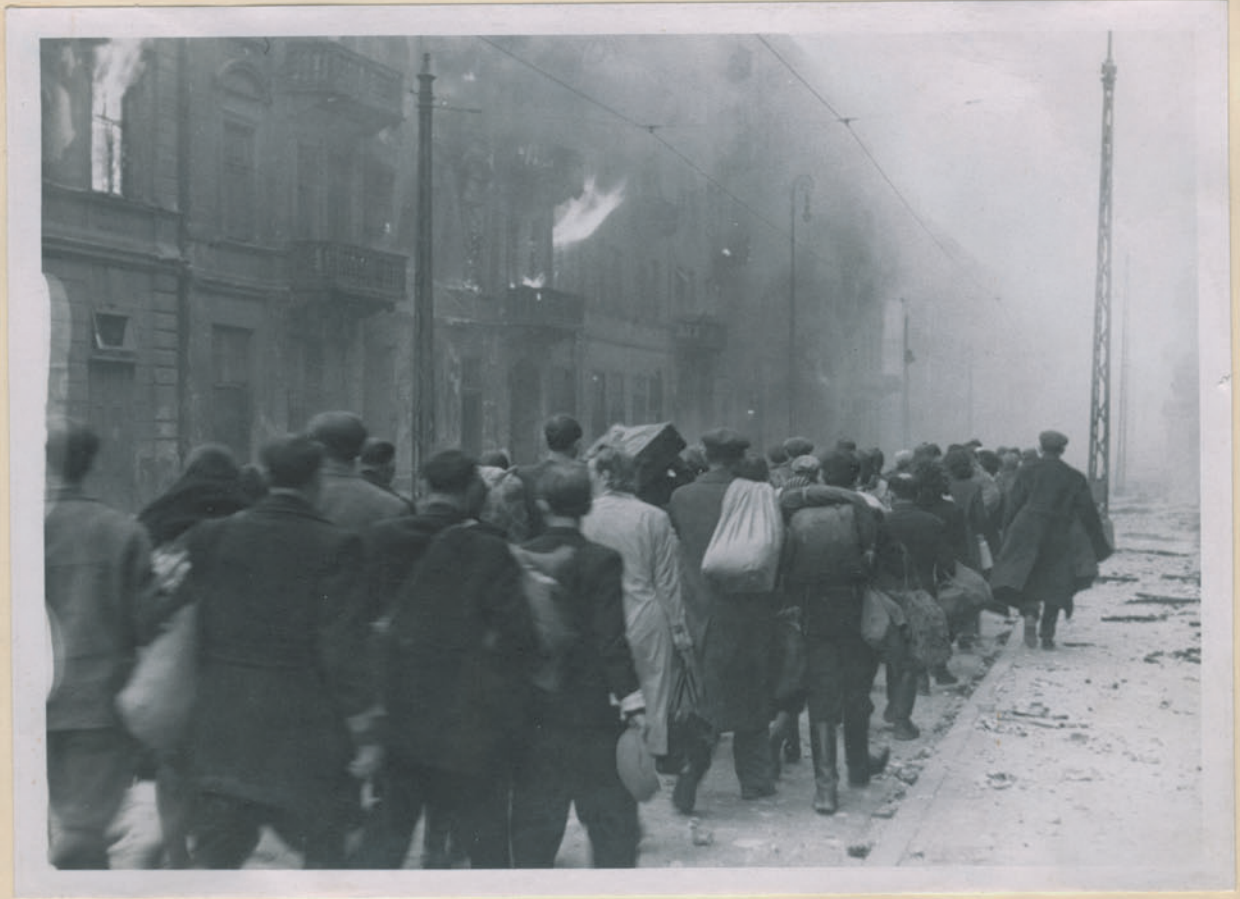
~ Chang am Untereingangplatz. ~

Arciwum Głównej Komisji Badania Zbrodni Niem. w Polsce Dok. N. 2/202 x - Inv 4501