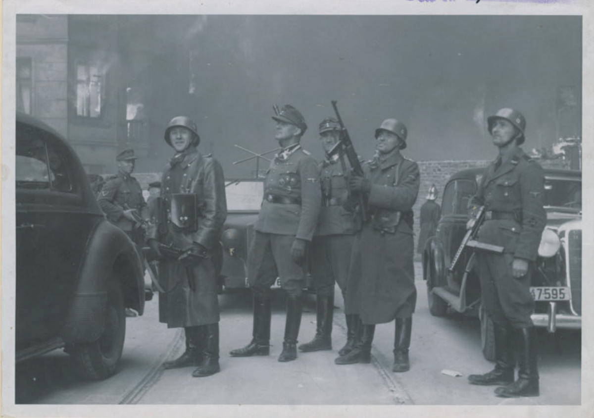
~ Die Figuren der Großartion. ~

Archiwum Głównej Komisji Badania Zbrodni Niem. w Polsce Dok. N. 58/2022 Ino. 4535