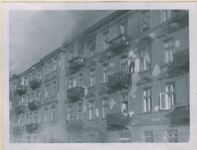
~ Die Brandruine eines Hauses in Breslau. ~