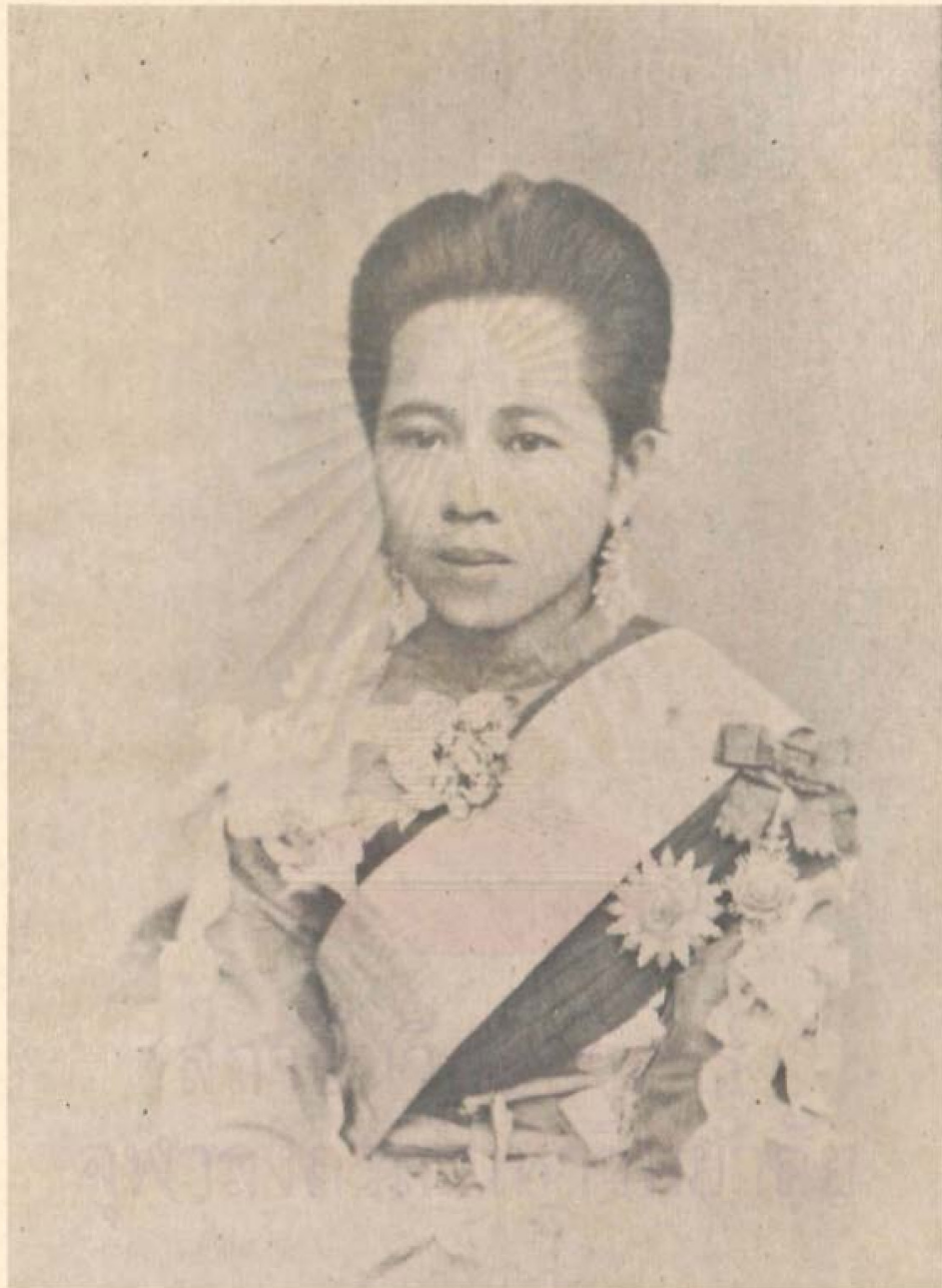
พระวิมาดาเธอ กรมพระสุทธาสินีนาฏ ปิยมหาราชปดิวรัดา พระรูปฉายเมื่อปีกุน พ.ศ. ๒๔๓๐ พระชันษา ๒๔