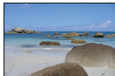
Abers - Finistère, Bretagne

novembre à la bibliothèque des Champs libres de Rennes où neuf wikipédiens se sont réunis pour exploiter les fonds de la bibliothèque.