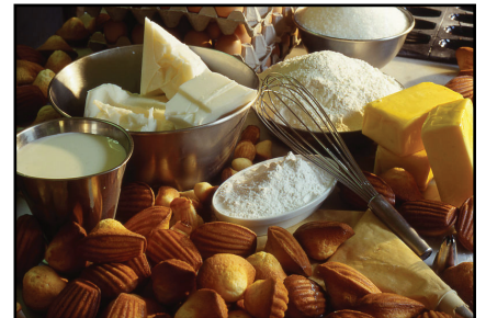
Recette pour la madeleine

Le soutien se fait essentiellement par le biais de formations initiales à la contribution . Les institutions animent elles-mêmes leur projet, et peuvent s'appuyer sur l'association pour obtenir une aide ou des compléments de formation .