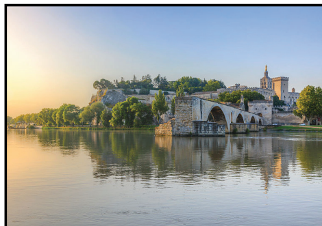
Saint-benezet in southeastern France

Pour ce premier atelier quinze personnes ont répondu présentes.