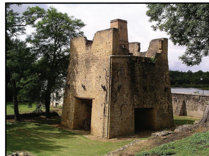
Brocas fourneau

Les développeurs, cartographes, photographes, designers, traducteurs, vidéastes, professionnels ou en herbe, et tous les curieux sont invités à participer à des animations (cartoparties, hackathon, wikiparties...) des formations (OpenStreetMap, Wikipédia, Wikimedia Commons, Creative Commons...) et des ateliers de production et valorisation des données et contenus de leur commune .