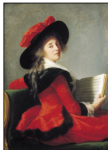
Vigée Le Brun Baronne de Crussol