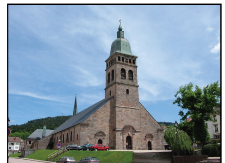
Gérardmer église

L'opération libre est une initiative de huit organisations travaillant autour des outils, licences, contenus et données libres. Elle a pour objectif de démontrer les opportunités de l'ouverture des données et contenus pour les communes à travers une mobilisation inédite sur un territoire pilote.