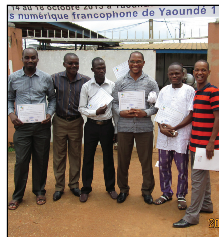
Quelques participants à la formation Afripédia à Yaoundé

En octobre, une nouvelle version de Wikipédia a pu être intégrée au projet. Le Wiktionnaire et ses 2,5 millions d'entrées est dorénavant disponible hors-ligne et a été ajouté aux contenus disponibles pour le projet.