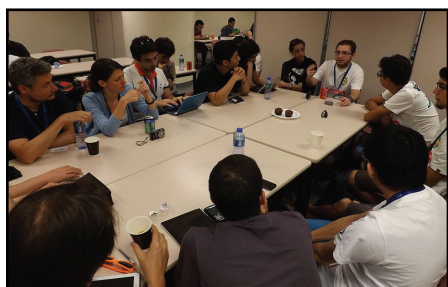
Iberocoop Meeting at Wikimania

La troisième rencontre ibéro-américaine s'est tenue à Mexico du 12 au 15 octobre 2013. Elle a réuni des membres des chapitres argentin, brésilien, chilien, colombien, espagnol, italien, mexicain, portugais, uruguayen et vénézuélien. Des représentants de la fondation et du programme « Chapters dialogue » étaient également présents.