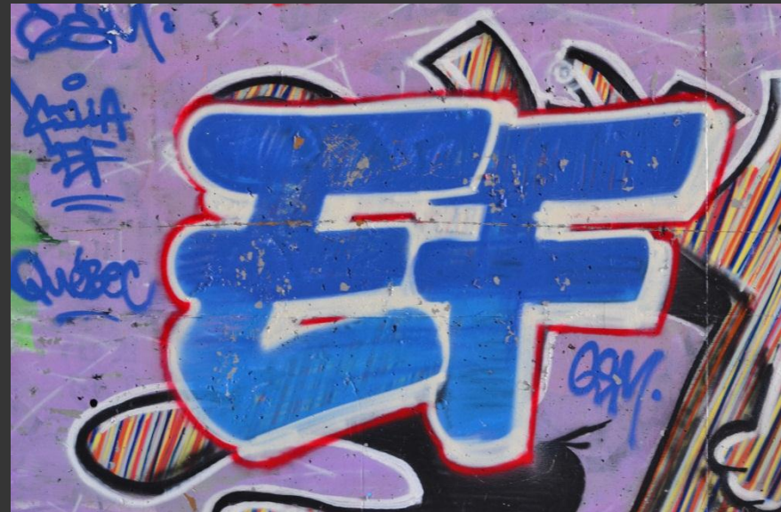
Un graffiti, Antoine Letarte, CC BY-SA 3.0