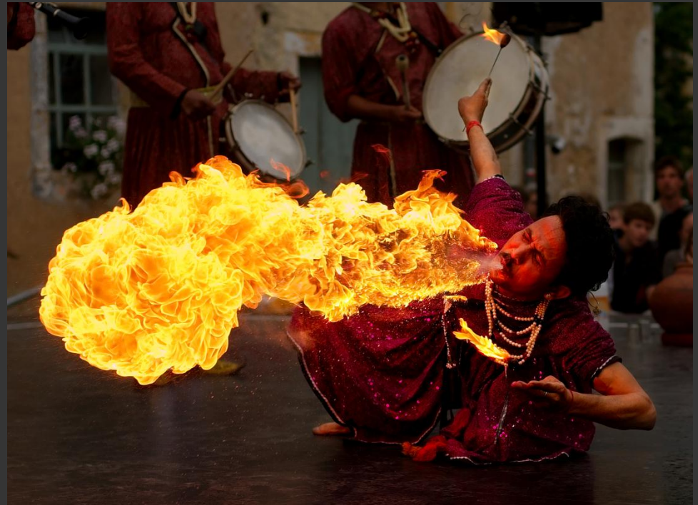
Un cracheur de feu, deuxième au concours POTY 2008.