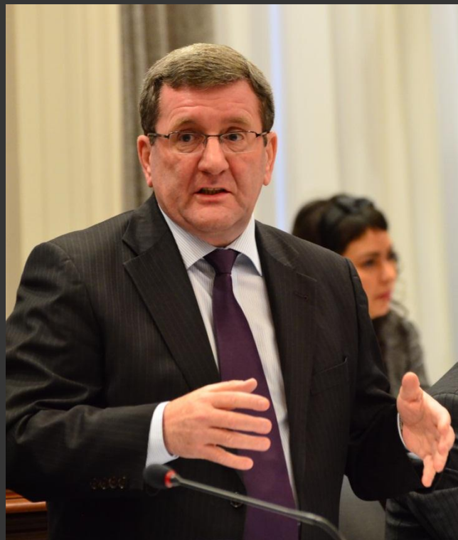
Le maire Régis Labeaume lors d'un conseil municipal, Antoine Letarte, CC-BY-SA 3.0