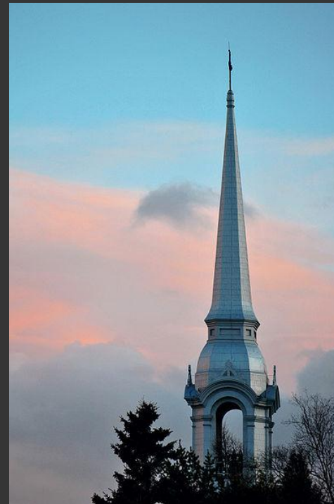
Le clocher de l'église de Pointe-au-Pic, Antoine Letarte, CC-BY-SA 3.0