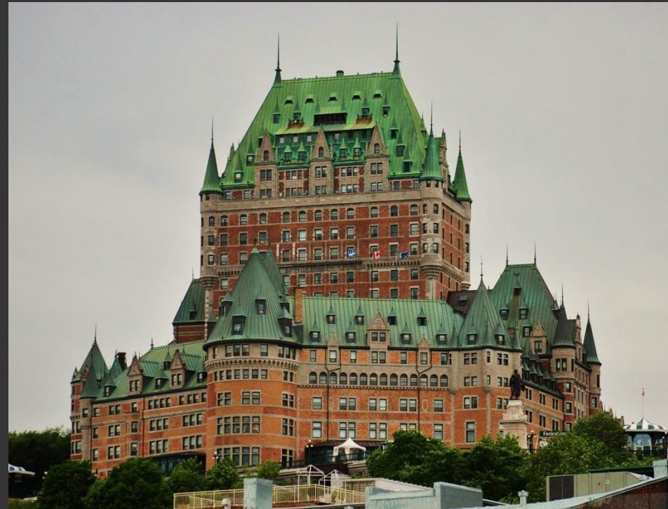
Le Château Frontenac, Antoine Letarte, CC-BY-SA 3.0