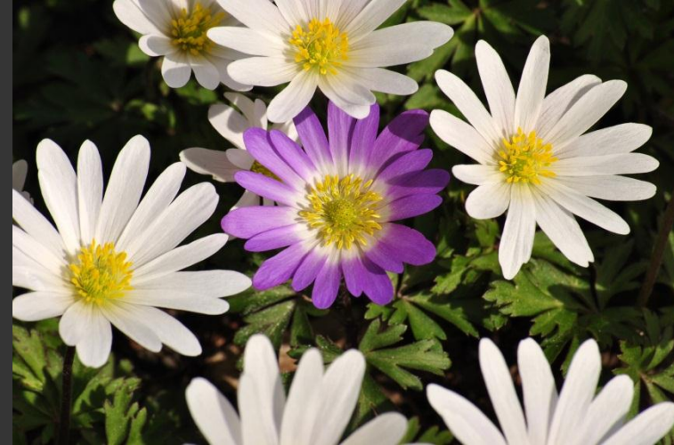
Spécimens d' Anemone Blanda , Antoine Letarte, CC-BY-SA 3.0

Voir le texte de la licence CC-BY-SA 3.0 à cette adresse: http://creativecommons.org/licenses/by-sa/3.0/legalcode