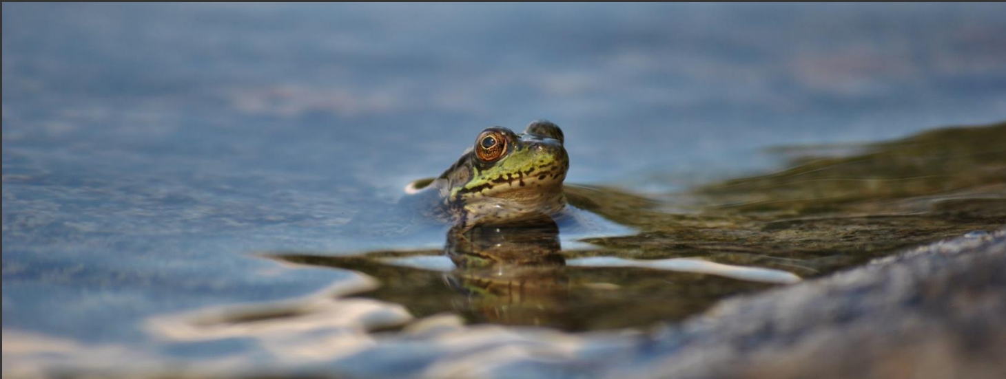
Une grenouille Rana Septentrionalis , Antoine Letarte, CC-BY-SA 3.0