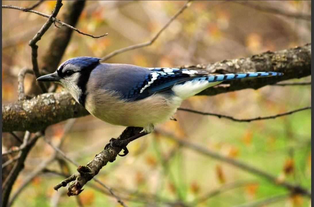
Un geai bleu près de chez moi. Antoine Letarte, CC-BY-SA 3.0