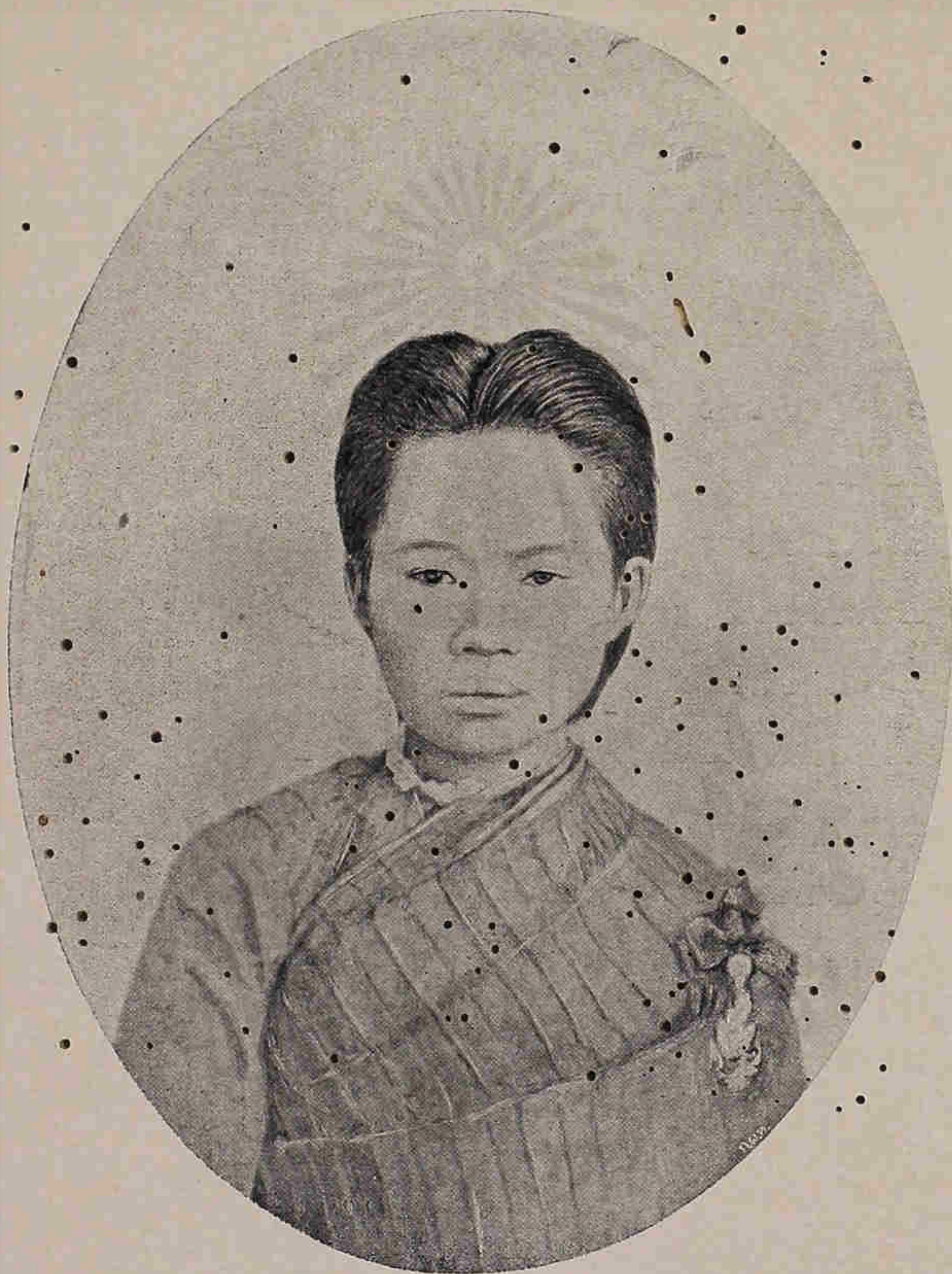
พระรูปสมเด็จพระปิตุจฉาเจ้าสุขุมาลมารศรี พระอัครราชเทวี นายเมือ พ.ศ. ๒๔๒๕