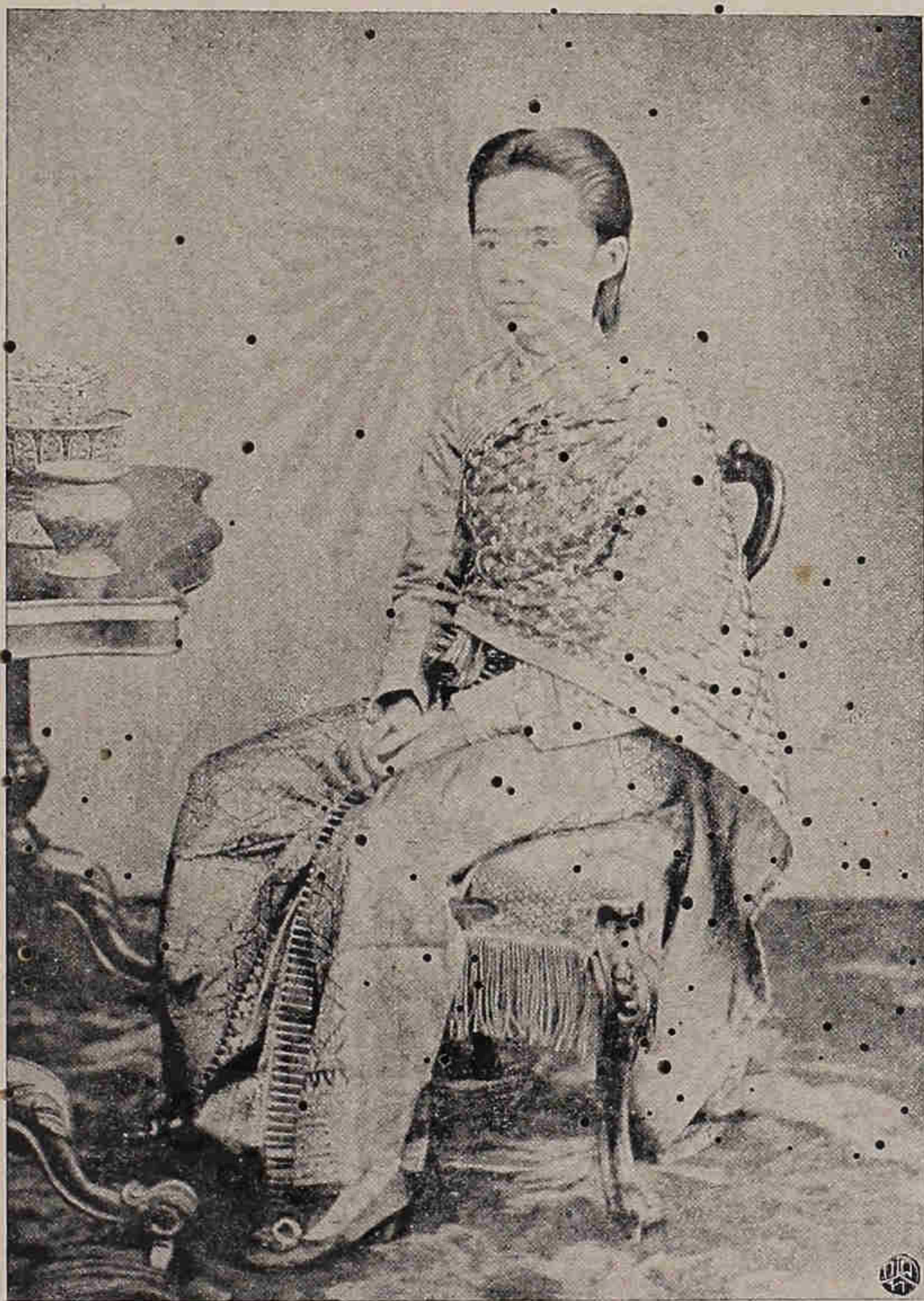
พระรูปสมเด็จพระปิตุจฉาเจ้า สุขุมมาลมารศรี พระอัครราชเทวี ฉายเมื่อ พ.ศ. ๒๔๒๒