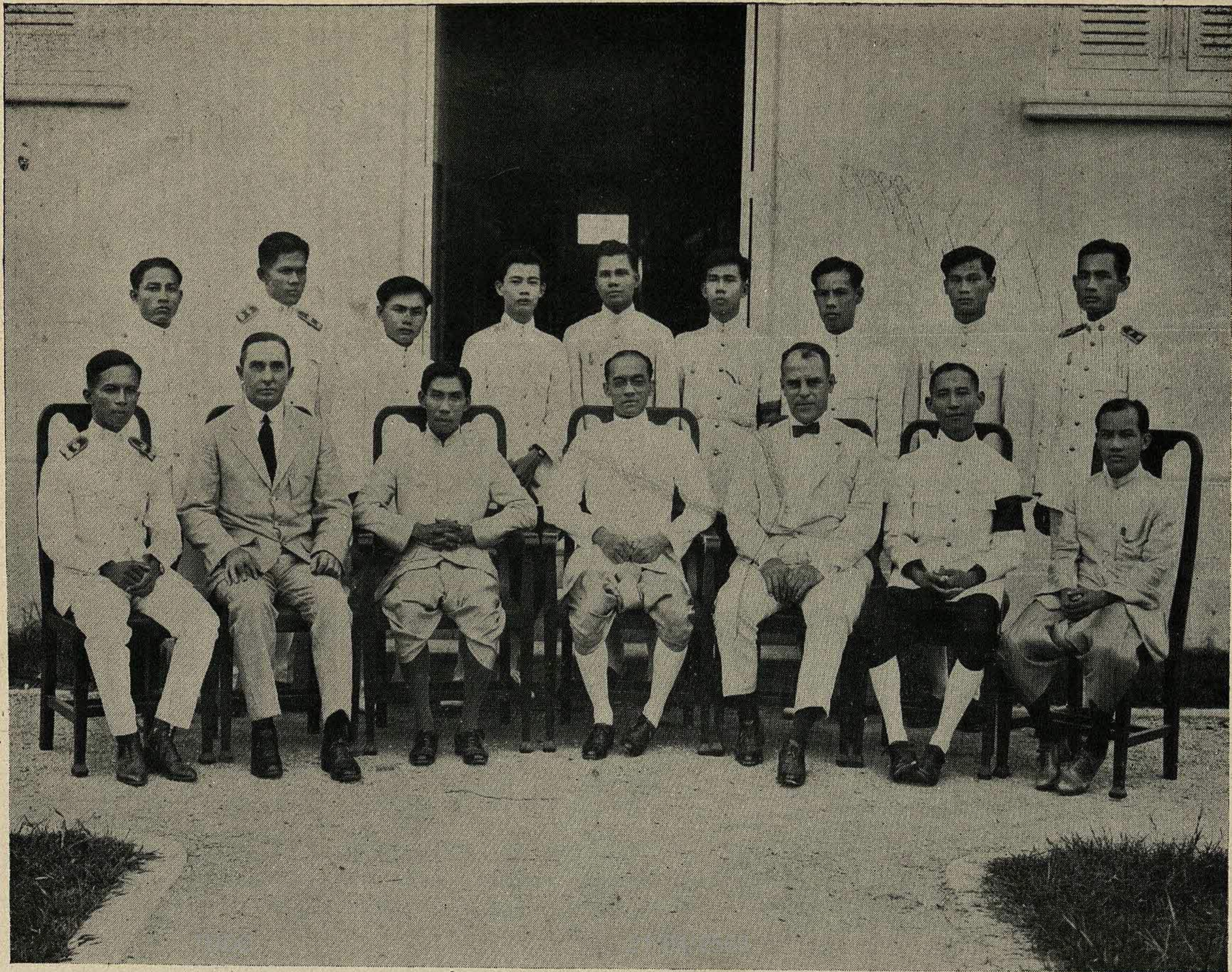
พระรูปสมเด็จพระเจ้าฟ้า ๗ กรมหลวงสงขลานครินทร์