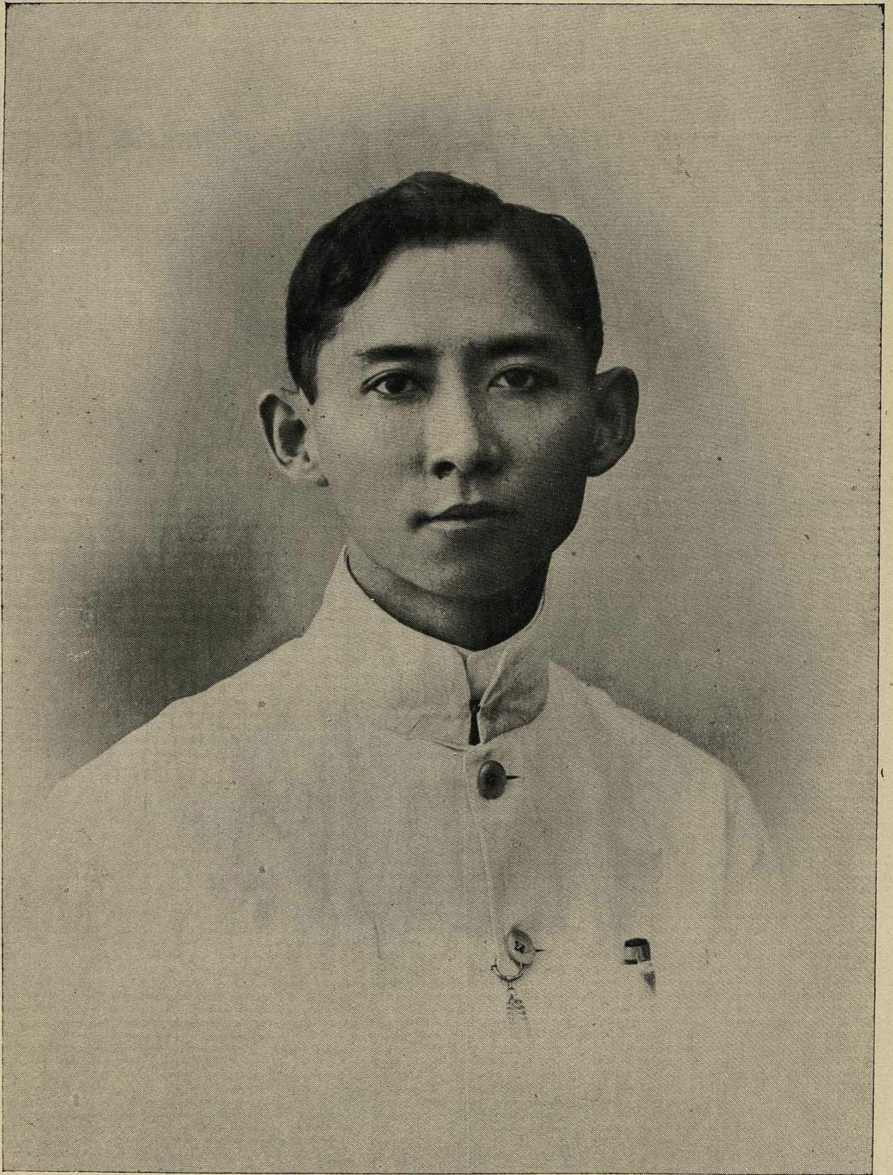
พระรูปสมเด็จพระเจ้าฟ้า ๗ กรมหลวงสงขลานครินทร์ นายเมือ พ.ศ. ๒๔๖๘