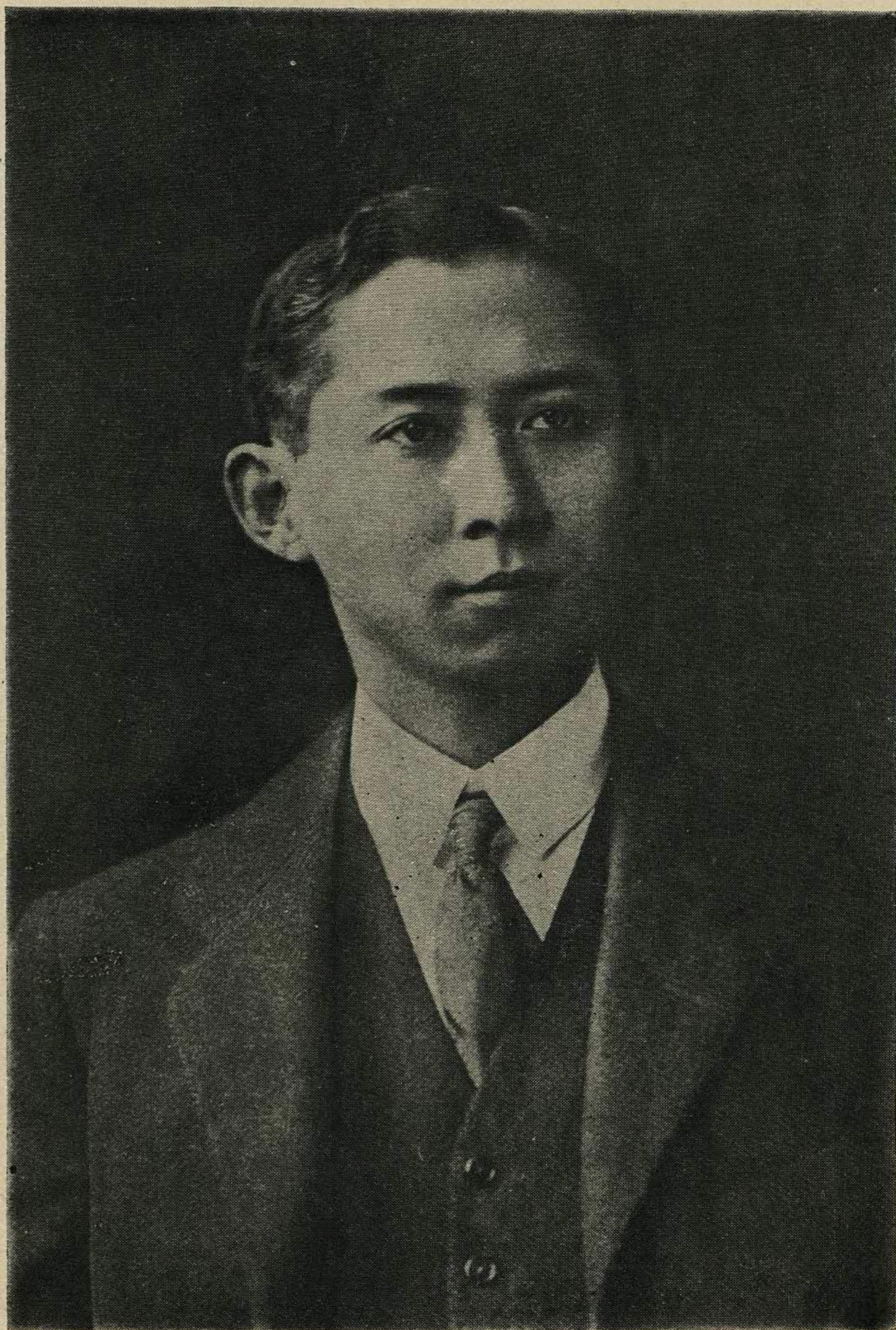
พระรูปสมเด็จพระเจ้าฟ้าฯ กรมหลวงสงขลานครินทร์ ฉายเวลาเสด็จไปทอดพระเนตรการแพทย์ประเทศอังกฤษ