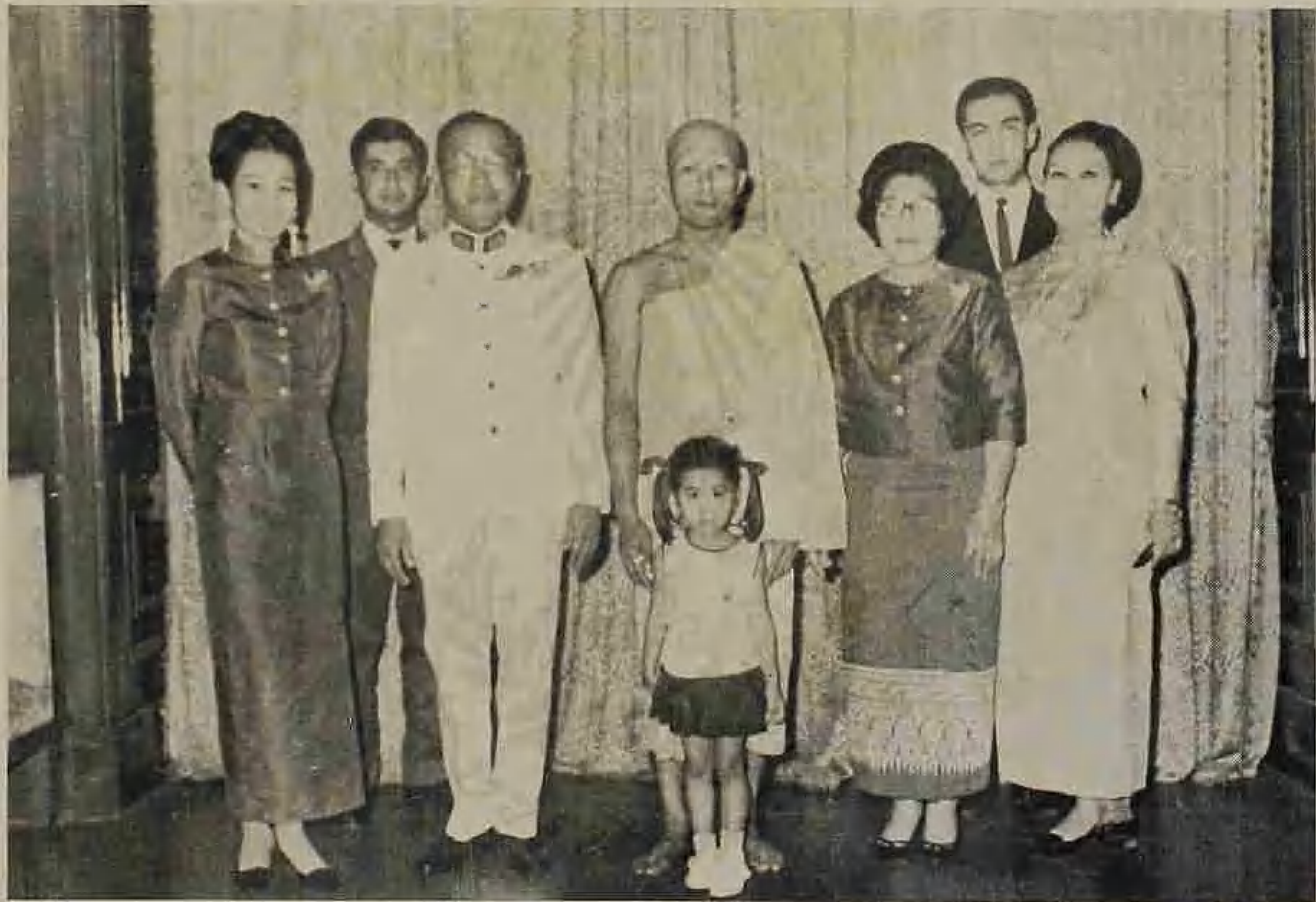
ถ่ายภาพพร้อมกับครอบครัว เมื่อลูกชายบวช พ.ศ. ๒๕๑๐