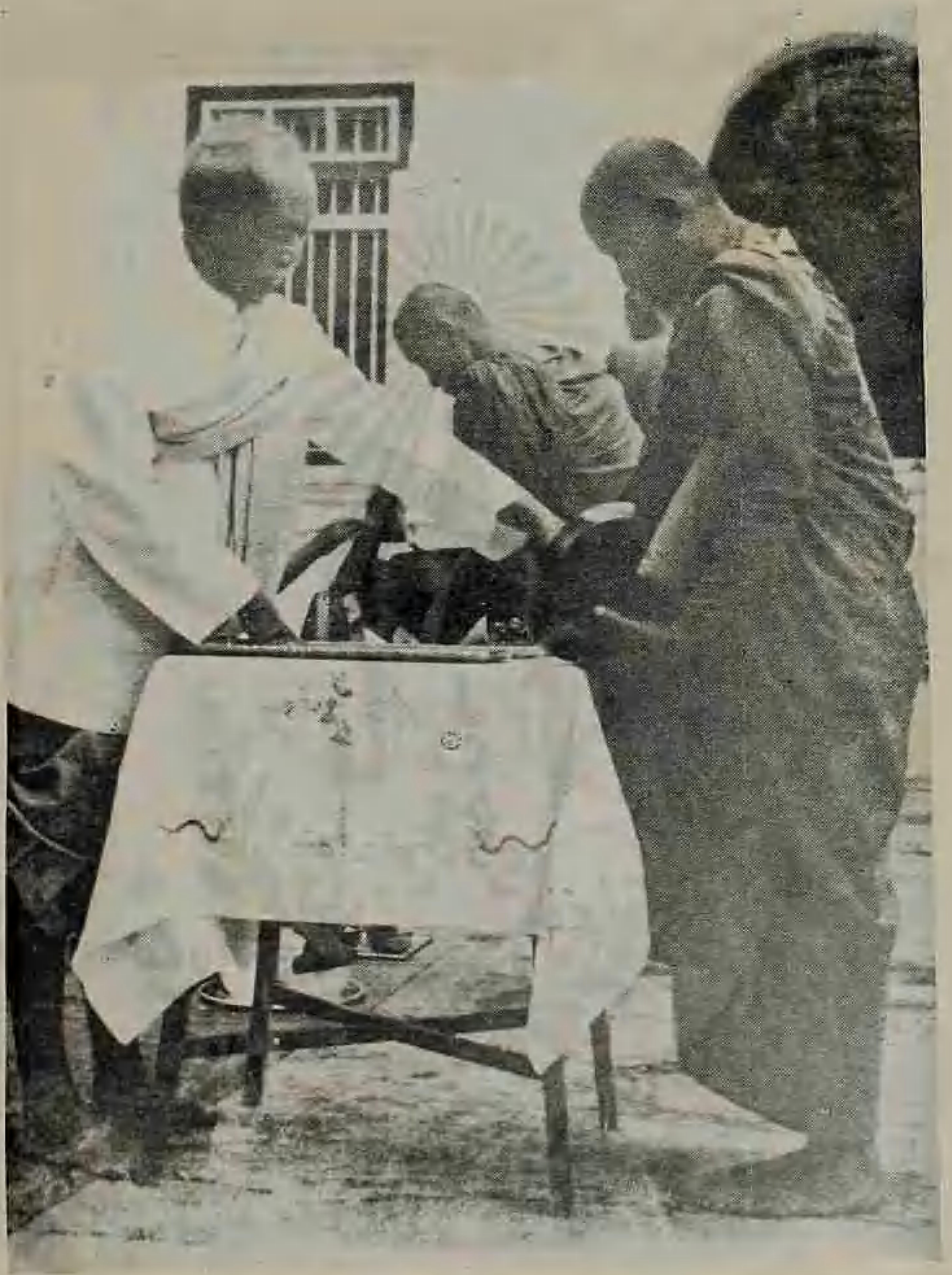
เสด็จพ่อทรงบาตรพระดัส พ.ศ. ๒๔๘๒