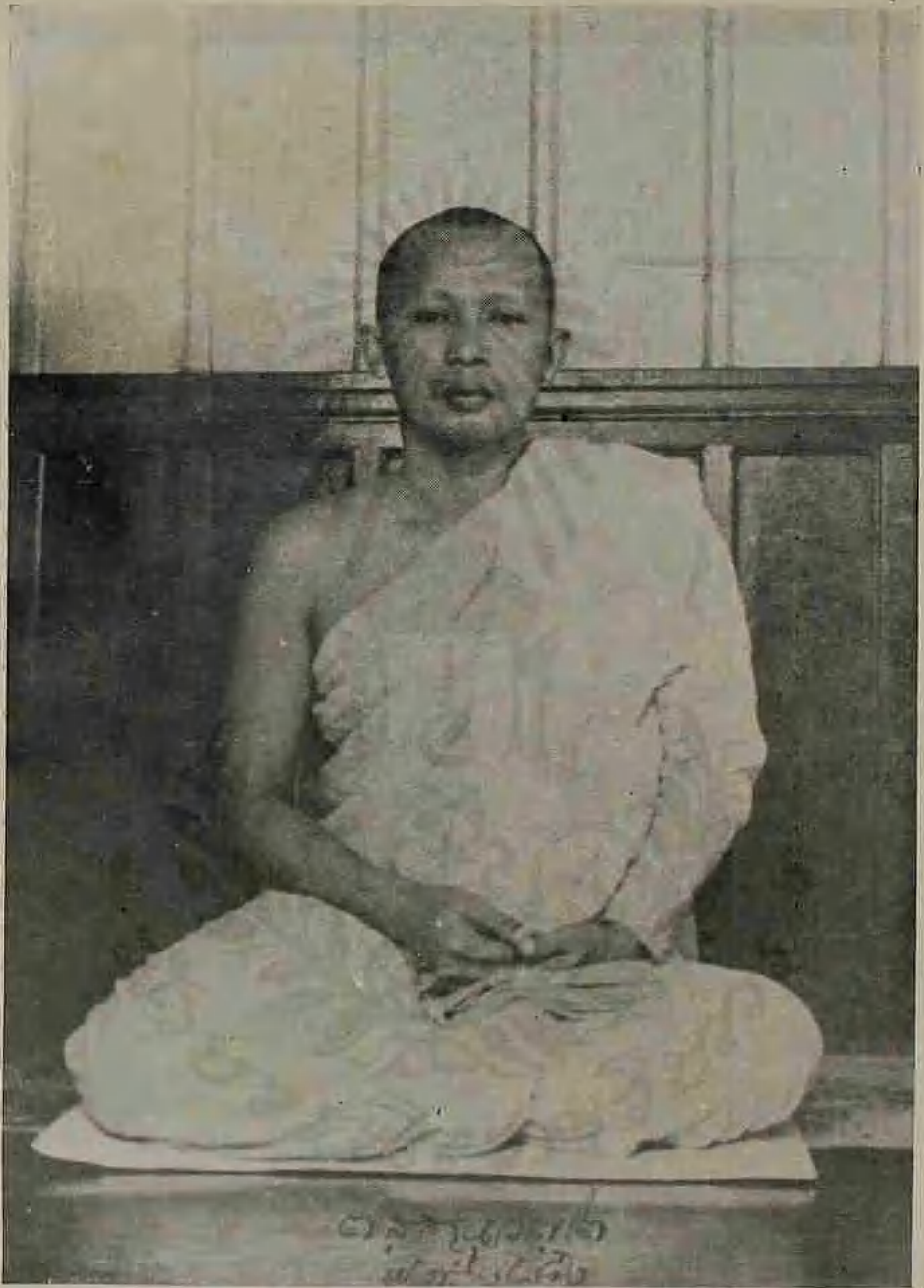
บวชพระอยู่วัดเทพศิรินทราวาส พ.ศ. ๒๔๘๒