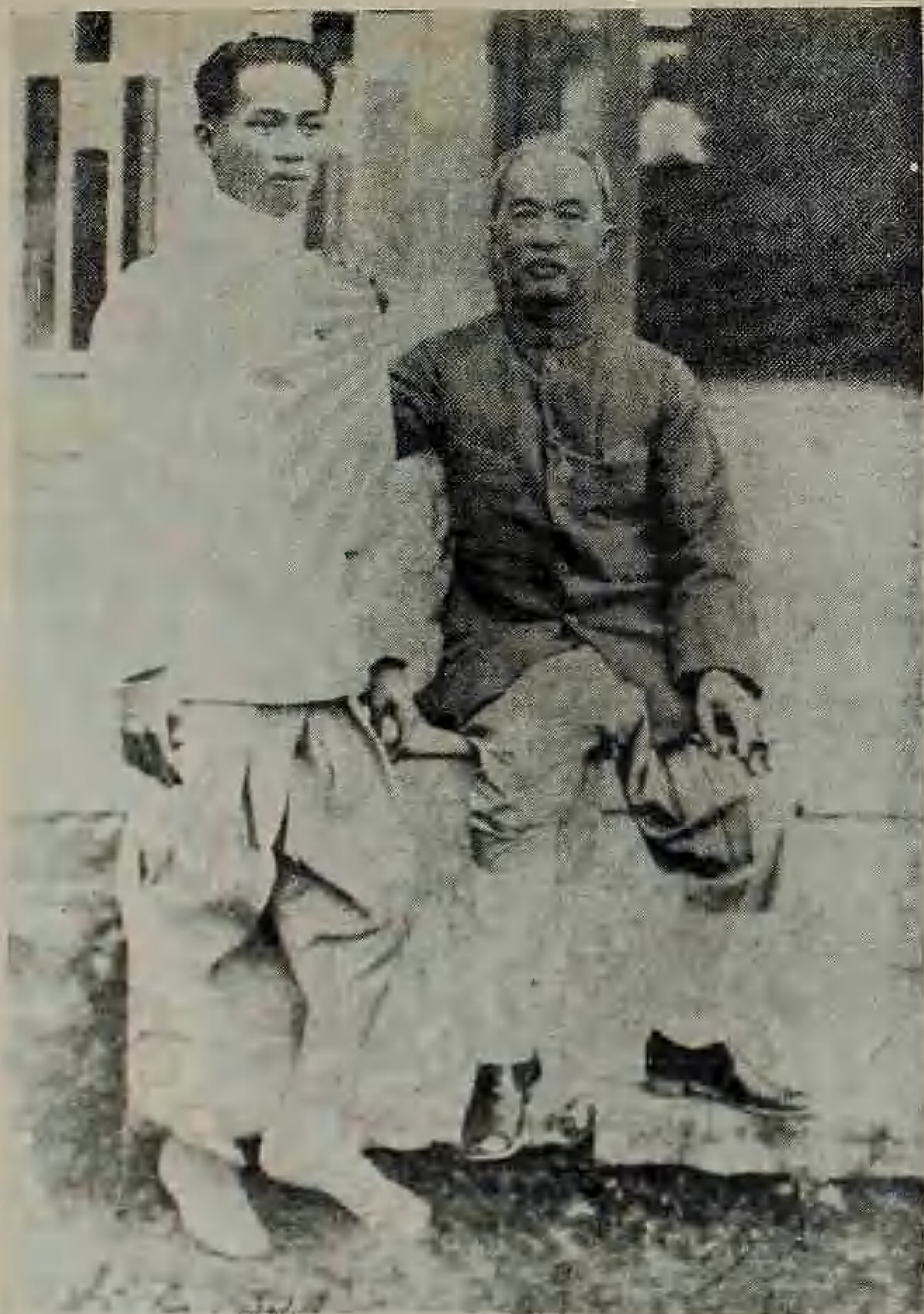
ถ่ายภาพเสด็จพ่อก่อนไปยุโรป พ.ศ. ๒๔๖๔