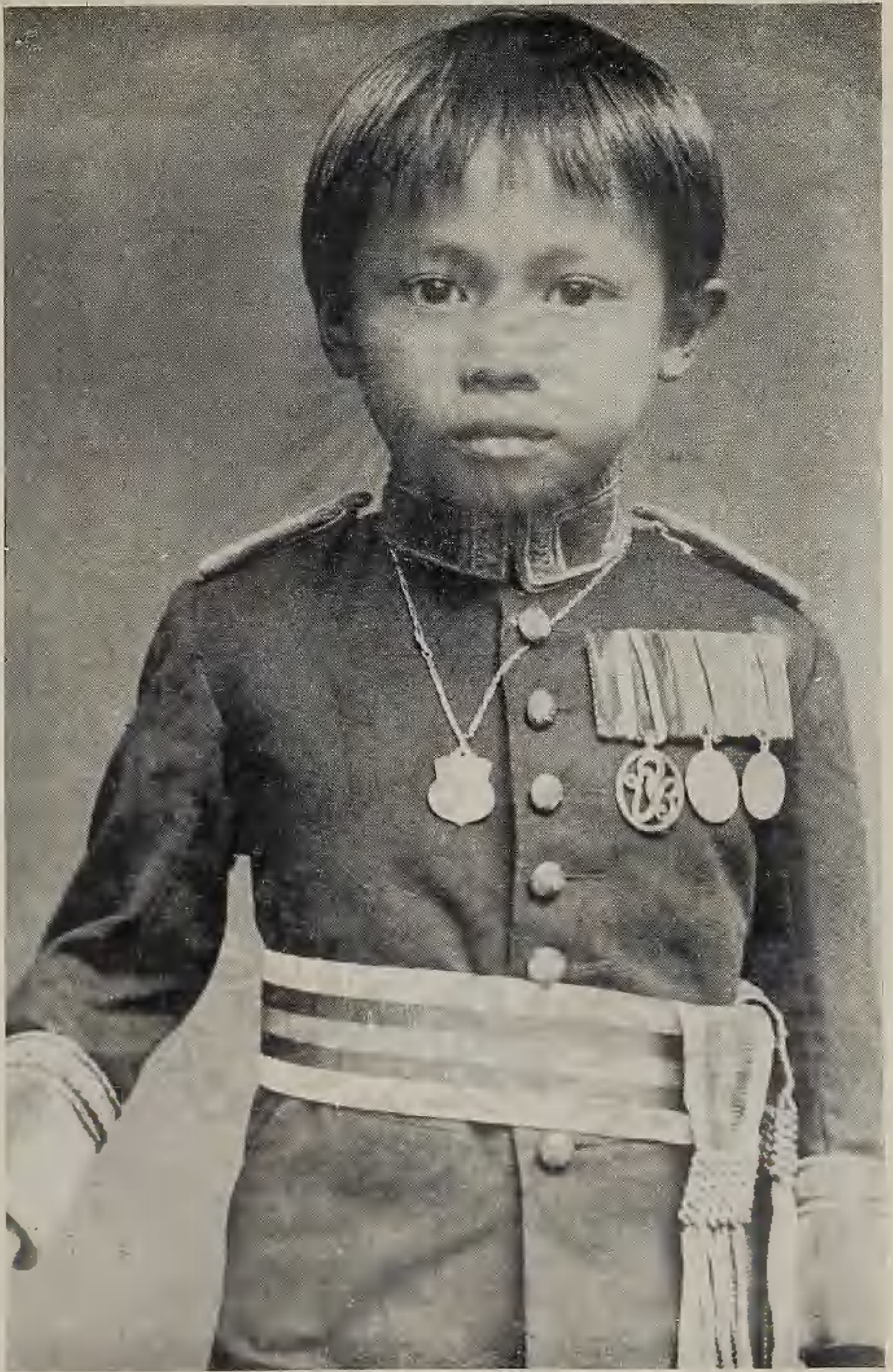
แต่งยูนีฟอร์มมหาดเล็กหลวงรัชกาลที่ ๕ พ.ศ. ๒๔๕๑