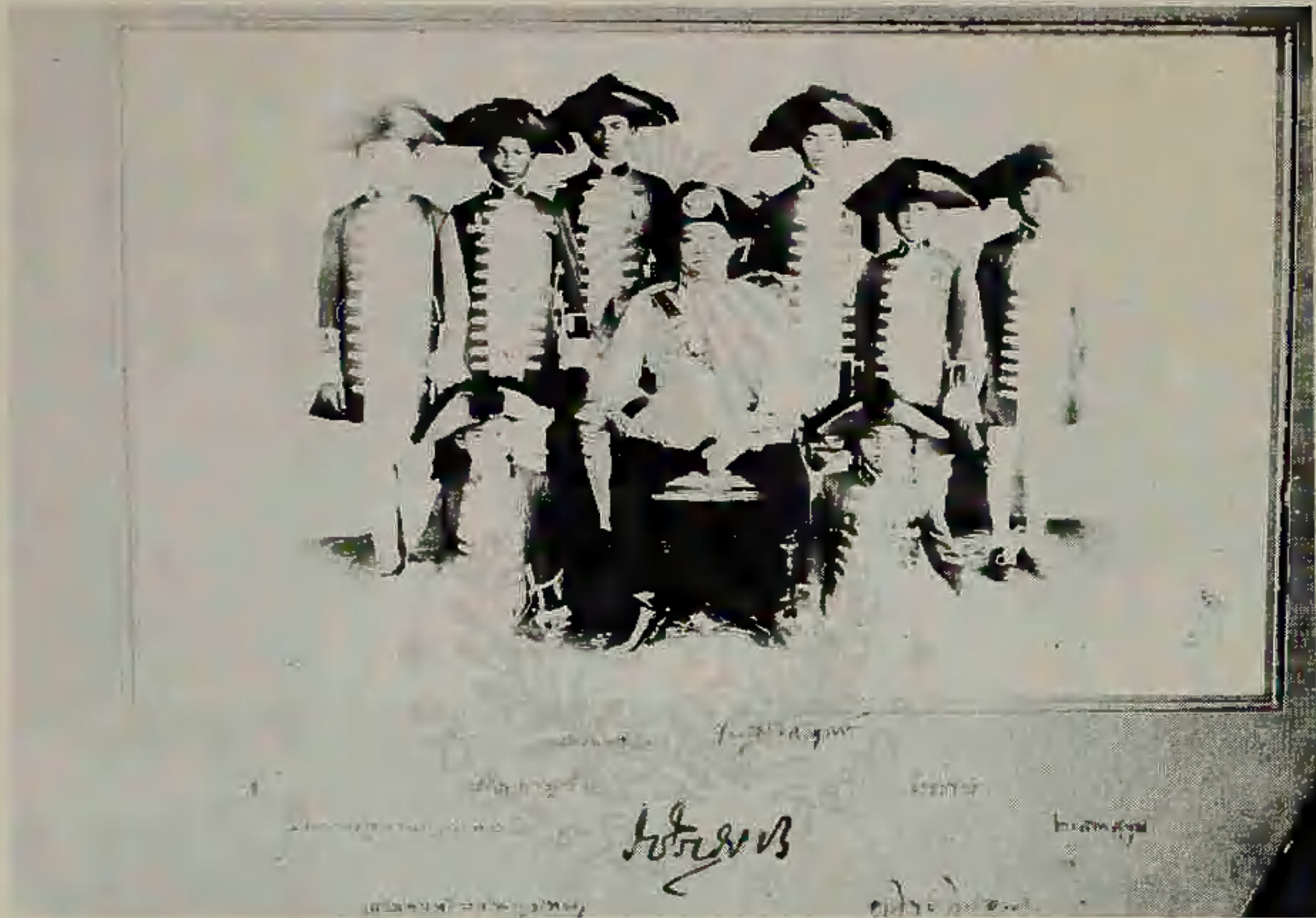
นักเรียนมหาดเล็กรับใช้รัชกาลที่ ๖ พ.ศ. ๒๔๕๘