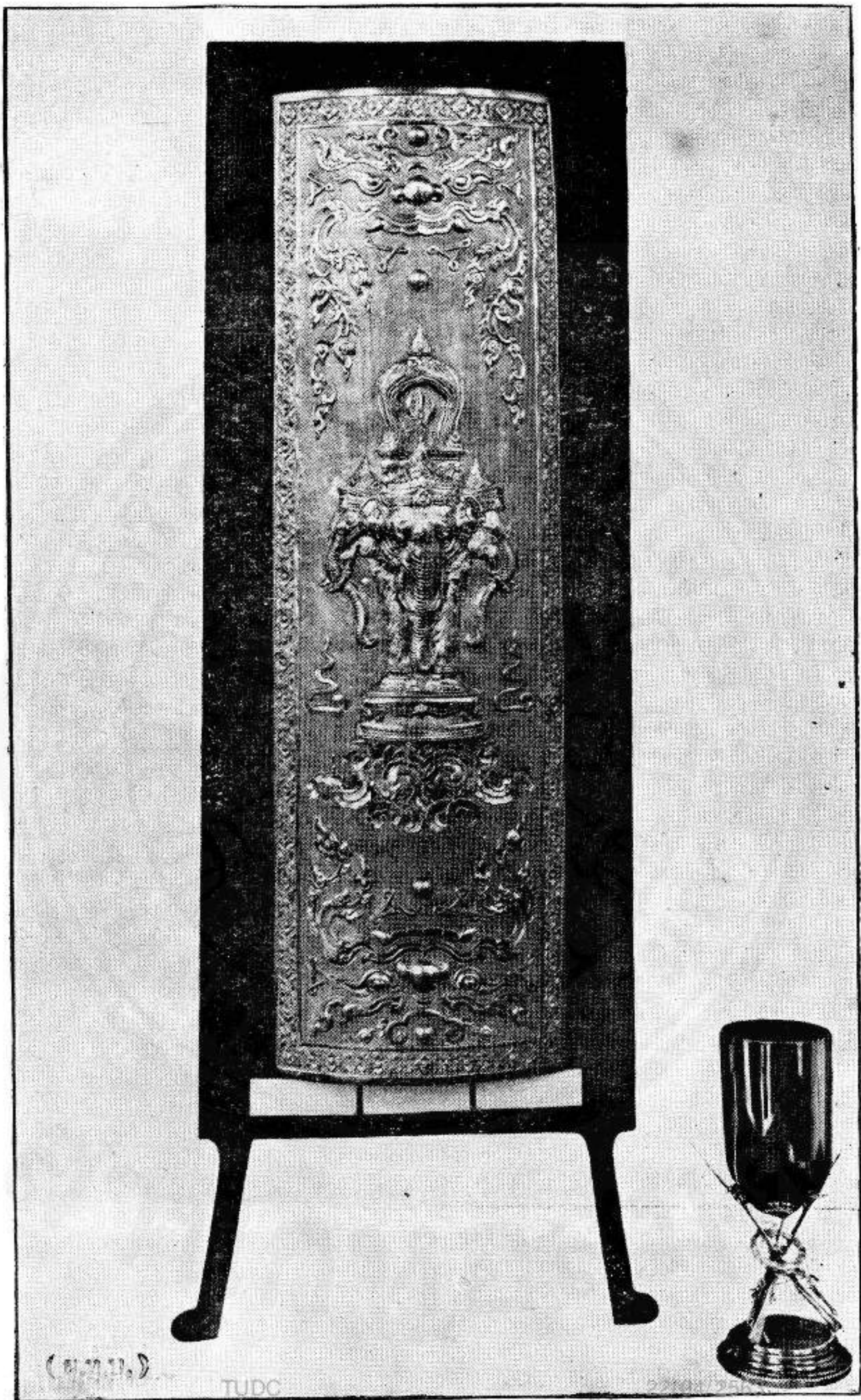
โลหะหลวง ช่างกรมทหารบกกราบที่ ๔ ได้รับพระราชทานรางวัลการแข่งขันยิงเป้า, ในพระพุทธศักราช ๒๔๖๔