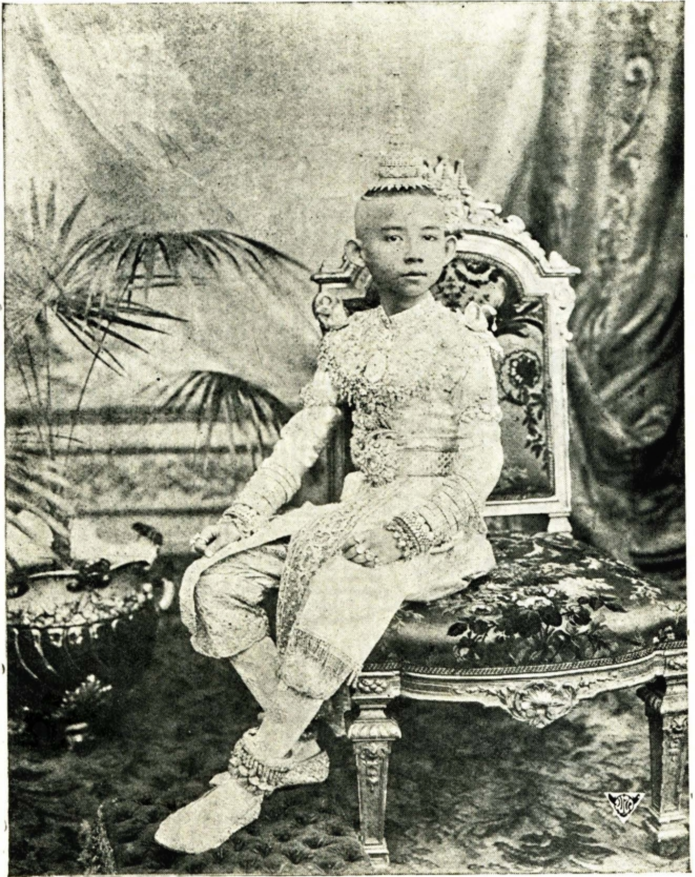
พระรูปสมเด็จพระเจ้าฟ้ามหิตลอดุลยเดช กรมขุนสงขลานครินทร์ ทรงเครื่องวันทรงฟังสวดโสกันต์ ถ่ายเมื่อปีเถาะ พ.ศ. ๒๔๔๖