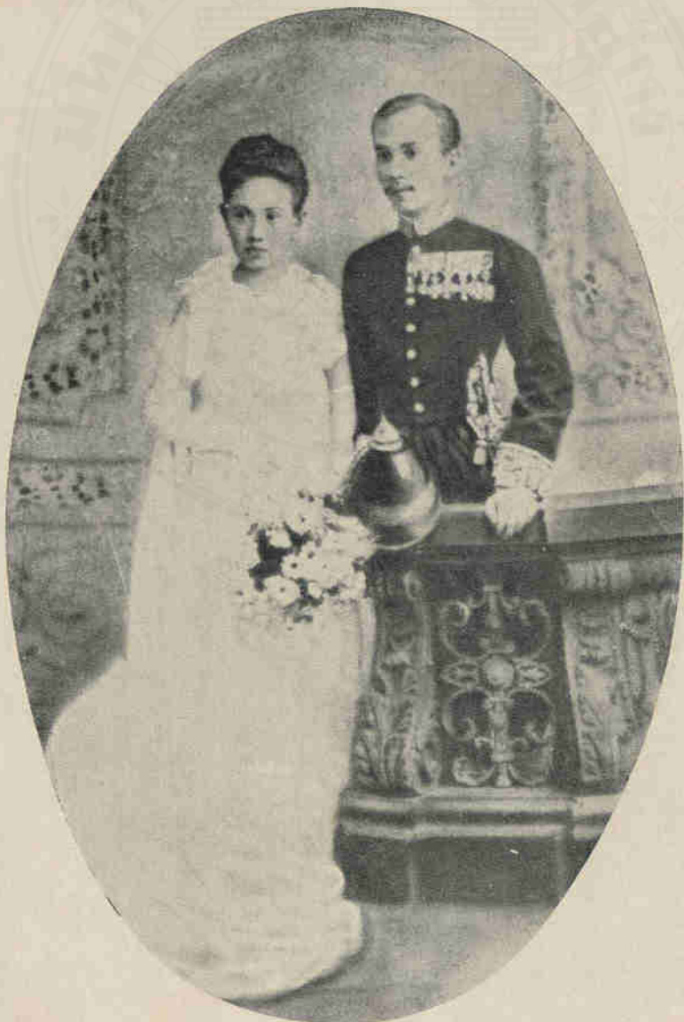
ถ่ายในเครื่องแบบเต็มยศเมื่อครั้งยังเป็นพระวิจิตรวรสาสน์อุปทิศยาม ณ กรุงลอนดอน พร้อมด้วยท่านผู้หญิง เมอเขาเผ่าควนวกตอเรีย (พ.ศ. ๒๔๓๖)