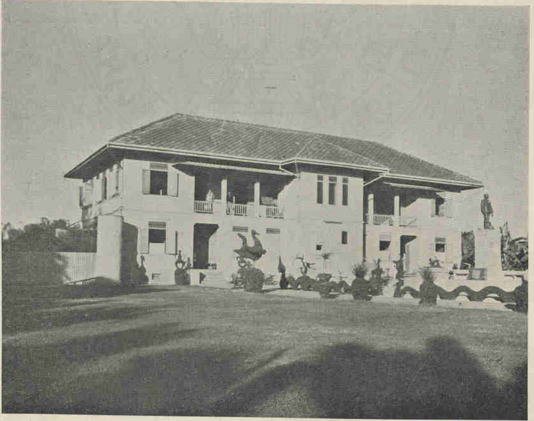
“โรงพยาบาลเจ้าพระยามรราช (บัน สุขุม)” ซึ่งท่านเจ้าพระยามรราช ได้สร้างขนทงหวัดสุพรรณบุรีและไดทาพชเบต เมอ พ.ศ. ๒๔๖๕