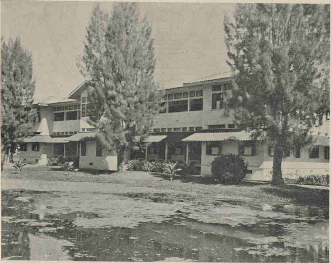
“โรงพยาบาลเจ้าพระยามรราช (บัน สุขุม)” ซึ่งท่านเจ้าพระยามรราช ได้สร้างขึ้นในบริเวณโรงพยาบาลจุฬาลงกรณ์และทำพิธีเปิดเมื่อ พ.ศ. ๒๔๖๕