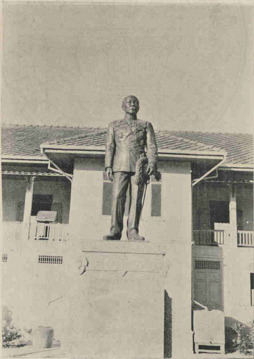
อนุสาวรีย์ มหาอำมาตย์นายก เจ้าพระยาบรมราช ณ โรงพยาบาลเจ้าพระยาบรมราช จ.ว. สุพรรณบุรี