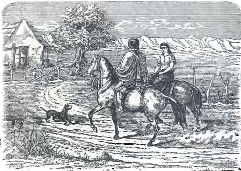
Vuelta de Martín Fierro

Aventaja á los demas El que estas cosas entienda — Es bueno que el hombre aprenda, Pues hay pocos domadores, Y muchos frangoyadores Que andan de bozal y rienda.