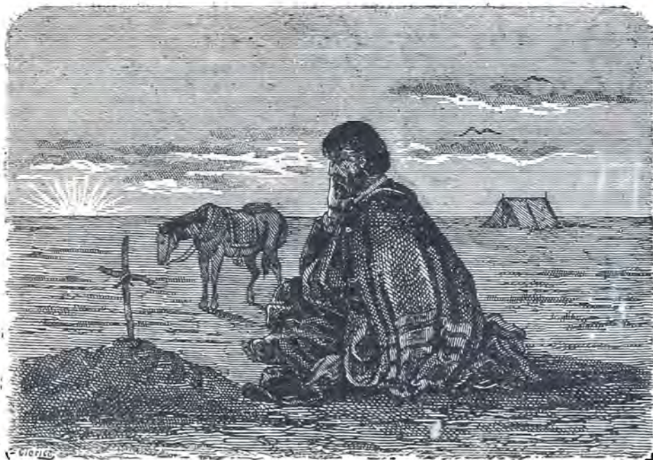
Martín Fierro meditando en la Tumba de su amigo Cruz

Cumplí con mi obligacion, No hay falta de que me acuse, Ni deber de que me escuse Aunque de dolor sucumba — Allá señala su tumba Una cruz que yo le puse.