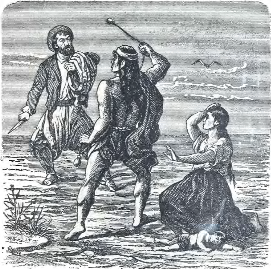
Pelea de Martin Fierro con un Indio

En cuanto trastrabilló Mas de firme lo cargué, Y aunque de nuevo hizo pié Lo perdió aquella pisada ; Pues en esa atropellada En dos partes lo corté.