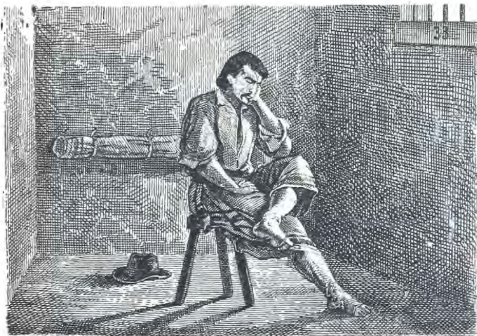
En la Penitenciaría

No es en grillos ni en cadenas En lo que usted penará, Sinó en una soledá Y un silencio tan profundo, Que parece que en el mundo Es el único que está.