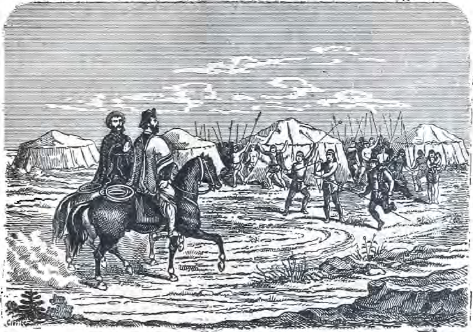
Llegada de Cruz y Fierro á las tolderías

En la orilla de un arroyo Solitario lo pasaba, En mil cosas cavilaba Y á una güelta repentina Se me hacia ver á mi china O escuchar que me llamaba.