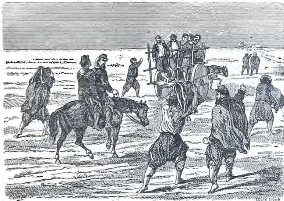
La vuelta del Contingente.

Se me va por donde quiera Esta lengua del demonio — Voy á darles testimonio De lo que vi en la frontera. — Yo sé que el único modo A fin de pasarlo bien, Es decir á todo amen Y jugarle risa á todo. —