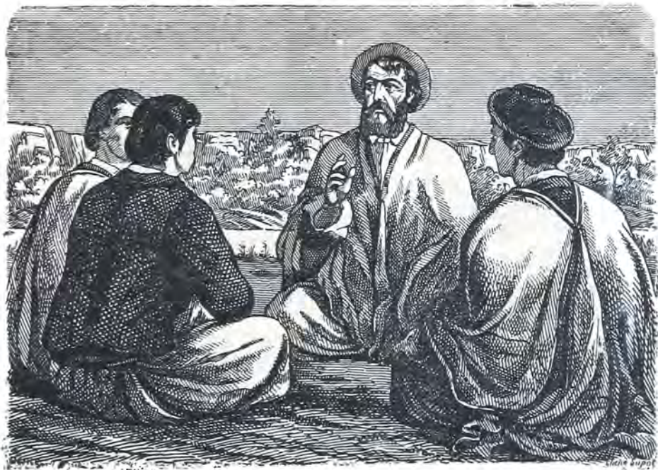
Martin Fierro dando consejos á sus hijos.

Bien lo pasa hasta entre Pampas El que respeta á la gente— El hombre ha de ser prudente Para librarse de enojos— Cauteloso entre los flojos Moderado entre valientes.