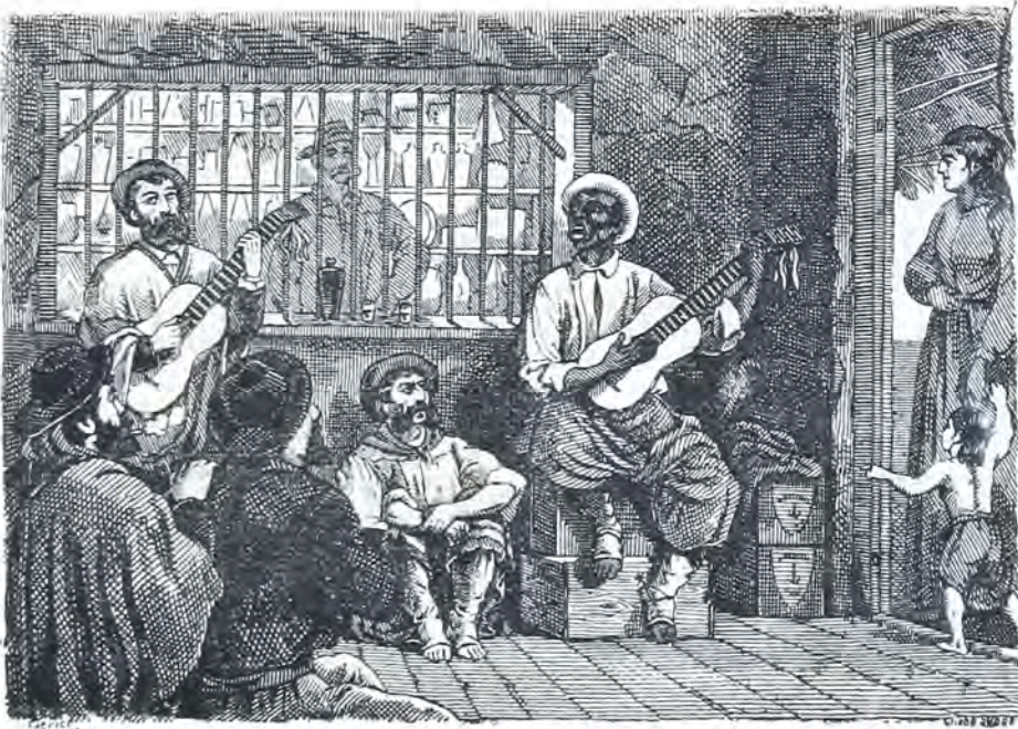
Canto por cifra, de contrapunto entre Martin Fierro y un negro.

Es pobre mi pensamiento, Es escasa mi razon— Mas pa dar contestacion Mi inorancia no me arredra— Tambien dá chispas la piedra Si la golpea el eslabon.