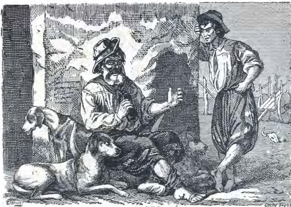
El viejo Viscacha dando sus consejos.

« Las armas son necesarias Pero naides sabe cuando; Ansina si andás pasiando, Y de noche sobre todo, Debés llevarlo de modo Que al salir, salga cortando. »