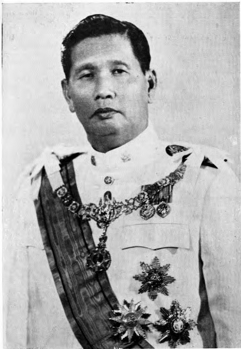
จอมพล สฤษดิ์ ธนะรัชต์ นายกรัฐมนตรี