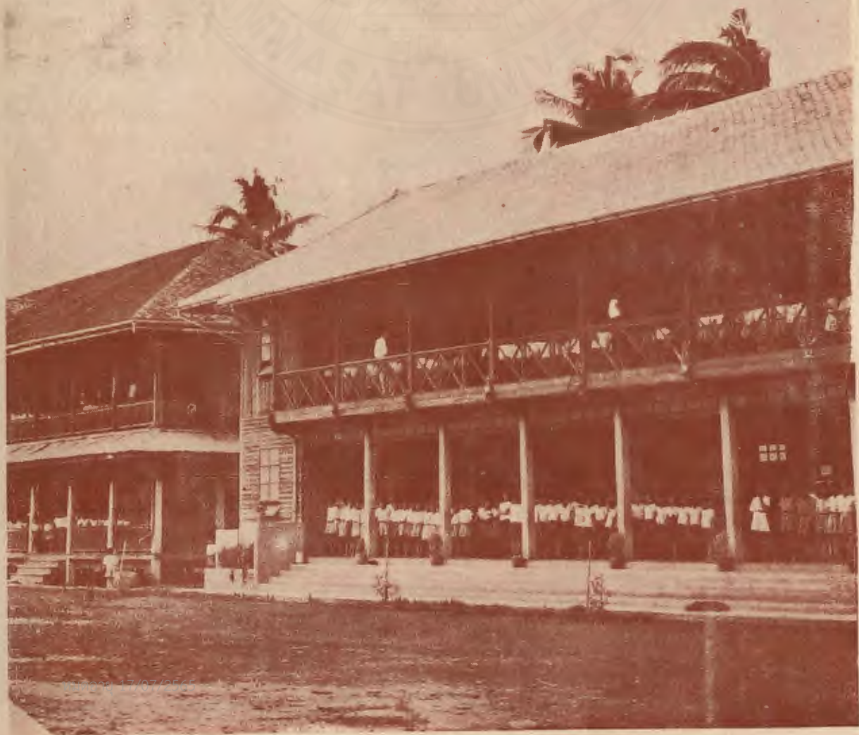
โรงเรียนที่ต๋องปลุกอาคารเพิ่มเติมใหม่ เพราะอาคารเดิมรับนักเรียนเต็มที่แล้ว