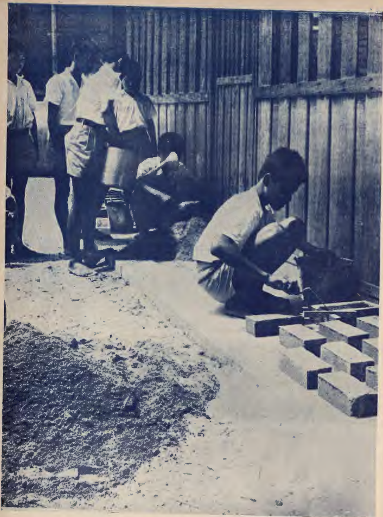
การเรียนทำอิฐซีเมนต์ ซึ่งเป็นการฝึกอาชีพให้นักเรียนไปในตัว