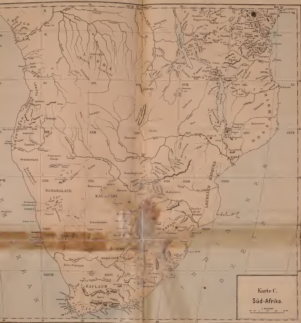
Karte C. Süd-Afrika.