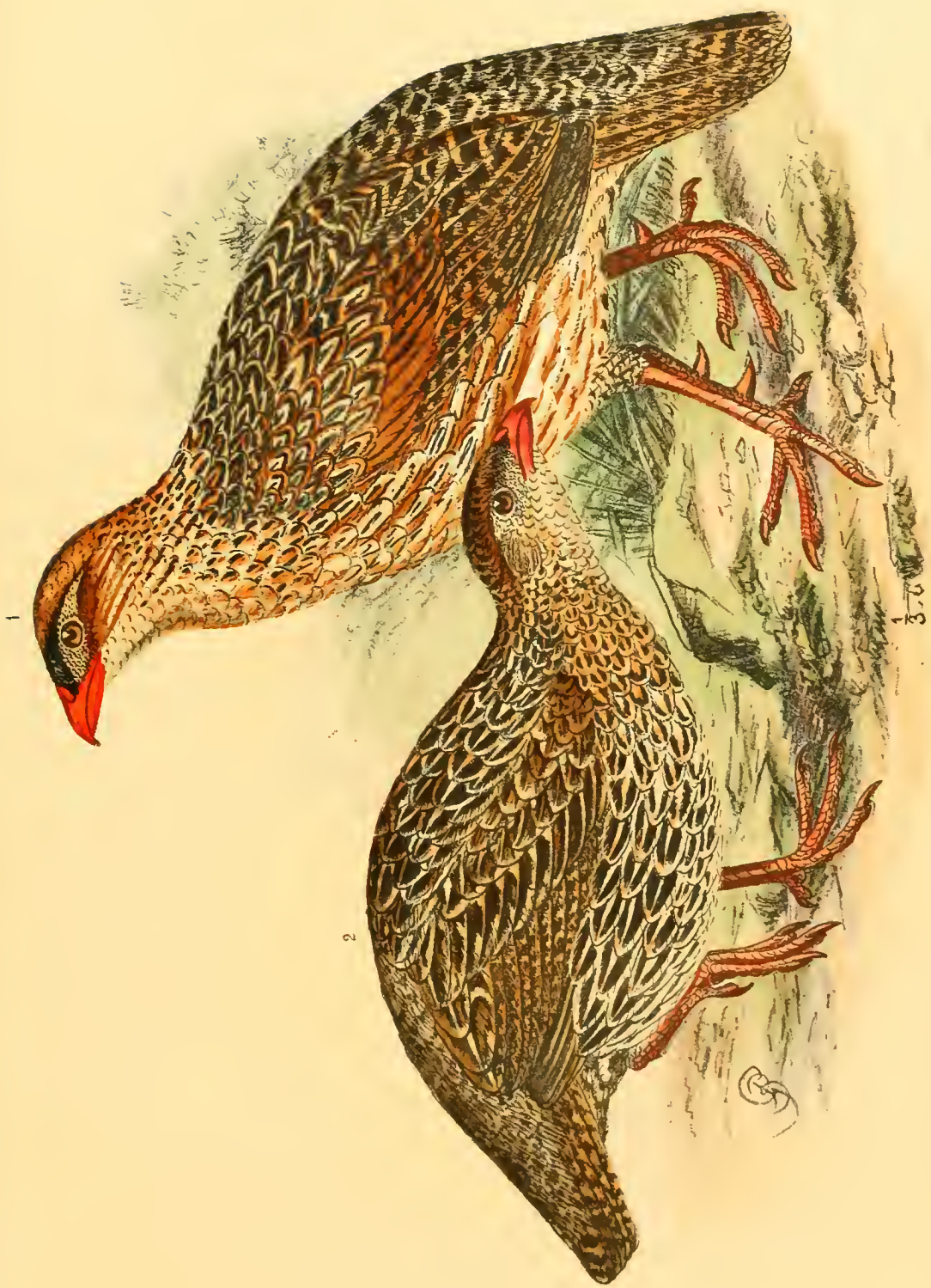
Francolinus bottegi Salvad. Fig. 1 ♂, 2 ♀ juv.