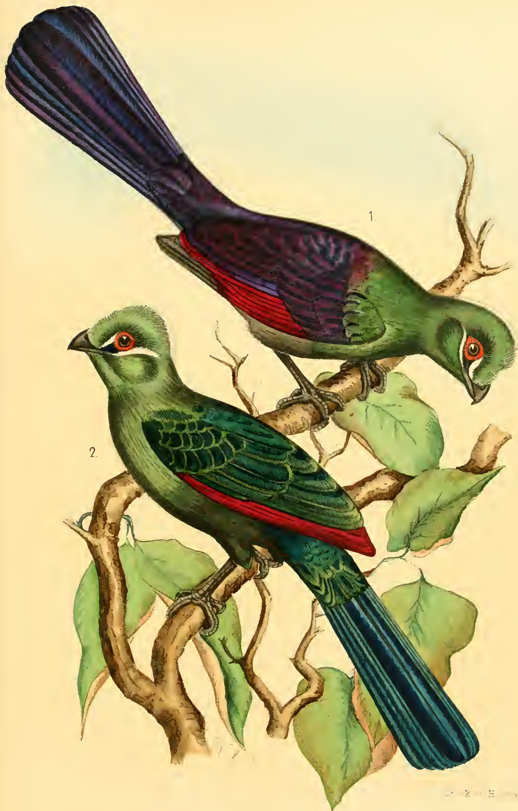
1 Turacus schützi (Cab)