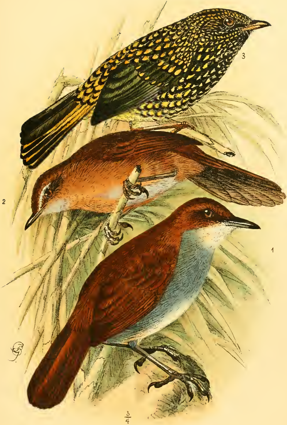
1 Alethe poliothorax Rchw. 2 Bradypterus castaneus Rchw. 3 Tarsiger guttifer Rchw. Neum.