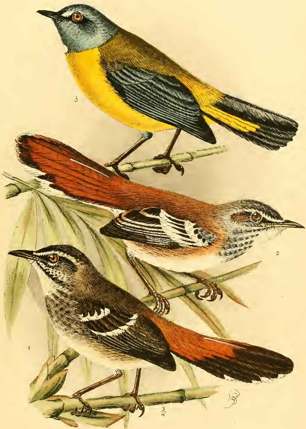
1 Erythropgia hartlaubi Rchw. 2 Erythropgia vulpina Rchw. 3 Tarsiger orientalis Fsch. Rchw.