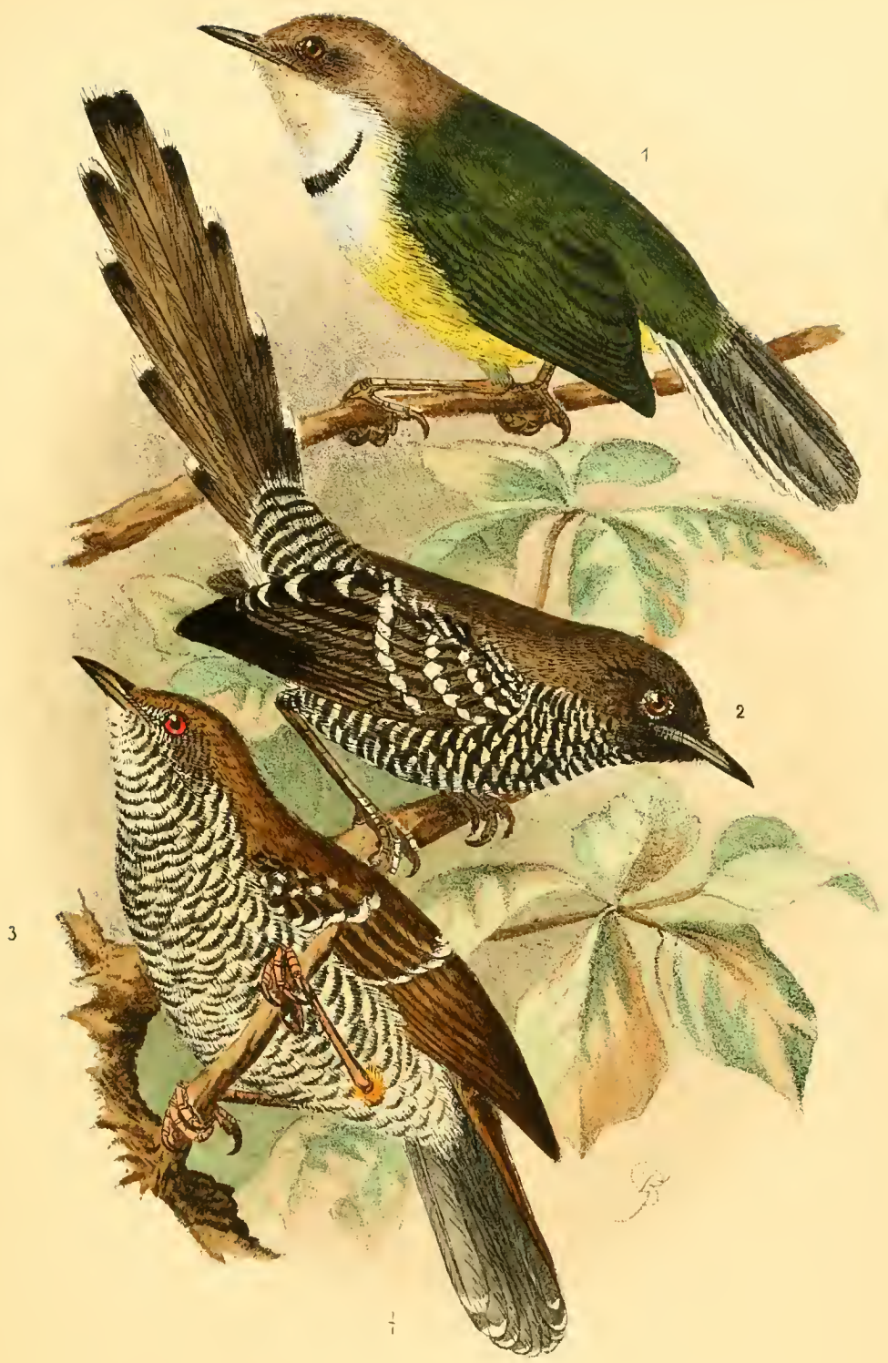
1 Apalis griseiceps Rchw. Neum. 2 Prinia melanops (Rchw. Neum.). 3 Calamonastes stierlingi Rchw.