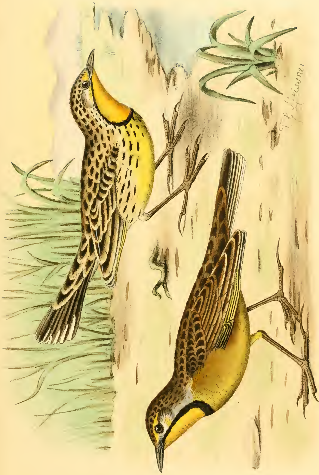
Macronyx fülleborni Rehw