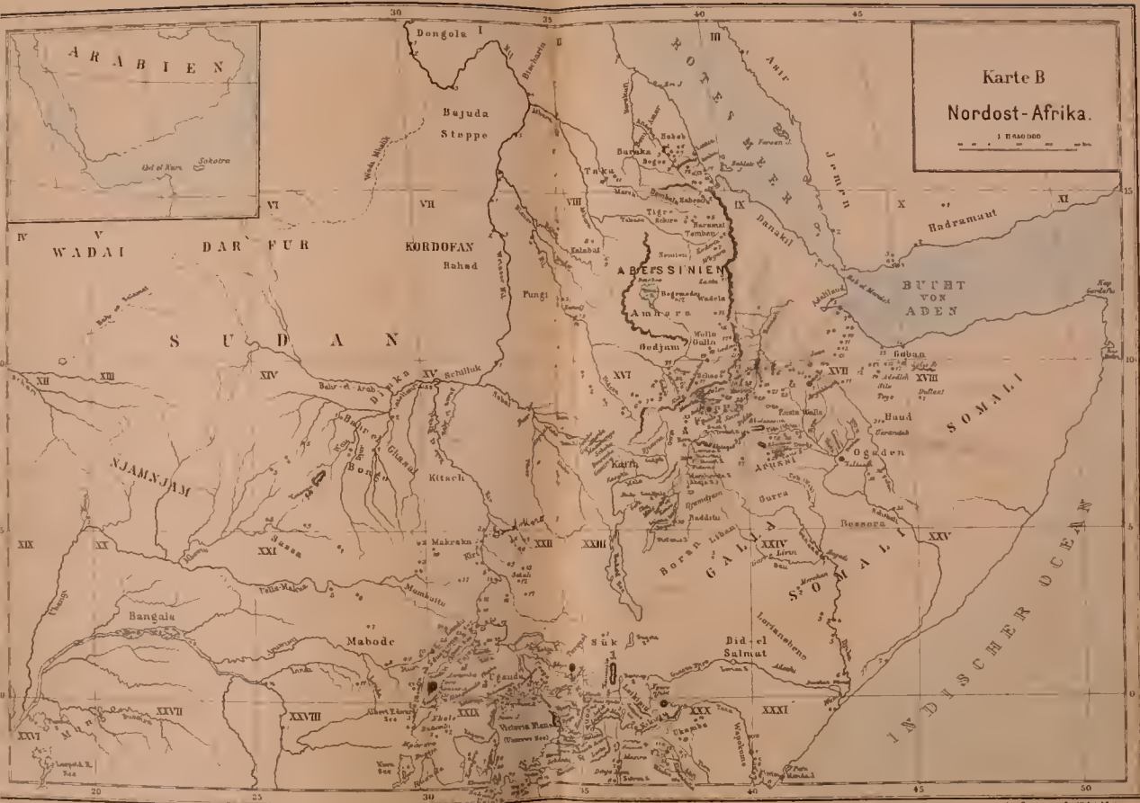
Karte B Nordost-Afrika. 1 : 11 000 000