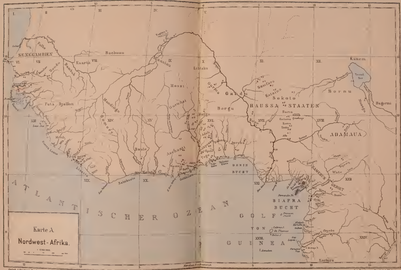
Karte A Nordwest-Afrika.