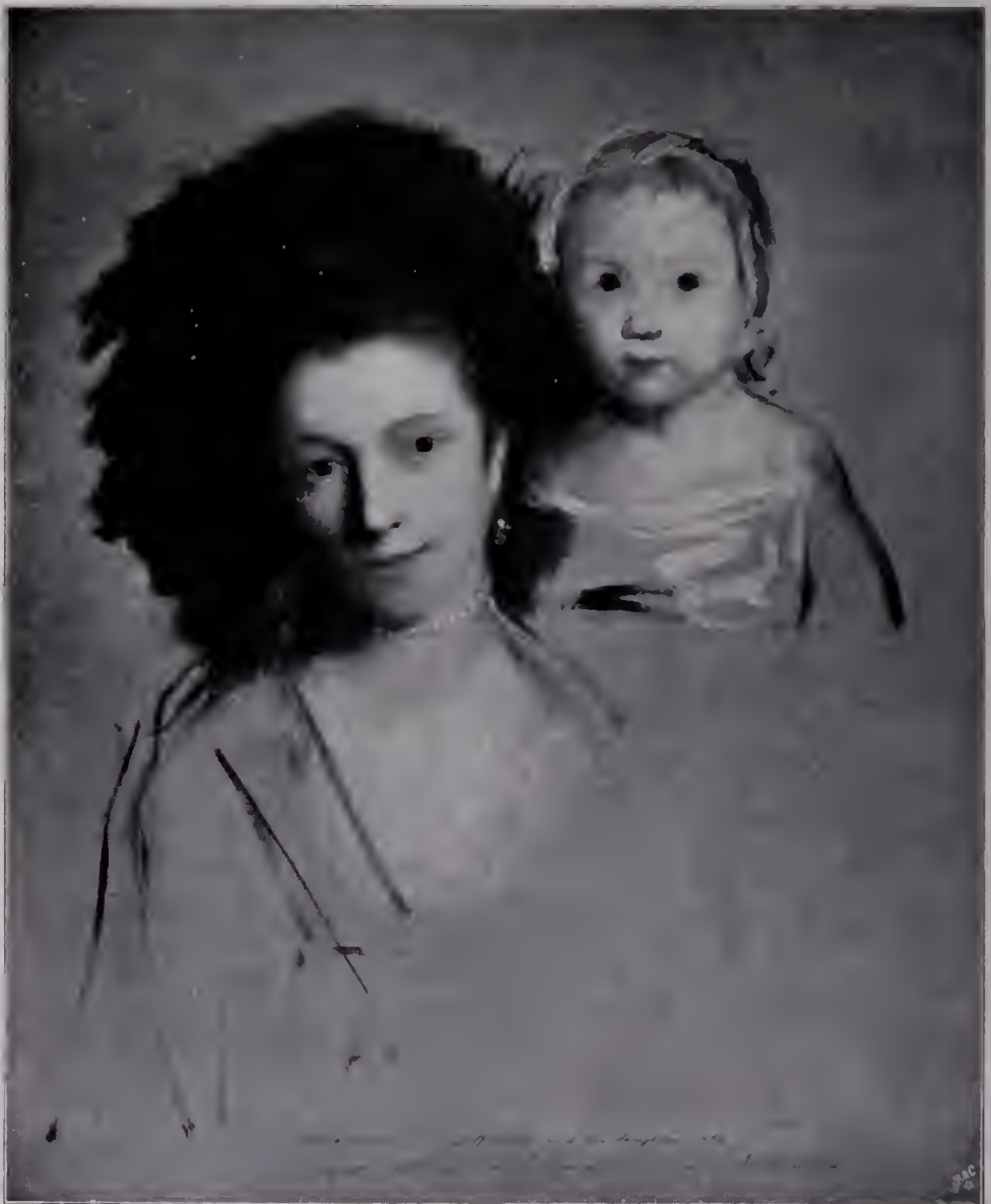
Abb. 15. Georgina Countess Spencer nebst Tochter. 1769. Herzog von Devonshire. (Zu Seite 109 u. 116.)

streitet Gainsborough um den Vorrang, der herrlichste Maler der Kleinen und Heranwachsenden, der Generation der Zukunft zu sein. Alle Zauber seiner Farbenkunst entfaltet Reynolds, wenn er die vornehmen Damen des reichen London und ihre Nachkommenschaft verewigt. Die Ladies und Herzoginnen, die mit ihren Kindern spielen und tollen, erscheinen in seligem Mutterglück, und auch die andern Genossen des Hausstandes, die kleinen Luxushunde dürfen nicht fehlen — denn auch die Tierliebhaberei und vor allem die Zärtlichkeit für die Hunde bedeuten ein Stück England. Die Schönen der Aristokratie tragen, unarmen und lieblosen ihre Babies, sie heben sie hoch, drücken sie an sich und betrachten sie mit lächelndem Blick. Nun ist die Gruppe lebhaft bewegt, in kühn geschwungenen, breiten Pinselstrichen souverän hingezeichnet und doch dabei fein und glücklich abgewogen. Nun wieder ist alles ruhig und still gehalten, als friedvolles Idyll. Oder die Kinder erscheinen allein, und alle Zartheit und aller Schmelz der delikatesten Töne müssen helfen, ihre unschuldige Schönheit wiederzugeben. Reynolds kann von diesen Motiven des englischen Lebens auch dann nicht los, wenn er sich selbst