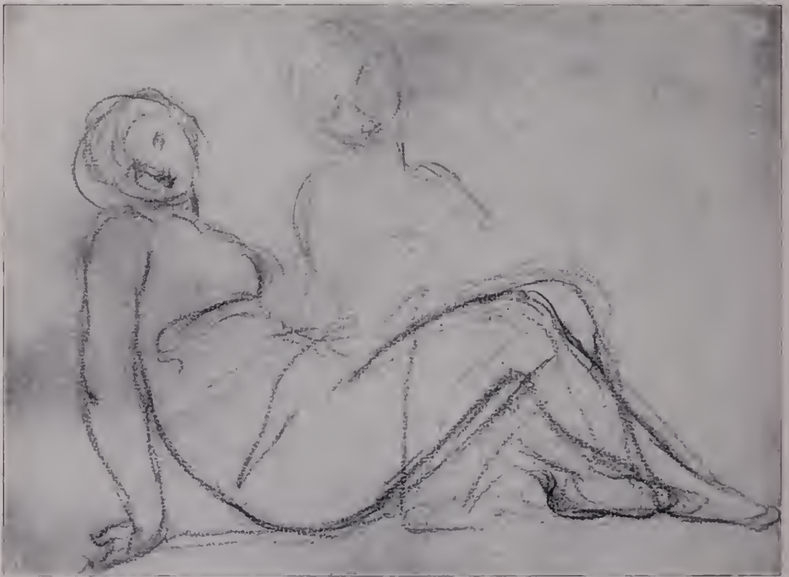
Abb. 102. Skizze in Bleistift. Zum Gemälde „Nymphe und störender Knabe“ Abb. 91 British Museum. (Zu Seite 123; vgl. Abb. 91.)