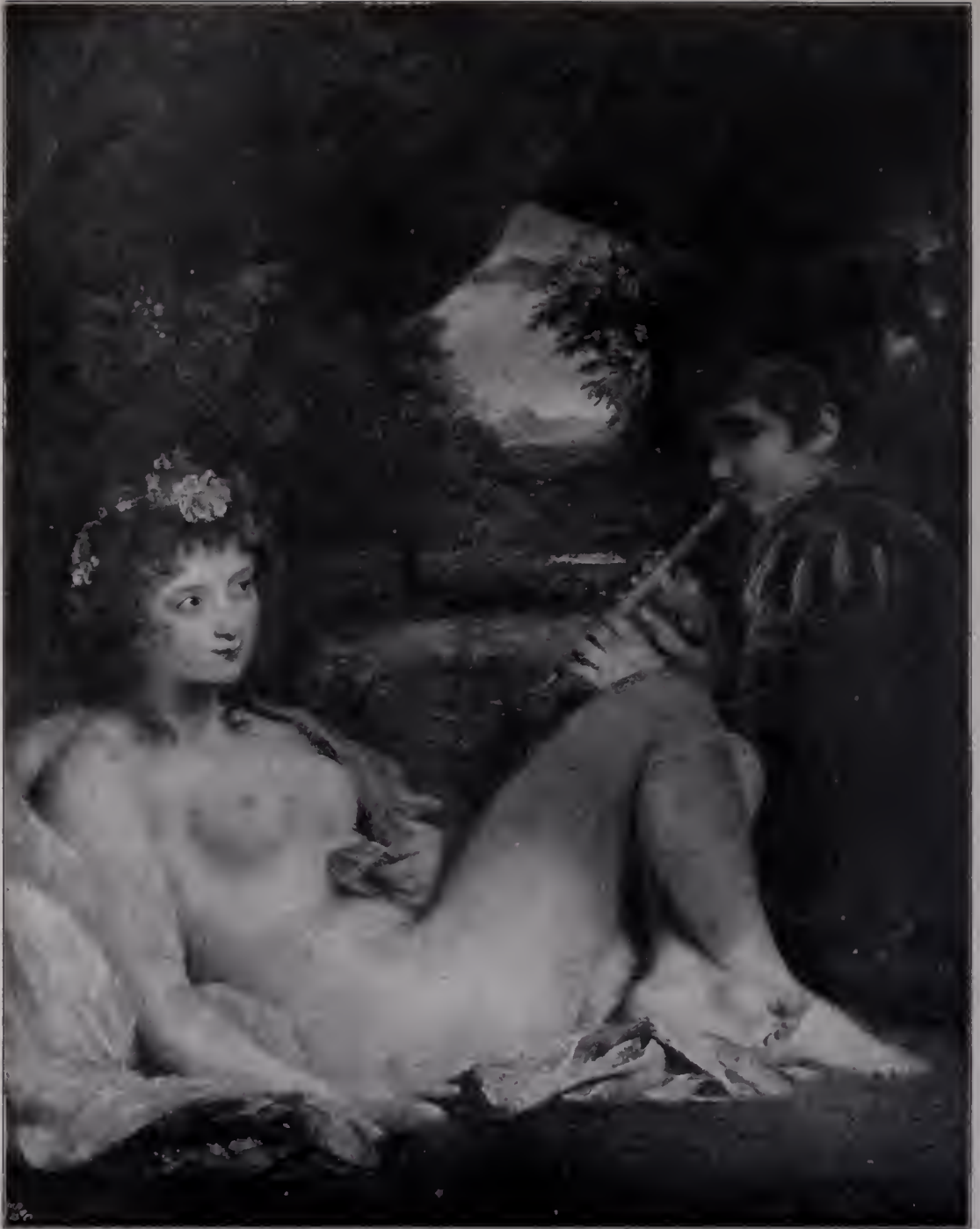
Abb. 91. Nymphe oder Venus und flötender Anabe. Sir Eustace Chilton. (Zu Seite 108 u. 121.)

Doch gleich wird, beinahe ängstlich, angefügt: „Das ist aber, weil nur durch den Erfolg eines einzelnen belegt, ein nicht sichergestelltster Einspruch; und ich hoffe, man wird nicht meinen, daß ich es empfehle, diesen Weg einzuschlagen.“ Wenn man genau hinhört, hört man den leisen Vorwurf mitklingen, der in das Eloge des Heimgegangenen hineintönt. Dies Doppelmotiv ist, mit nicht geringer rhetorischer, fast möchte man sagen: diplomatischer Meisterschaft variiert, als Unter- und Nebenmelodie in der ganzen Rede zu finden. „Wenn Gainsborough die Natur nicht mit dem Auge eines Dichters sah, so sah er sie doch mit dem Auge eines Malers“ — eine köstliche „Entschuldigung“ des Ver-