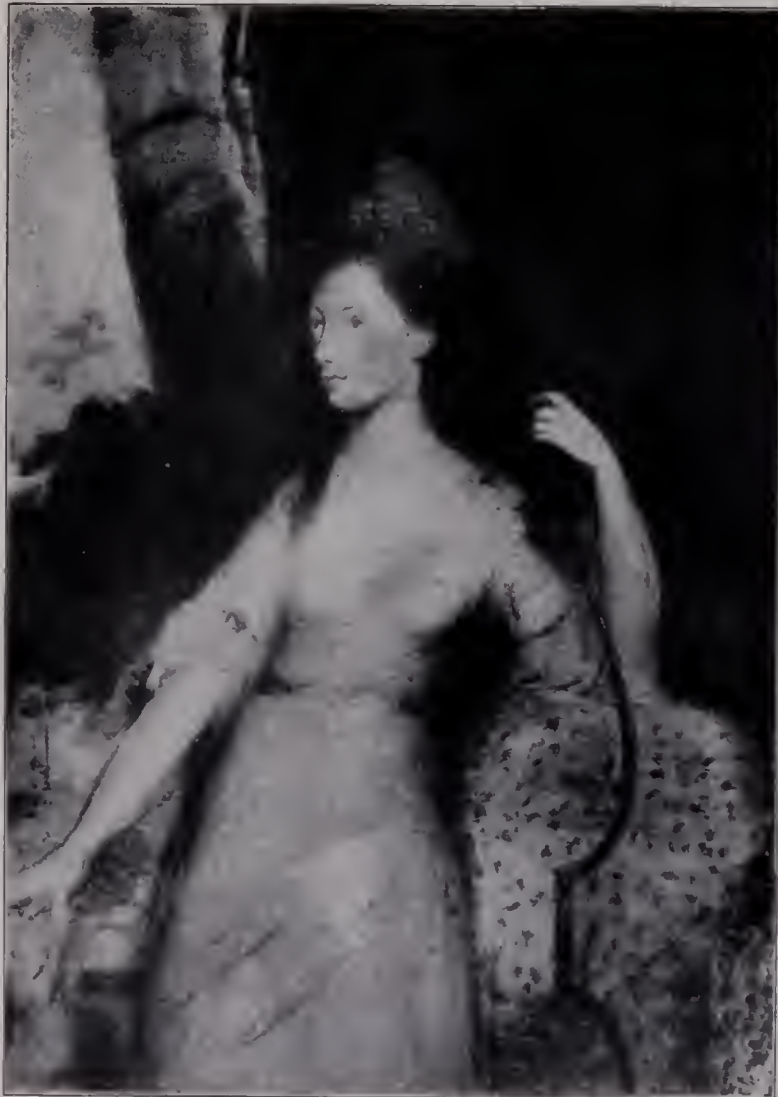
Abb. 93. Skizze zum Porträt der Lady Holding. Pastell und Aquarell. South Kensington-Museum. (Zu Seite 124.)

so hervorragende Schönheit seiner Bilder ist, während viel Glätte und Vermalung der Farben dazu angetan ist, Schwere hervorzu bringen. Jeder Künstler muß bemerkt haben, wie oft jene Leichtigkeit der Hand, die in seiner Untermalung oder ersten Anlage zu sehen war, beim Ausführen verschwand, wenn er die Teile mit größerer Genauigkeit ausfertigte; und noch einen anderen Verlust, der von mehr Bedeutung ist, erfährt er oft: während er sich mit den Einzelheiten beschäftigt, wird die Wirkung des Ganzen entweder vergessen oder vernachlässigt. . . Gainsboroughs Porträts waren in bezug auf Ausführung oft nicht viel mehr als was gewöhnlich zur Untermalung gehört: aber da er immer den allgemeinen Eindruck oder das Ganze zusammen beachtete, habe ich mir oft vorgestellt, daß diese Unfertigkeit sogar zu der überraschenden Ähnlichkeit beitrüge, welche seine Porträts so bemerkenswert macht. Obwohl diese Ansicht phantastisch erscheinen mag, glaube ich doch einen wahrscheinlichen Grund dafür angeben zu können, warum diese Malweise eine solche Wirkung haben könnte. Es wird vorausgesetzt, daß der allgemeine Eindruck, der in dieser unbestimmten Behandlungsweise liegt, genügt, um den Beschauer an das Original zu erinnern; die Einbildungskraft ergänzt das übrige und für sich vielleicht befriedigender, wenn nicht gar genauer, als der Künstler es mit aller Sorgfalt nach Möglichkeit hätte tun können.“