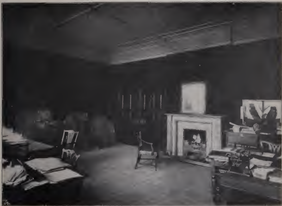
Abb. 115. Raum im Hause Leicester Square Nr. 47, ehemals Reynolds' Atelier. (Zu Seite 51.)

Alles muß von der Naturbeobachtung und Wirklichkeit fortführen. Das geht bis zu der Frage der Gewandung. Reynolds zweifelt nicht, „daß, wer dem Künstler nicht