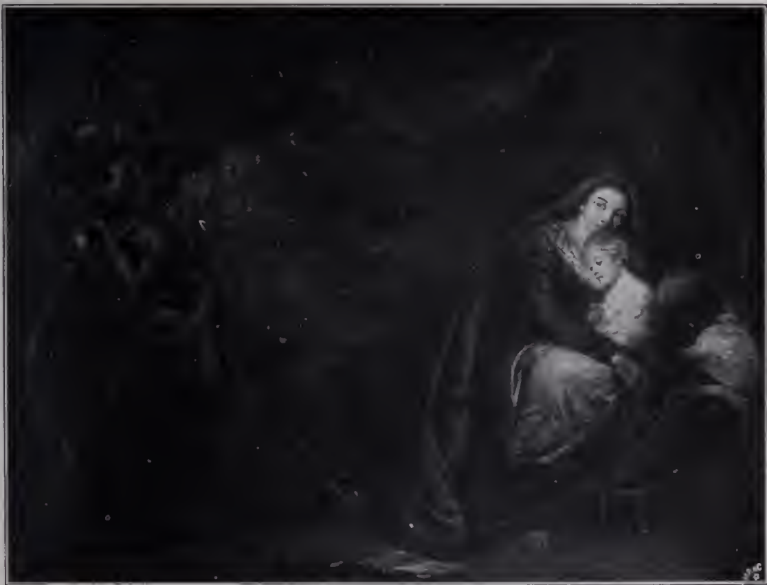
Abb. 92. Mutter und Kind. Dulwich Gallery. (Zu Seite 122.)

„Sicher ist es,“ sagte Reynolds, „daß all jene seltsamen Flecke und Striche, welche man bei genauerer Prüfung in Gainsboroughs Bildern bemerkt, und welche selbst geübten Malern eher ein Werk des Zufalls als der Absicht zu sein scheinen, daß dieses Chaos, diese grobe, formlose Masse von gewisser Entfernung betrachtet wie durch Zauber Form annimmt, und daß alle Teile an ihren richtigen Platz rücken, so daß wir, trotz dieses Scheines von Zufall und flüchtiger Nachlässigkeit nicht umhin können der vollen Wirkung des Fleißes Anerkennung zu zollen. Daß Gainsborough selbst diese Eigenart, und ihr Vermögen Überraschung zu erregen, als eine Schönheit seiner Werke betrachtet hat, kann, glaube ich, aus dem eifrigen Wunsche geschlossen werden, den er, wie wir wissen, immer aussprach: daß nämlich seine Bilder bei der Ausstellung sowohl in der Nähe als auch in der Entfernung zu sehen sein sollten. Die Flüchtigkeit, welche wir an seinen besten Arbeiten bemerken, darf nicht immer als Nachlässigkeit gelten. Wie sie oberflächlichen Beobachtern auch erscheinen möge, Maler wissen sehr wohl, daß stetige Aufmerksamkeit auf die allgemeine Wirkung mehr Zeit in Anspruch nimmt, und dem Geist mehr Arbeit kostet, als jede Art feinen Ausarbeitens und Glättens ohne diese Aufmerksamkeit . . . Es muß anerkannt werden, daß diese Manier Gainsboroughs, die Farben unvermittelt nebeneinander zu setzen, sehr viel zu der wirkungsvollen Leichtigkeit beiträgt, welche eine