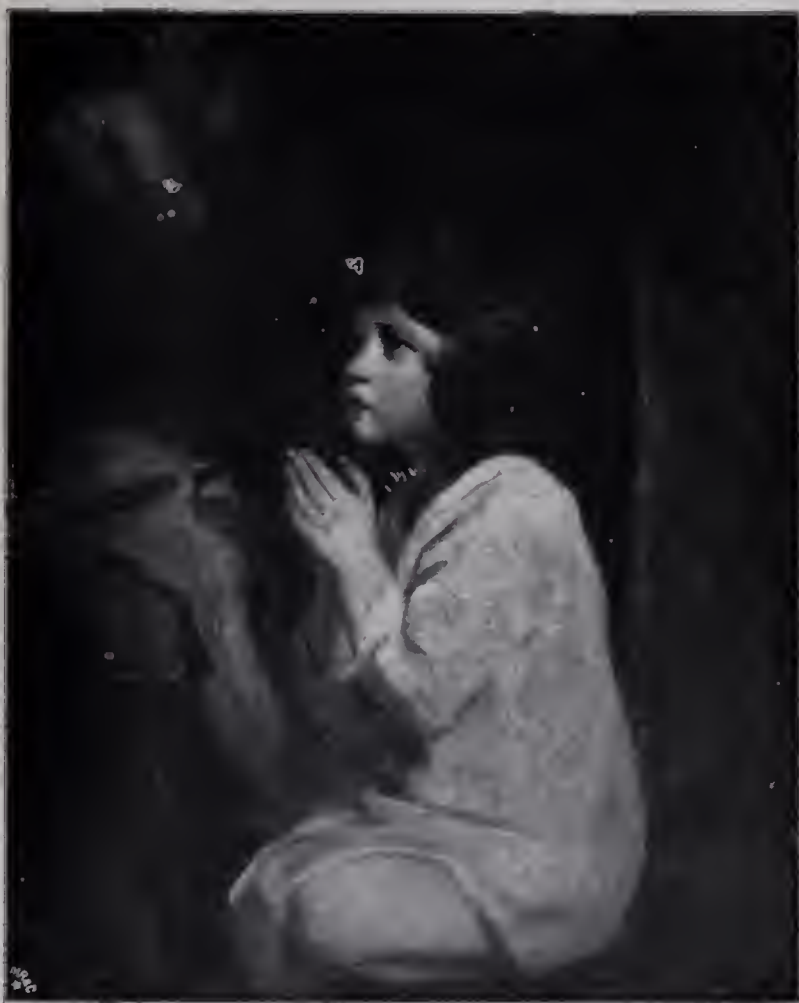
Abb. 76. Der kleine Samuel im Gebet. London, Nationalgalerie. (Zu Seite 108 u. 123.)

In jenem Jahre 1769 erscheint der Präsident mit einer