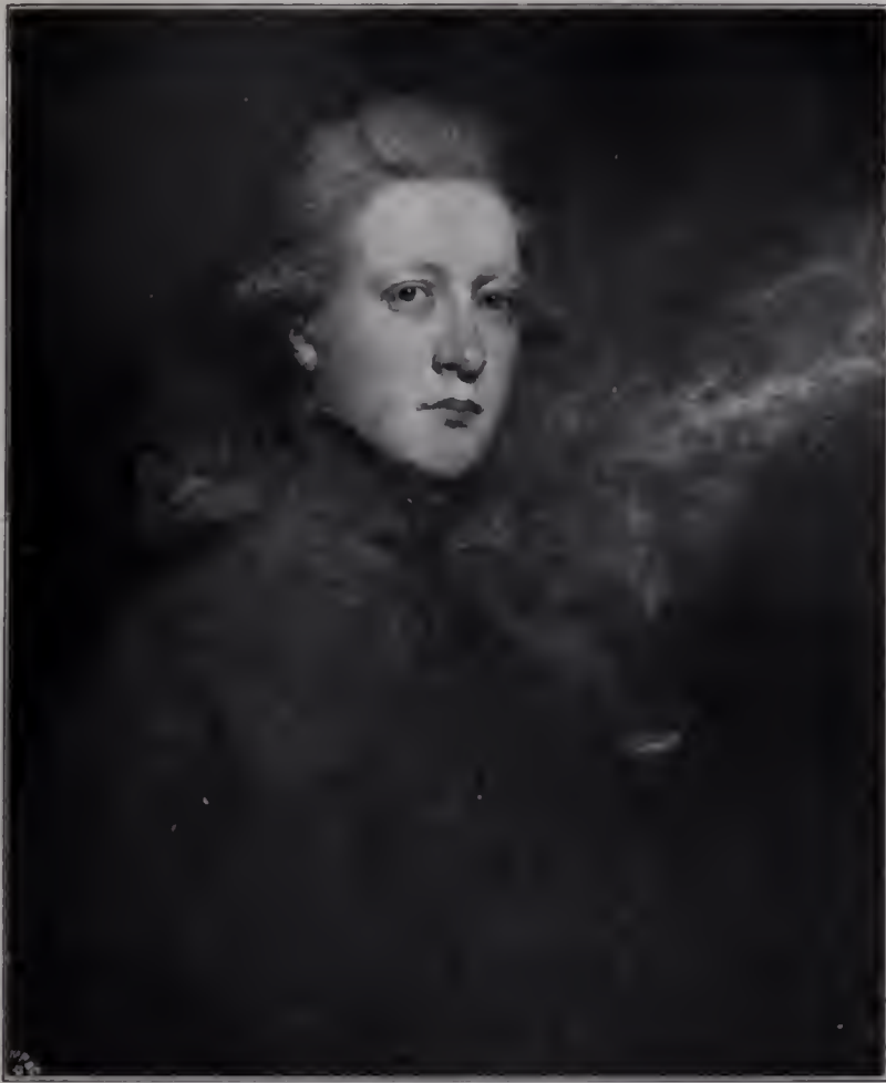
Abb 20. William Dule of Devonshire. 1767. Earl Spencer. (Zu Seite 116.)

Nachwelt als die herrlichsten und wertvollsten erschienen. Das ist gewiß möglich und entspricht nur der natürlichen menschlichen Neigung, mit zärtlicherer Liebe den unerreichbaren als den erreichbaren Zielen zuzustreben. Die nachprüfende Kritik aber hat in jenen Werken gerade die Elemente aufgespürt, die sie innerlich mit den anderen, von ihrem Schöpfer weniger respektvoll behandelten, verbinden, und ist zu dem Ergebnis gekommen, daß sie eben diesen Elementen ihre Bedeutung verdanken, nicht nur vornehmlich, sondern ganz und gar. Diese Werke sind, mehr noch als die übrigen, Beweise für die seltsamen Kontraste, die das Wesen Reynolds' ausmachen.