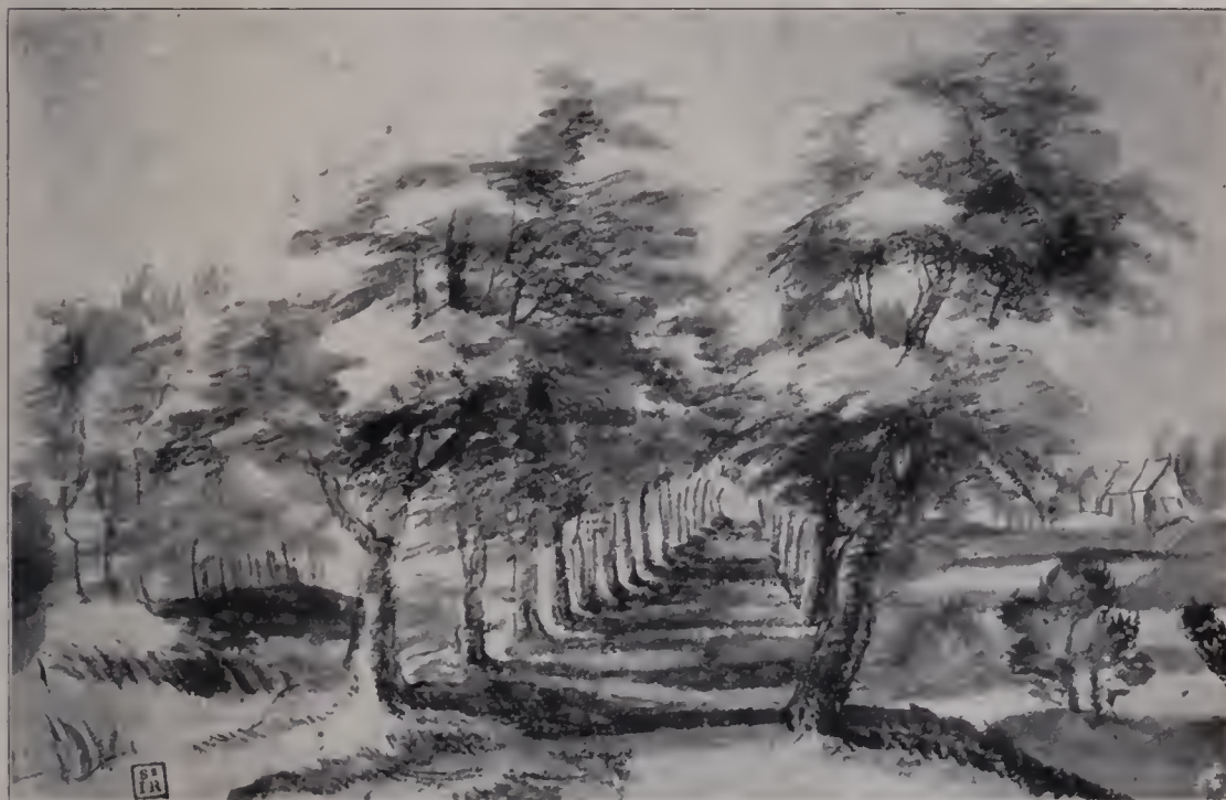
Abb. 108. Landschaft. Tuschezeichnung. British Museum. (Zu Seite 125.)

lebendigen Brüdern, die unsere Sprache nicht sprechen können, aber verstehen. Die kleineren und größeren Hunde, die an Sir Joshuas Frauen empor springen, ihre Herrin erwartungsvoll ansehen, als wenn sie einen Befehl oder ein Kosewort erhofften, sich an sie anschmiegend oder ihnen auf den Schoß hüpfend (Abb. 62), haben nicht die unmittelbare Natürlichkeit, die Gainsborough auch diesen Tieren zu geben wußte. Sie sind mehr bewußt als Farneflecke oder auch als Kompositionsteile verwendet, etwa um die Basis des pyramidalen Zeichnungsaufbaues zu komplettieren, oder um eine Linie zu durchbrechen, eine Gerade wellig aufzulösen. Und ähnlich wie mit diesen Hunden, mit den Tauben (Abb. 59—60) und dem andern Getier, das auf Reynolds' und Gainsboroughs Bildern auftritt, steht es schließlich mit den Kindern (Abb. 81—83). Auch hier ist Gainsborough, selbst ein Naturkind, von vornherein dem großen Konkurrenten ein bedeutendes Stück voraus. Bei ihm sind die Kleinen lebendige Blumen, süße Elfen, frohe Naturgeisterchen, welche die Blüten des Gartens, die Bäume des Parks und die Hunde des Hauses als Geschwister ansprechen. Reynolds,