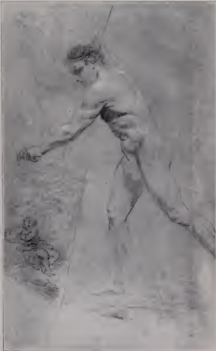
Abb. 105. Skizze. British Museum. (Zu Seite 124.)

Auch da versagt Reynolds oft im Entwurf der Komposition, wo er seine glücklichen Mütter darstellt, die von ihren Kindern umtollt, umsprungen, umklettert werden. Er ist hier oft zu Überschneidungen gelangt, die eine einheitliche Wirkung schlecht hin zerstören. Dazu hat er sich vielfach den Kontrast