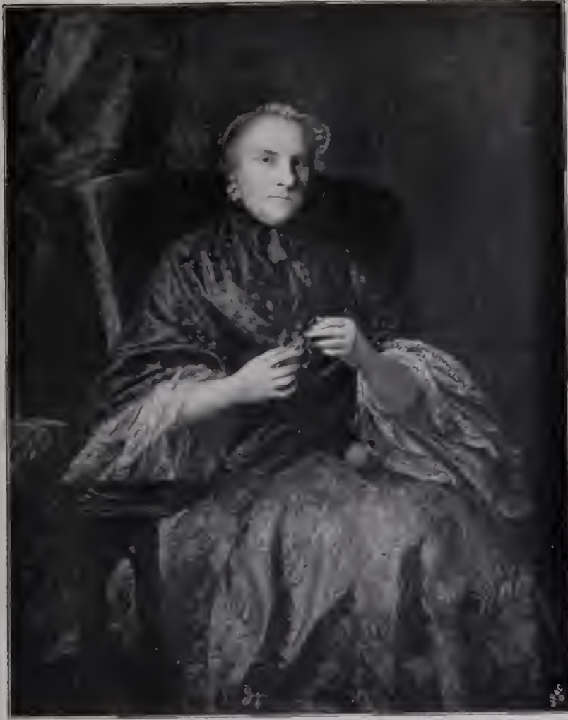
Abb. 15. Countess of Albemarle. London, Nationalgalerie. (In Seite 117.)

bis in die letzten Geheimnisse des Schaffens der alten Meister einzudringen, ist dem unverbesserlichen Akademiker freilich später bange geworden; wir werden sehen, wie er in seinen Diskursen gegen seine schrankenlose Bewunderung aus der Zeit des venezianischen Aufenthalts Vorbehalte macht und wieder den Rückweg aufzufinden sucht, der ihn von der voraussetzungslosen Ergründung des Malerischen in den gebenedeiten Bezirk des großen Stils führen könnte. Fürs erste aber bleibt der Eindruck der Venezianer ungeschmälert, und für alle Zukunft verdankt ihm Reynolds die wertvollste Befruchtung, die seinem Talent von außen her zuteil wurde.