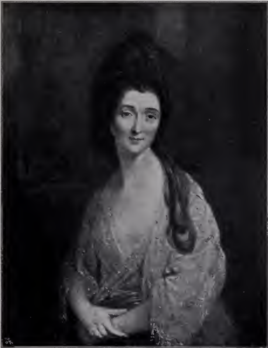
Abb. 40. Bildnis einer unbekanntten Dame. (Zu Seite 117.)

zu seinem Lebensende eine Neigung zur Satire und ein gutes Verständnis für das unfreiwillig Komische nachgesagt wird. In der frühesten Jugend allerdings scheint Reynolds, noch in Plympton, mancherlei karikaturistische Versuche verübt zu haben: es wird sogar erzählt, daß ihm der Spitzname „der Clown“ beigelegt wurde. Nun löst das freie Leben in der italienischen Hauptstadt in ihm einen inneren Jubel, der irgendwie zum Ausdruck gelangen muß. Es ist eigentümlich zu beobachten, wie diese Erscheinung bei Temperamenten aller Schattierungen wiederkehrt. Erst kürzlich ward aus der römischen Zeit