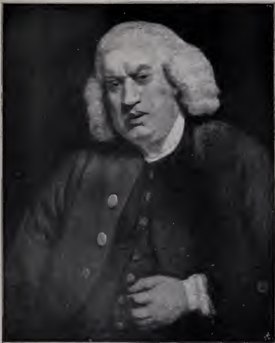
Abb. 11. Dr. Samuel Johnson. 1772. London, Nationalgalerie. (Zu Seite 16, 60 u. 68.)

Die alten Meister — ihnen hat sich Sir Joshua mit seinem Herzblut verschrieben, überzeugt, daß es ein heiliges und notwendiges Opfer sei, was er also verrichte. Auf dem Selbstbildnis der Royal Academy, in dem er sich im roten Talar, mit dem Barett auf dem Kopf, dargestellt hat (Abb. 1), steht auf dem Tisch zur Seite eine Büste Michelangelos. Und Michelangelo war der Name, ja das Wort, mit dem er symbolisch den letzten seiner berühmten Diskurse schloß, mit dem er Abschied nahm vom Leben und von der Kunst.