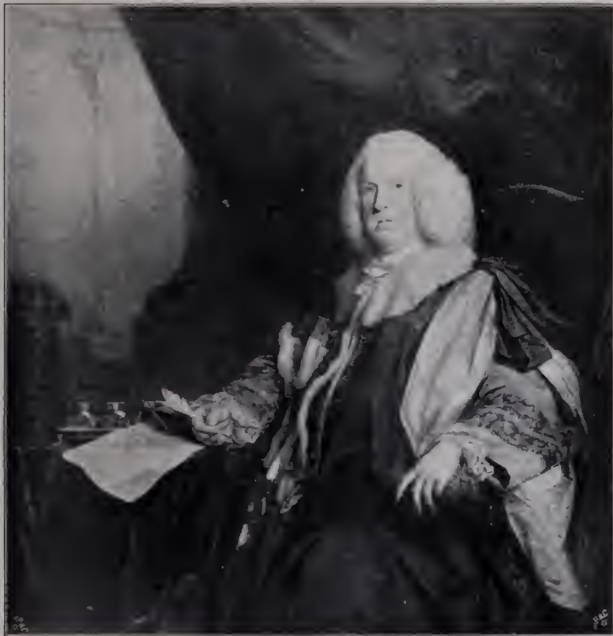
Abb. 34. William Pulteney Earl of Bath. 1761. National Portrait Gallery. (Zu Seite 109 u. 116.)

Dabei darf man nicht vergessen, daß ihm die Bewunderung für die Bolognesen frühzeitig eingeschärft worden war. Es war eins der Haupterziehungsmittel Hudjous,