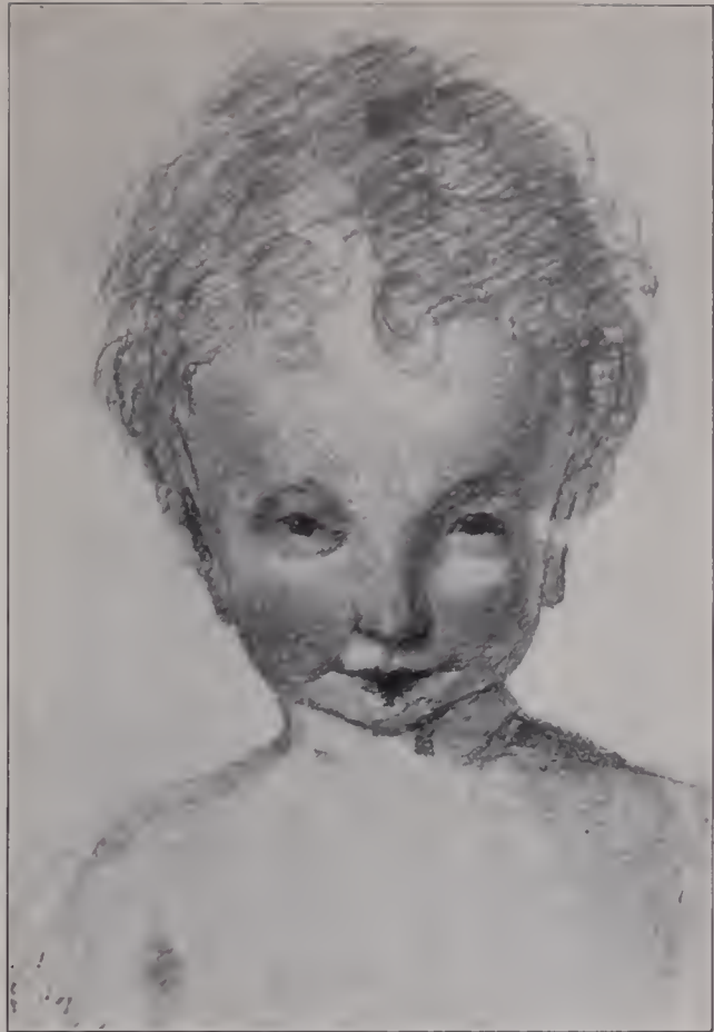
Abb. 98. Studie zum Puck. Zeichnung mit rötlichen Pastellströhen. South Kensington-Museum. (Zu Seite 95 u. 124.)