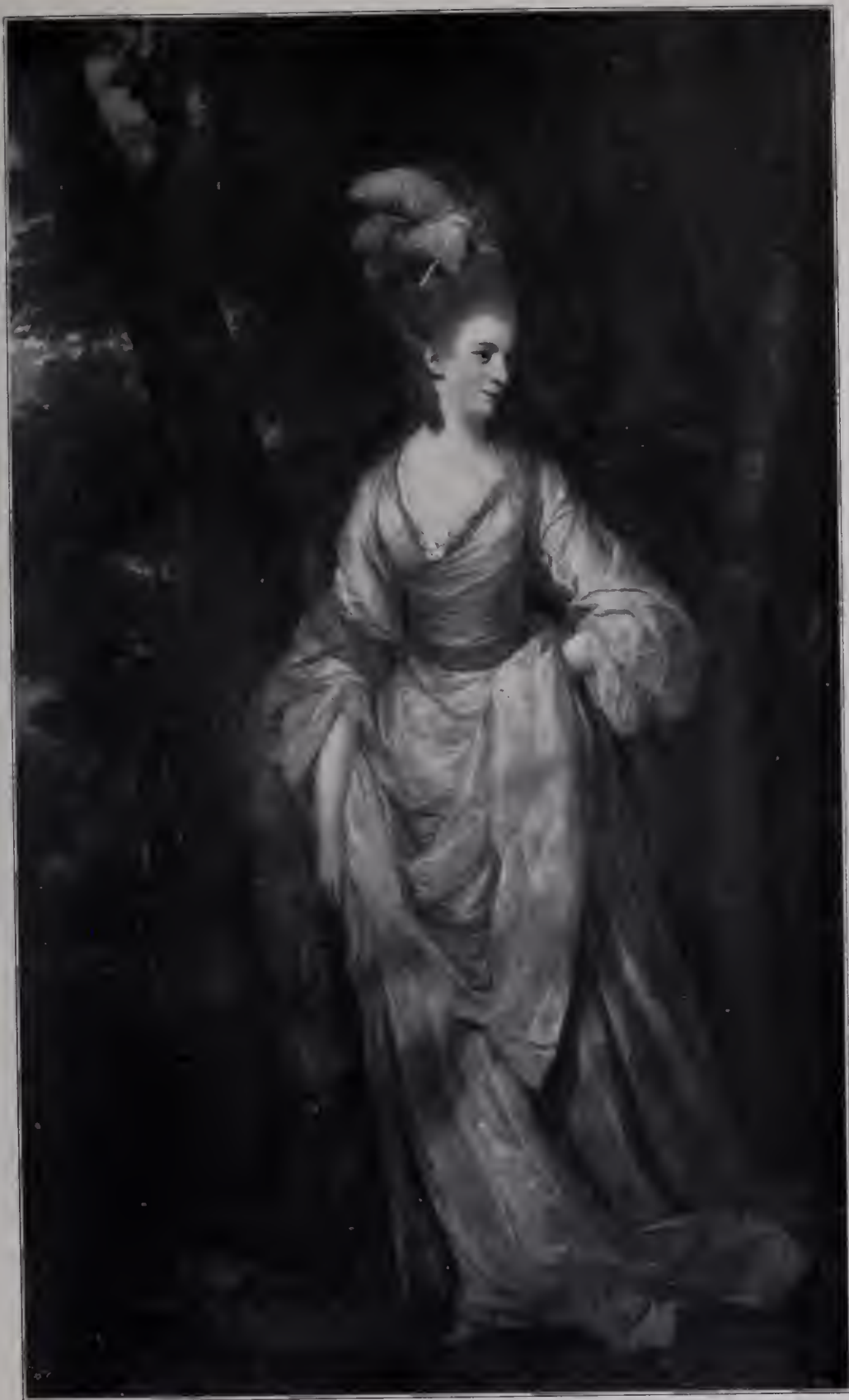
Abb. 64. Miß Cornwall. Wallace Collection. (Zu Seite 118 u. 119.)