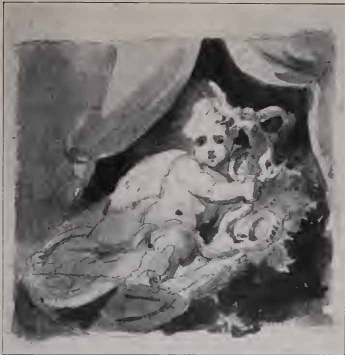
Abb. 107. Elizze zum jungen Herkules mit den Schlangen. Bleistift und Tusche. British Museum. (Zu Seite 95 u. 122.)