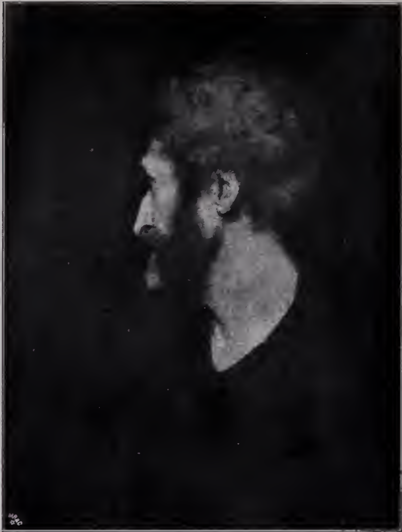
Abb. 21. Mannertopf im Profil. Studie. Um 1772. London, Nationalgalerie.

Zu Seite 116.