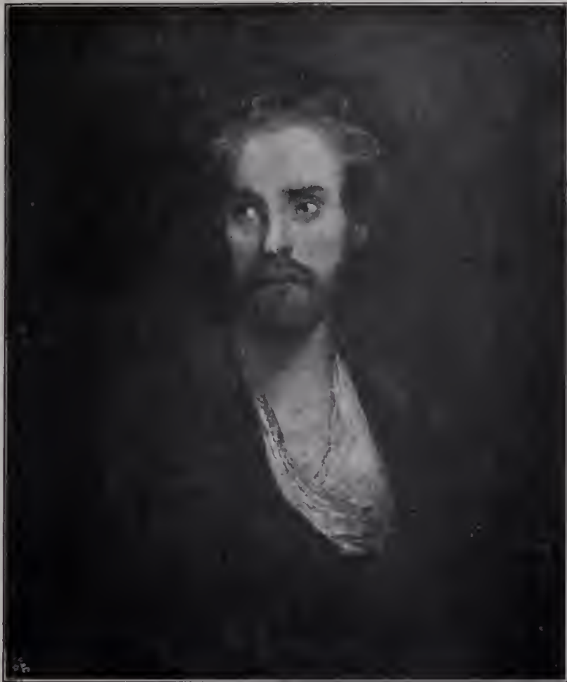
Abb. 30. The banished Lord. London, Nationalgalerie.

der Sohn James Gandys, der noch zu den englischen Schülern van Dycks gehört hatte. Die Werke Gandys, der schon nach 1715 gestorben war, wiesen indessen weniger auf van Dyck als auf Rembrandt zurück, dessen breiten und weichen Vortrag und dessen Licht- und Schattenverteilung der Engländer nachzunahmen strebte. Kein Zweifel, daß das Rembrandt-Element in Reynolds' Kunst, das sich später mit andern Einflüssen verschmolz, aus jener Zeit stammt. Das frühe, wohl jenen Jahren entstammende Selbstbildnis in der National Portrait Gallery, auf dem der junge Künstler seine Augen mit der Hand beschattet, sowie das zweite Selbstporträt mit dem Rembrandthut und dem quer durchs Gesicht gehenden Schatten der breiten Krempe, das dem Earl of Crewe gehört (Abb. 2), sind