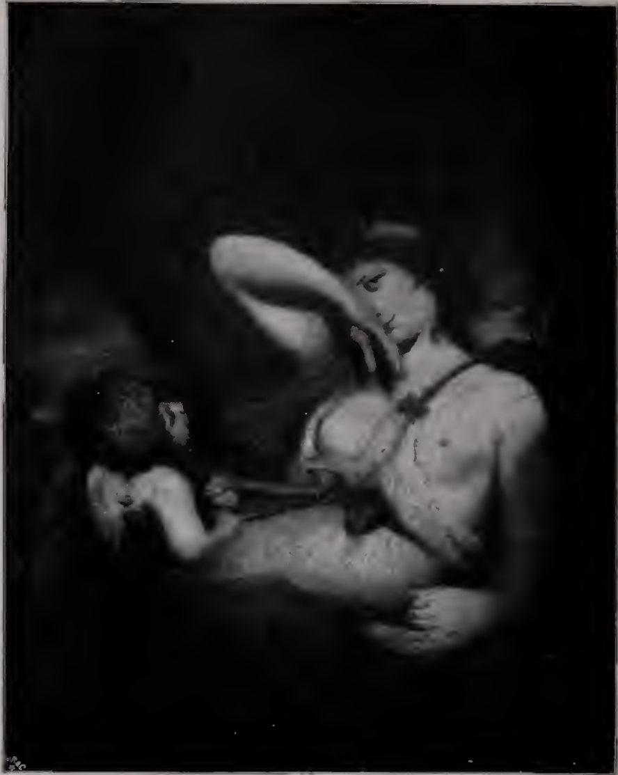
Abb. 89. Die Schlange im Grabe. 1782 bis 1784. London, Nationalgalerie. (Zu Seite 108, 122 u. 124.)

die natürlichen Grundlagen seiner Kunst zu borniert-akademischem Doktrinarismus. Der goldene Baum des Lebens und die grünen Gespenster der Theorien wachsen nebeneinander aus dem Boden desselben Geistes hervor.