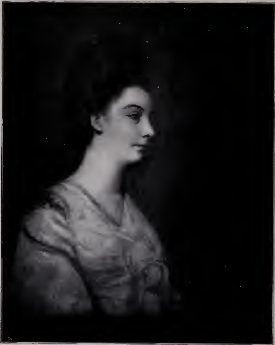
Abb. 37. Elizabeth Anna Linley (Eliza Sheridan). Glasgow, Gemäldegalerie. (Zu Seite 117.)

Kunst der blaffen, allgemeinen Abstraktionen, die sich ihrer Herkunft als einer gesteigerten Fähigkeit der Sinne schämt und mit der Gelehrsamkeit, der Philosophie, der Geschichtswissenschaft, der Mythologie, der Ethik kokettiert.