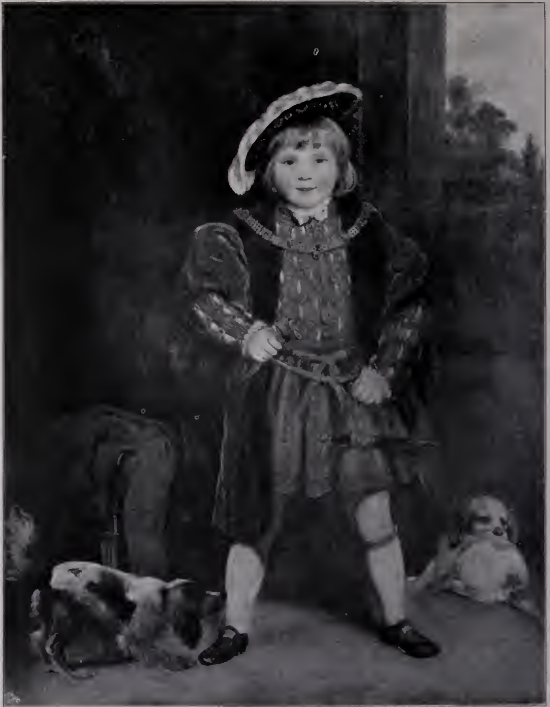
Abb. 73. Master Crewe. 1775—1776. Carl of Crewe. (Zu Seite 91 u. 120.)

wieder entläßt, wenn er fertig mit ihnen ist.“ Northcote hat dann später auch berichtet, daß der verehrte Meister seinen Schülern gegenüber recht tyrannisch sein konnte, daß er zum Beispiel höchst ärgerlich und herrisch war, als der jüngere Künstler öfters in dem