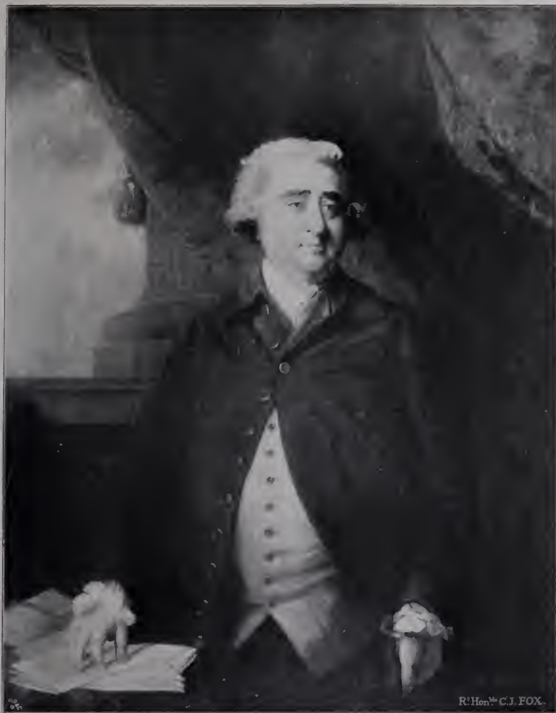
Abb. 26. Charles James Fox. 1781. Carl von Neuberger. (Zu Seite 68 u. 116.)

sogar gegenüber der gefährlichen Konkurrenz des Franzosen Jean Baptiste van Loo gehalten, der sich um 1740 in London aufhielt und mit seiner eleganten, frischen Porträtmunst auf das englische Publikum großen Eindruck machte. Fiorillo erzählt, daß die