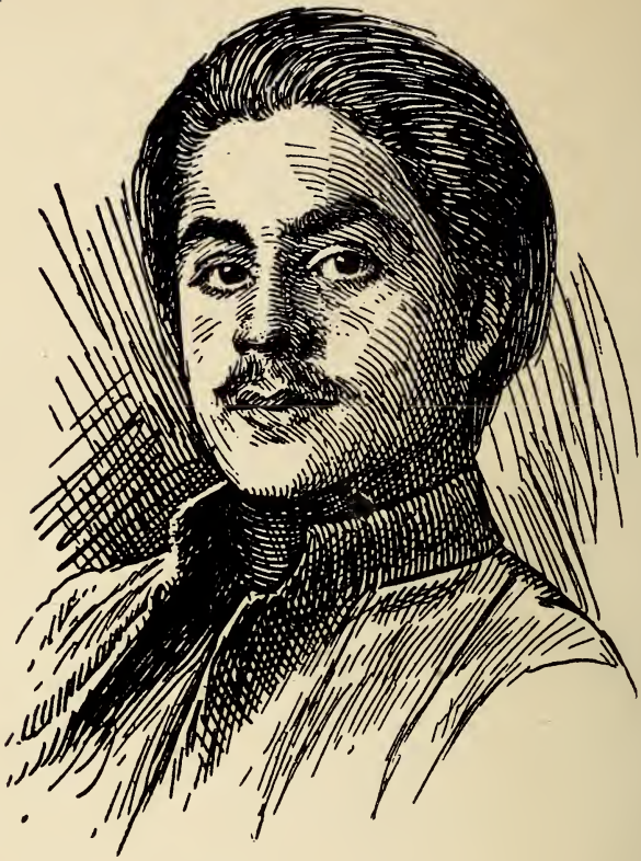
﴿ جبران خليل جبران ﴾