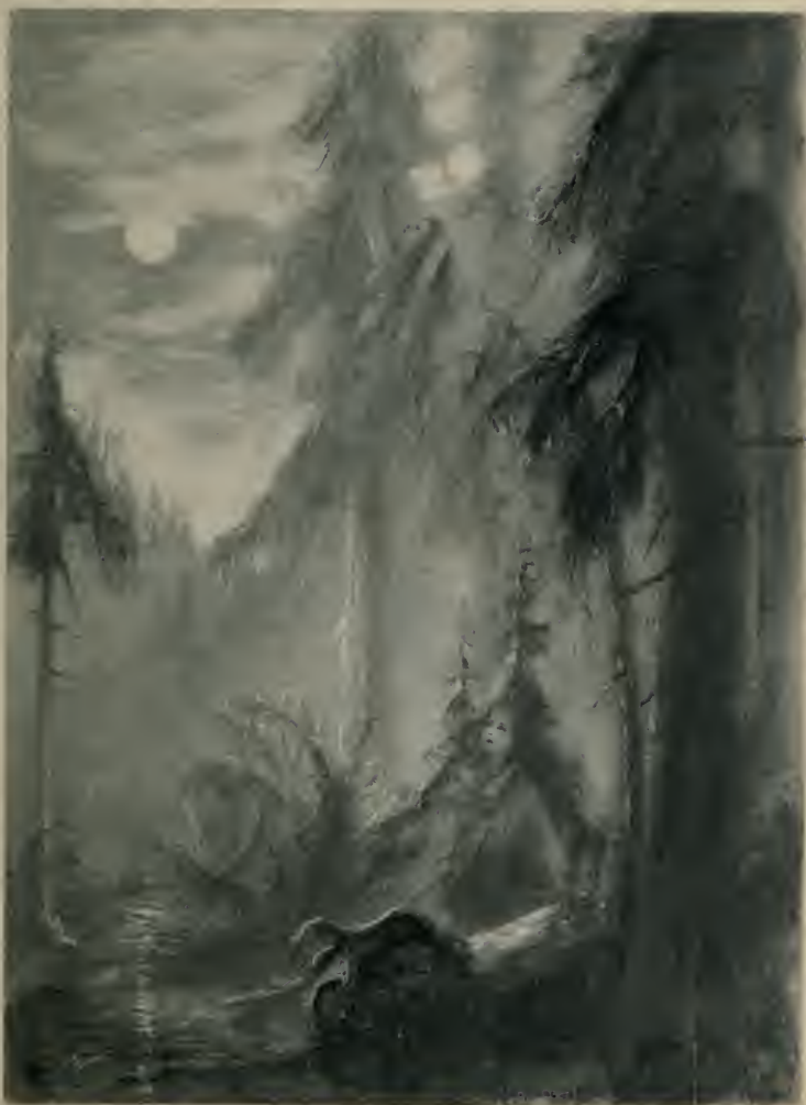
Eine Nacht zuvor hatte sich der Mond zu einer großen mattroten Scheibe erweitert . . . (S. 160 f.)