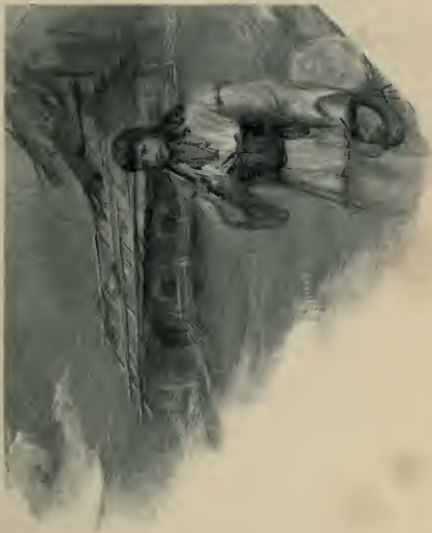
Die Thür der Hütte öffnete sich, und heraus trat, etwas gebeugt, ein junger Huzule . . . (S. 12.)