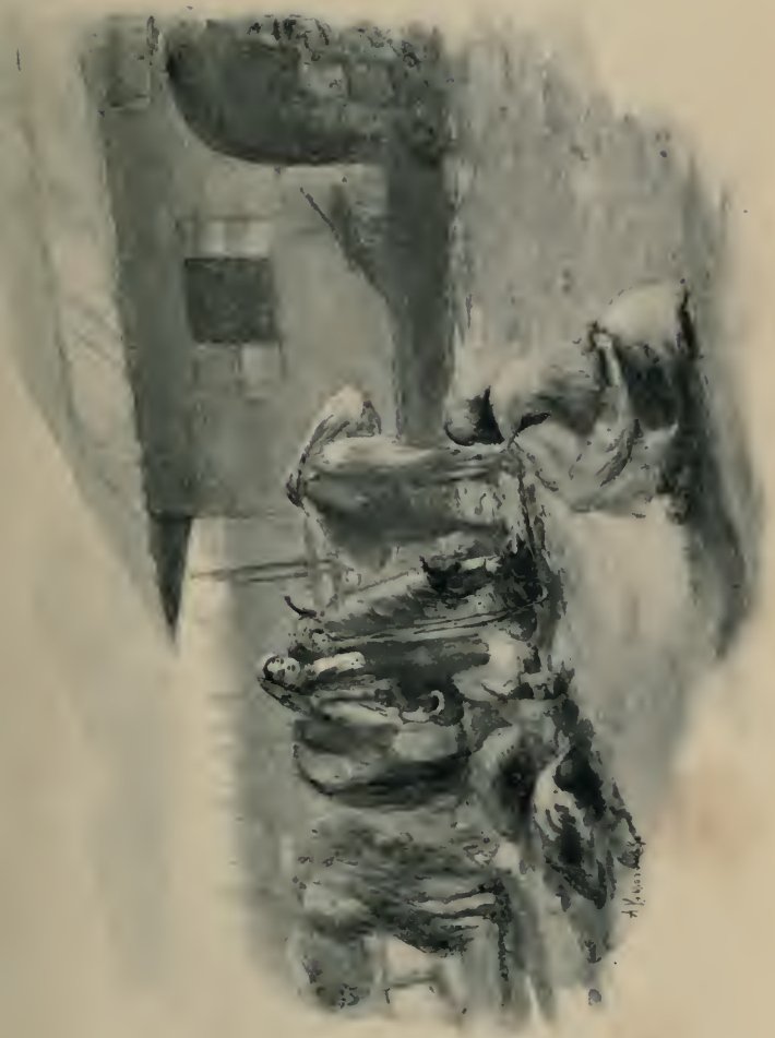
Vor dem Hause standen andere in Gruppen oder lagen da, aus kurzen Pfeifen rauchend, langgestreckt bei ihren Pferden. (S. 172.)