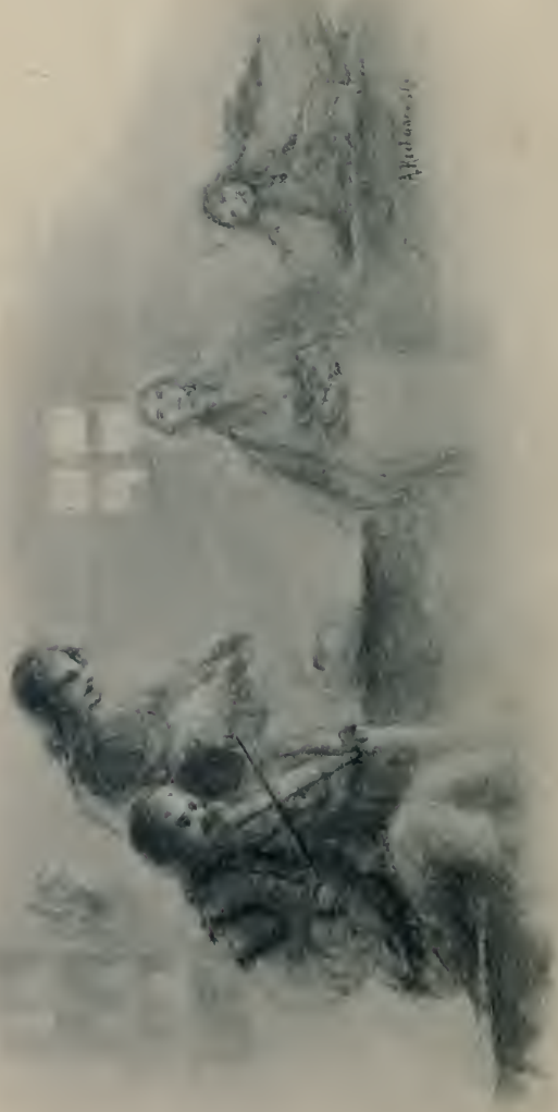
Zwei von ihnen spielten auf den Geigen ihren Nationaltanz, die Kolomyjka. (S. 169.)