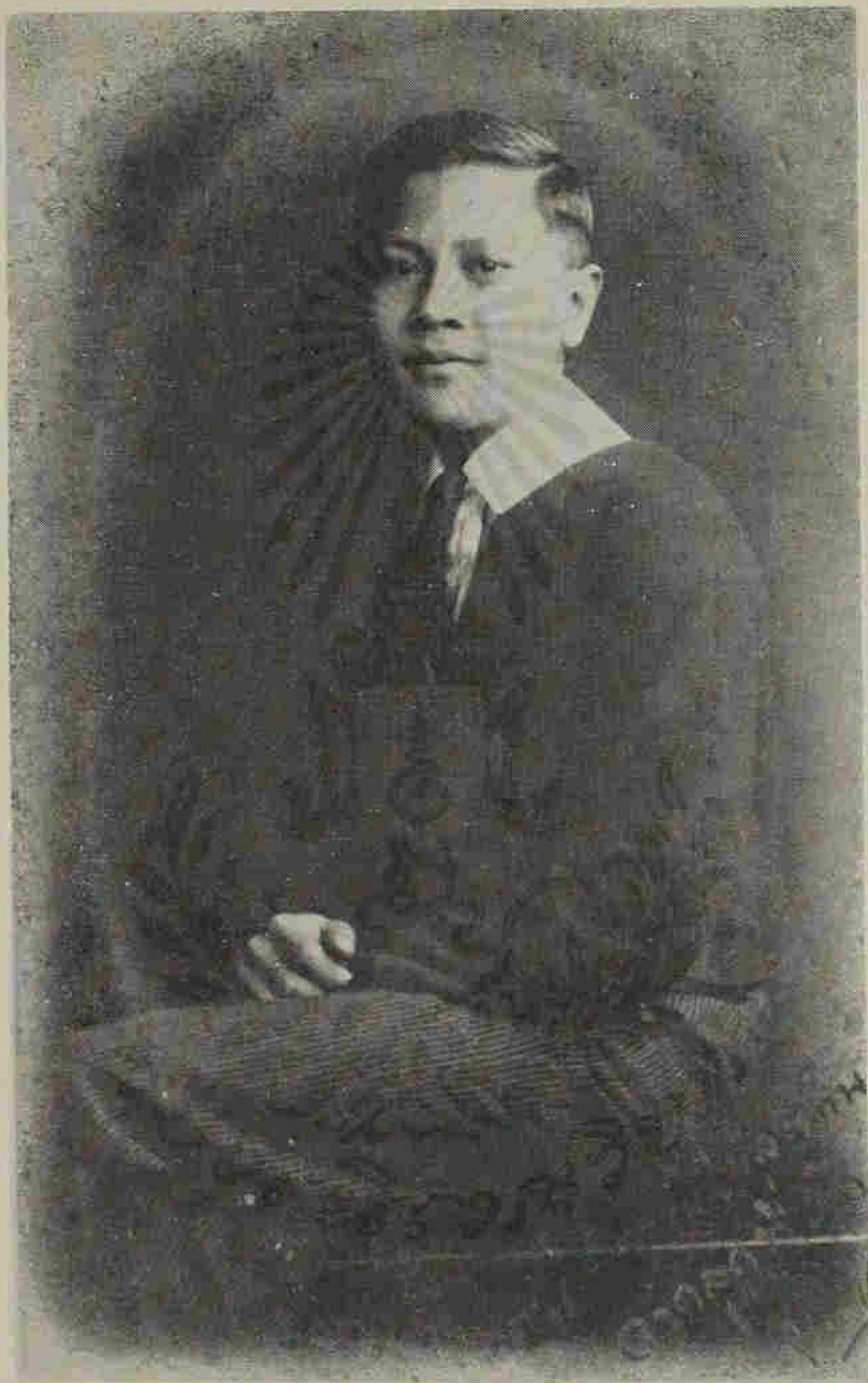
ถ่ายภาพเมื่ออายุ ๑๖ ปี ขณะเป็นนักเรียนอยู่ในประเทศอังกฤษ