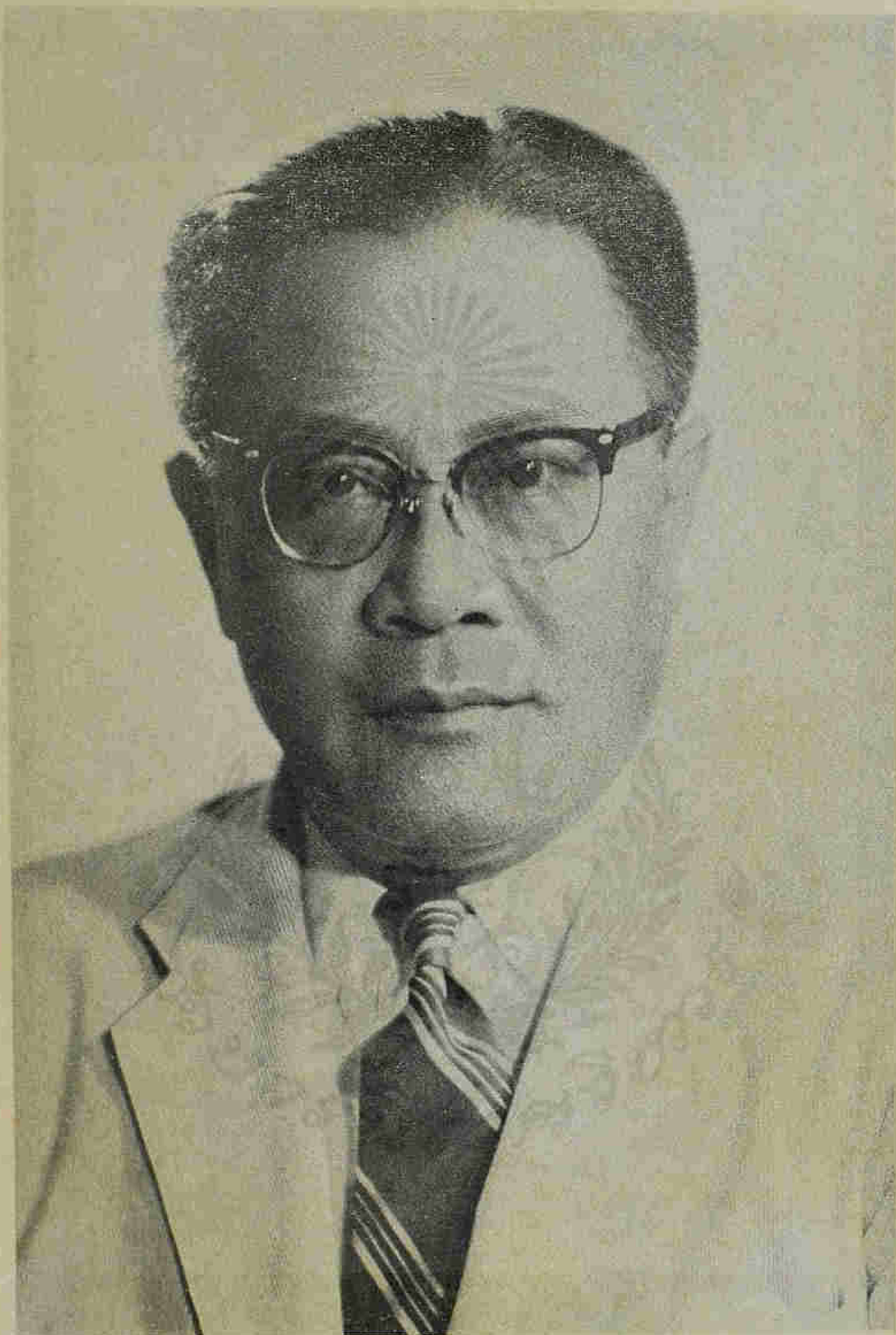
ม.ร.ว. ทองเถา ทองแถม

อดีตผู้อำนวยการช่วยผู้ว่าการ ธนาคารแห่งประเทศไทย