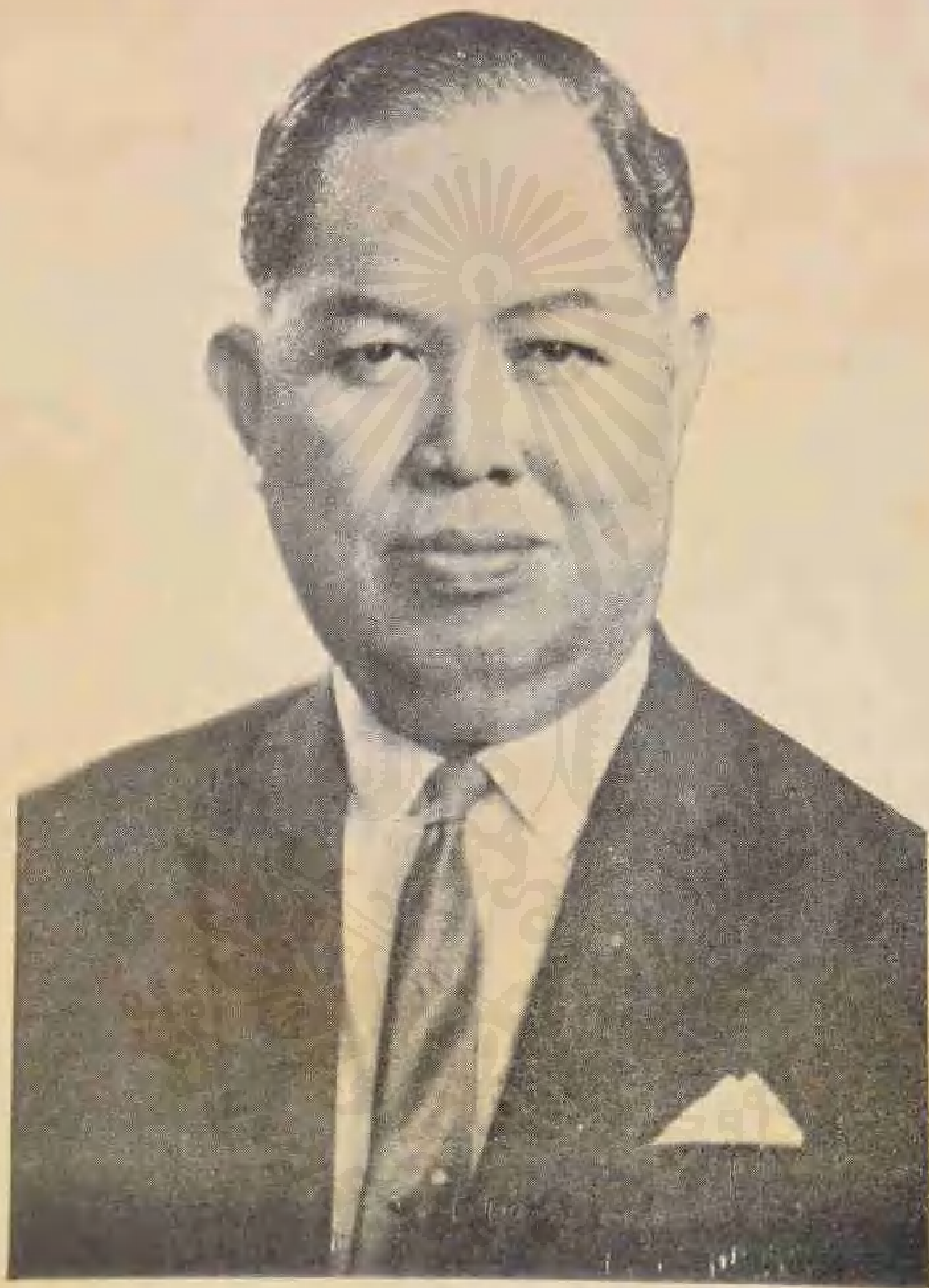
ชาติะ ๒๕ พฤศจิกายน ๒๔๕๓ มรณะ ๒๓ พฤษภาคม ๒๕๐๗