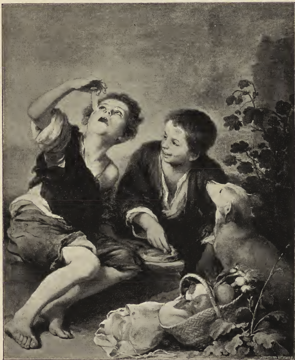
Abb. 16. Die Meloneneßer. In der königl. Pinakothek zu München.

Eigenschaften ebenso unwiderstehlich fesseln und vielleicht nachhaltiger erfreuen, wie jene anderen durch ihre irdische Naturtreue. Die Kinder Jesus und Johannes sind in diesen Kraut bewachsenen Berg hinaufgestiegen, um das eine verirrte Schaf zu suchen. Ermüdet von der beschwerlichen Wanderung sitzt er da auf einem Stein, und indem er