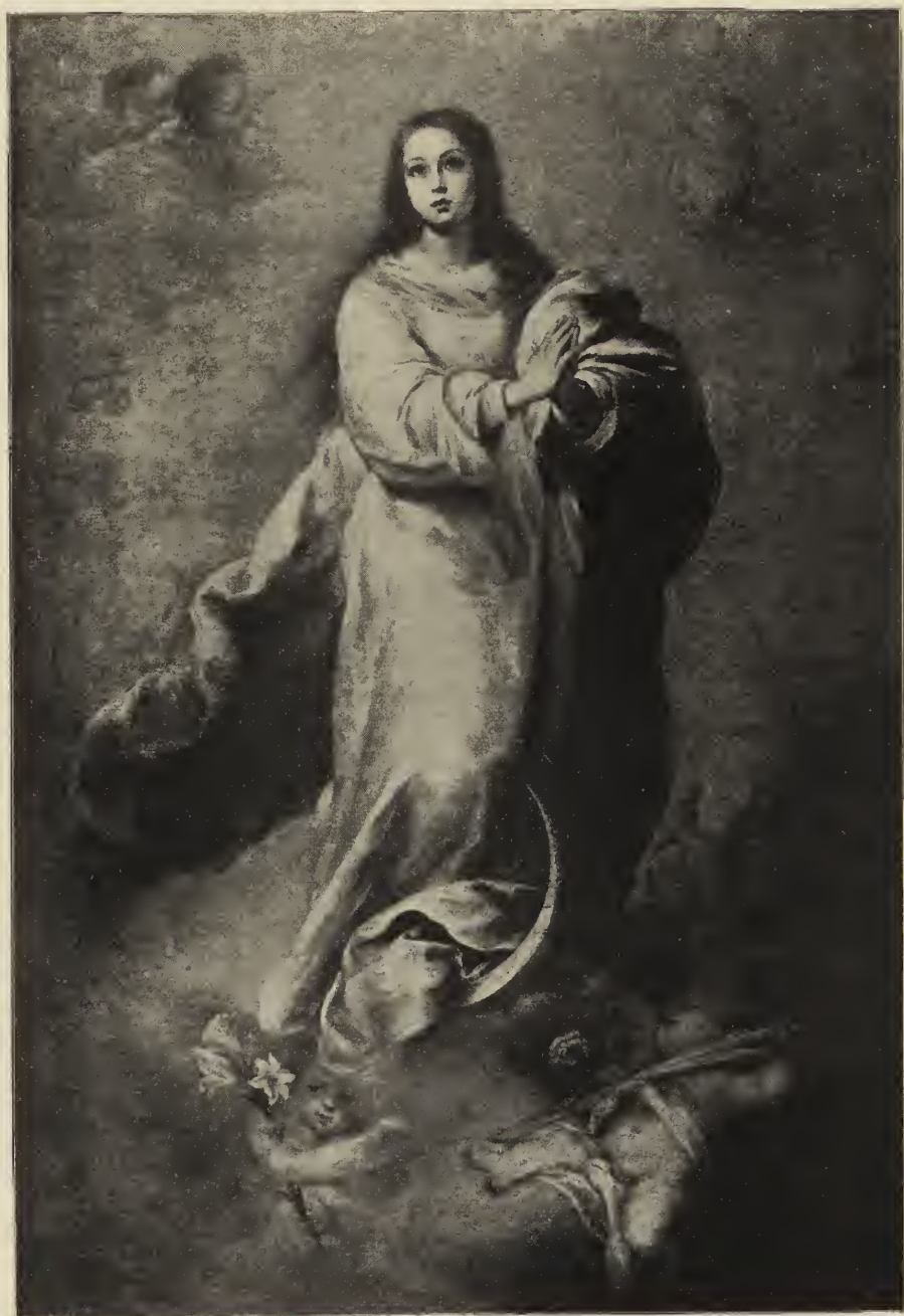
Abb. 59. Die unbefleckte Empfängnis. Im Pradamuseum zu Madrid.