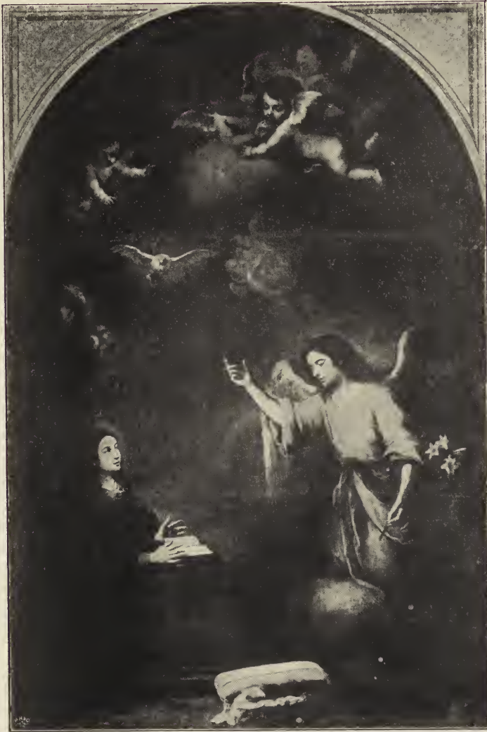
Abb. 42. Mariä Verkündigung. Altargemälde aus der Kapuzinerkirche, jetzt im Museum zu Sevilla.

scheinung von Christus und Maria darstellt, und ein Paar von Gegenständen, die Erzengel Raphael und Michael. Des ersteren hatte sich das Kloster schon vor der Bilder- räuberei der Franzosenzeit freiwillig entäußert — es steht nicht fest, aus welchem Grunde. Man weiß nicht, wo es schließlich hingelangt ist. Das Raphaelbild befindet sich in einem Nebenraum (in der Sagrestia de los cálices) der Kathedrale zu Sevilla. Die Kapuziner schenken es nach dem Abzug der Franzosen der Kathedrale als Dankesgabe für die gelungene Rettung