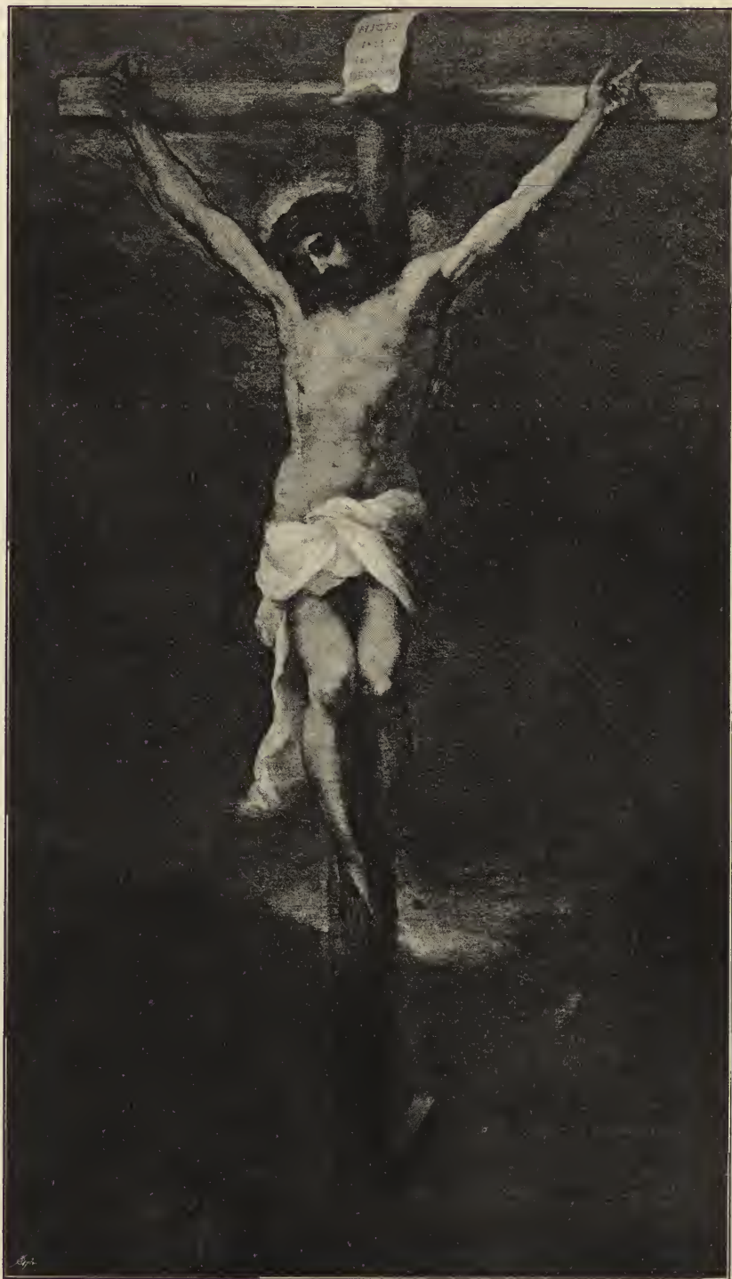
Abb. 55. Christus am Kreuz. Im Museum des Prado zu Madrid.