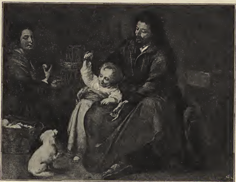
Abb. 11. Heilige Familie, zubenannt del pajarito (mit dem Vögelchen).

Auch Murillos Madonnenbilder haben diese Eigenschaft des rein Menschlichen, die in den Augen der Zeit und des Volkes gewiß ihren größten Vorzug bildete. Diese junge Mutter, die mit dem meistens ganz nackten Kind auf dem Schoße dasitzt, hat niemals etwas Übersinnliches, nicht einmal etwas von den Zufälligkeiten irdischer Erscheinung befreites Allgemeines, „Ideales“; sie kommt im Gegenteil dem Volke, welches vor sie hintritt, so nah wie möglich: sie ist Spanierin. Vielleicht nur in einigen seiner allerältesten Madonnenbilder hat Murillo versucht, die Form des Gesichts zu ver-