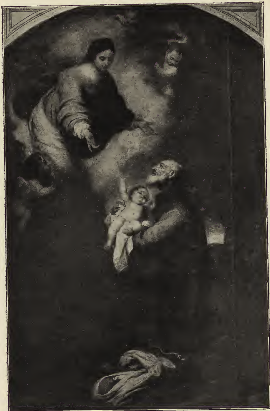
Abb. 46. Der heilige Felix von Cantalicio. Altargemälde aus der Kapuzinerkirche, jetzt im Museum zu Sevilla.