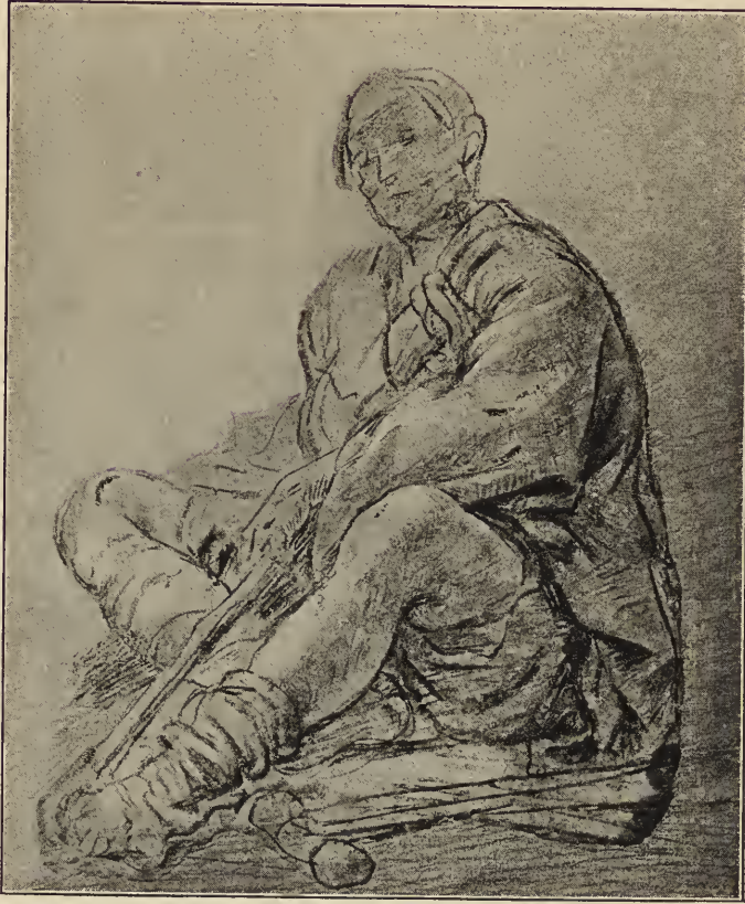
Abb. 4. Ein Bettler. Studienzeichnung in der Uffiziengalerie zu Florenz.

Das andere Bild bewegt sich ganz auf irdischem Boden, es zeigt sich uns als ein Meisterwerk der Naturbeobachtung. Es ist mit einer so schlichten Treue aus der Wirklichkeit gegriffen, daß man sich sehr wohl das Aufsehen vorstellen kann, welches ein