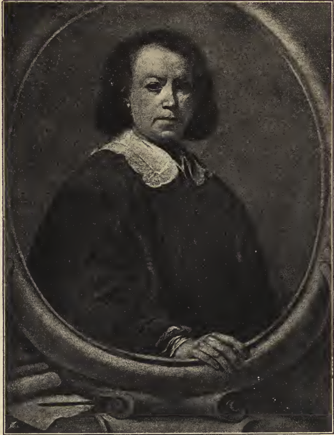
Abb. 1. Bartolomé Estéban Murillo.

Gemalt von Don Alonso Miguel de Tobar, angeblich nach einem verschollenen Selbstbildnis des Meisters, im Prado-Museum zu Madrid.