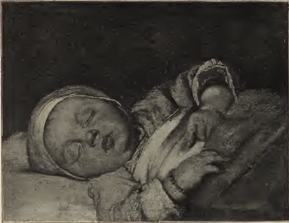
Abb. 14. Ein schlafendes Kind. In der Czernin-Galerie zu Wien.

Malers bald so hoch geschätzt, daß Spanien schließlich kein einziges dieser Bilder behalten hat. Die größte Anzahl derselben — fünf — besitzt die Münchener Pinakothek, darunter zwei, die zu Murillos allerköstlichsten Werken dieser Gattung gehören: „Die würfelspielenden Gassenbuben“ und „Die schmausenden Gassenbuben.“ Der Reiz dieser beiden wie mit einem schimmernden Lichtton gemalten Bilder ist ein außerordentlicher. Eine größere Lebenswahrheit, eine