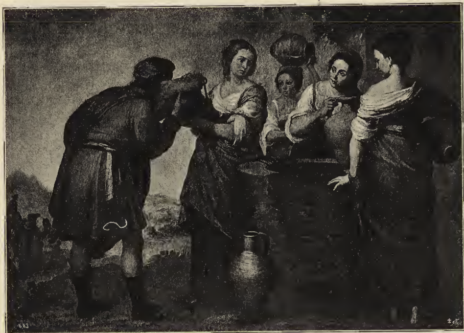
Abb. 10. Rebekka und Elieser. Im Museum des Prado zu Madrid.

Ganz unabhängig von allem Herkömmlichen — in künstlerischer wie in sachlicher Beziehung — ganz unbefangen aus dem