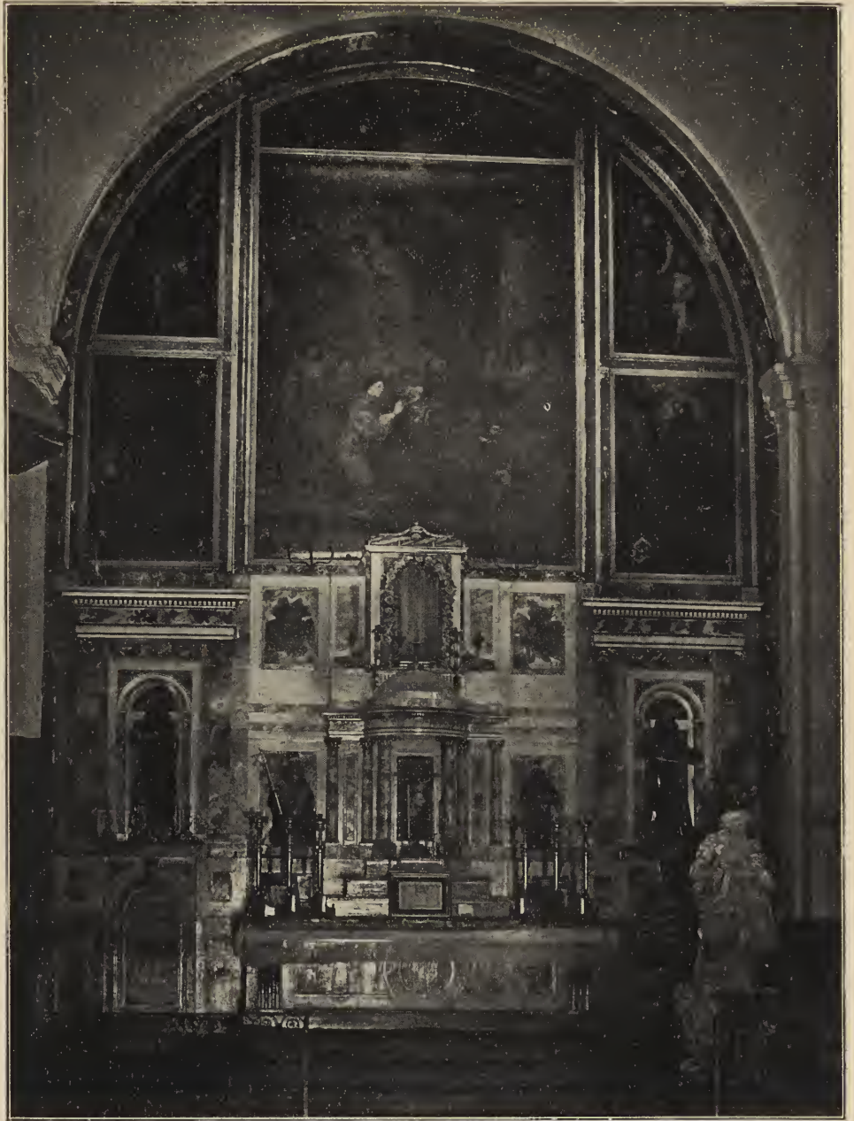
Abb. 66. Der Hochaltar in der Kirche des ehemaligen Kapuzinerklosters zu Cadix.

hängenden Mantel Marias aufheben: hier zu, daß er die Arbeit aufgeben und sich hat eine fremde Hand ergänzt, was der nach Sevilla zurückbringen lassen mußte. Meister selbst nicht mehr malen konnte. Die Vollendung des Altarwerkes in Cadix blieb Schülerhänden überlassen. Sicher bis auf weniges fertig war, durch einen lagen zu den Nebenbildern Entwürfe und Sturz vom Gerüst derartige Verletzungen Farbenskizzen von der Hand des Meisters