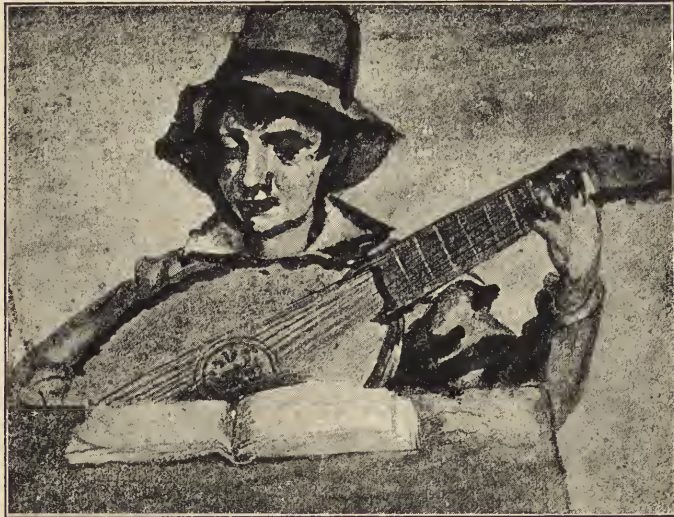
Abb. 5. Knabe, die Gitarre spielend. Eudienzzeichnung in der Albertina zu Wien.

Von den größeren Bildern aus dem Kreuzgang des Franziskanerklosters ist eines nach Paris in die Galerie des Louvre gelangt. Das ist ein merkwürdiges Bild; eine Dichtung von liebenswürdigster Unbefangtheit, so kindlich, wie die Legende, die es behandelt. Man braucht die Legende nicht zu kennen, das Bild erzählt sie (Abb. 3). Diego, der Laienbruder, ist mit dem Küchen dienst beauftragt worden. Aber fromme Anmutungen haben ihn diese weltliche Aufgabe vergessen lassen; dem irdischen Boden entrückt, kniet er in der Luft, anbetend in der Anschauung unsichtbarer Geheimnisse, schon umleuchtet von dem Glanz seiner zukünftigen Heiligkeit. Damit aber die Gnade, welche Diego zu teil wird, den Brüdern keine irdische Benachteiligung bringe, haben Him melsboten inzwischen die Verrichtung seines Küchenamts übernommen. In der Mitte des Bildes stehen zwei große Engel, die sich über die Besorgung von Speise und Trank beraten; der eine, in lichtvioiolettem Gewand, mit dunkelgoldigem Schimmer auf den weißen Flügeln, schießt sich an, zur Füllung eines großen Thonkrugs davonzueilen; der andere, in gelbem Gewand mit grünlichblau überflogenen Fittichen, berührt mit der Hand ein auf dem Küchentisch liegendes Stück Lammfleisch. Im Vordergrund sind zwei nackte Engelkinder am Gemüsekorb beschäftigt, ein etwas größeres