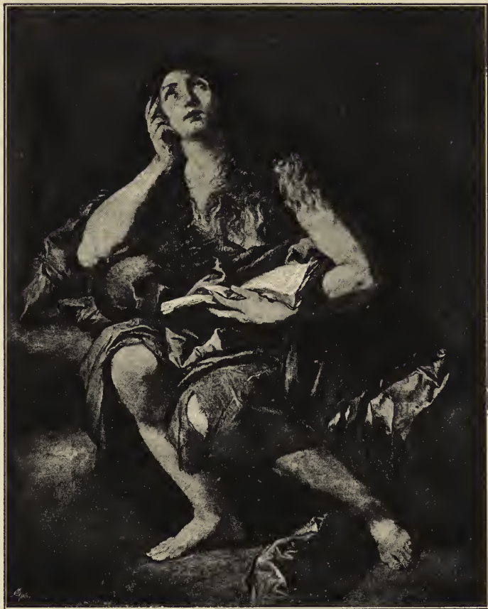
Abb. 54. Die büßende Magdalena. Im Pradomuseum zu Madrid.

Ganz anders gestimmte, weichere Farbtöne im Verein mit einer sehr kräftigen, Licht und Schatten scharf voneinander scheidenden Beleuchtung verleihen dem Bild der Büßerin Magdalena (Abb. 54) einen