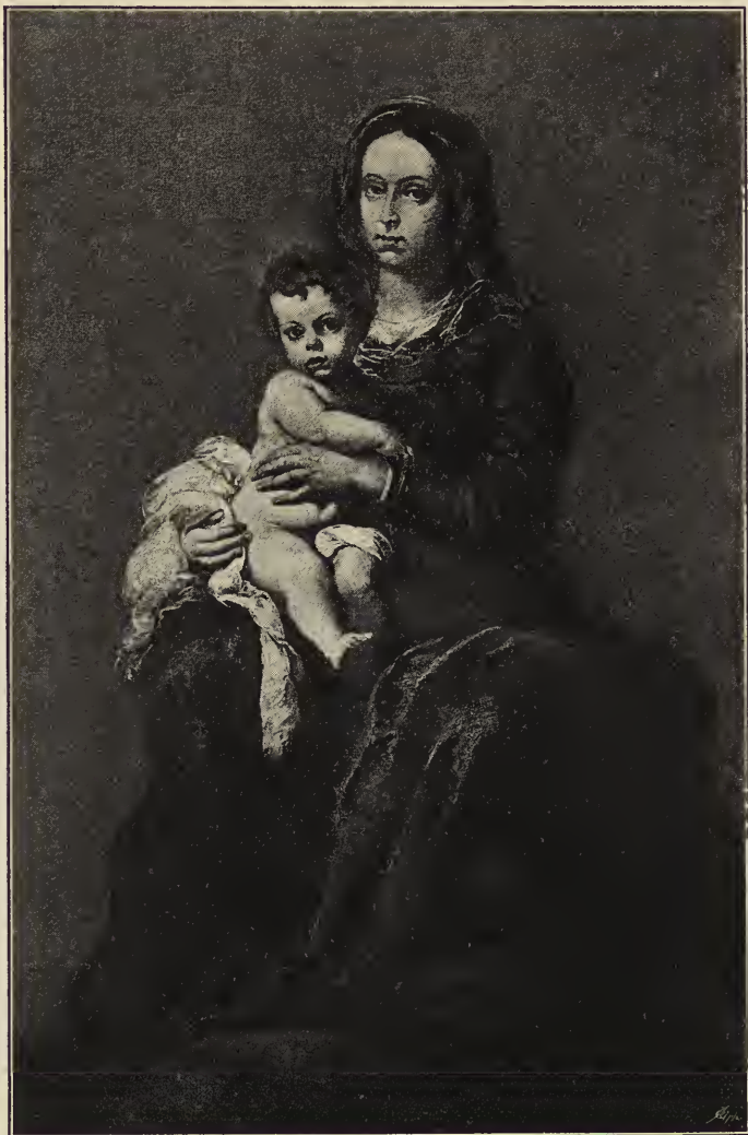
Abb. 12. Die Jungfrau und das Christuskind. Im Museum des Prado zu Madrid.

allgemeinern. Für die meisten seiner späteren Madonnen ist selbst die Bezeichnung „Spanierin“ nicht eng genug; sie sind reine Andalusierinnen. Untereinander sind sie außerordentlich verschieden. Auch das Kind ist ein wirkliches Menschenkind, und zwar ein spanisches. Dennoch würde man sehr unrecht haben, wenn man diese Madonnen profan finden wollte. Wenn man von dem Weihevollen, das in der Farbenstimmung liegen kann, ganz absieht: man braucht sich nur in die Augen von Mutter und Kind zu vertiefen, deren Blick so ruhig und so zutrauenerweckend auf uns haftet, und man