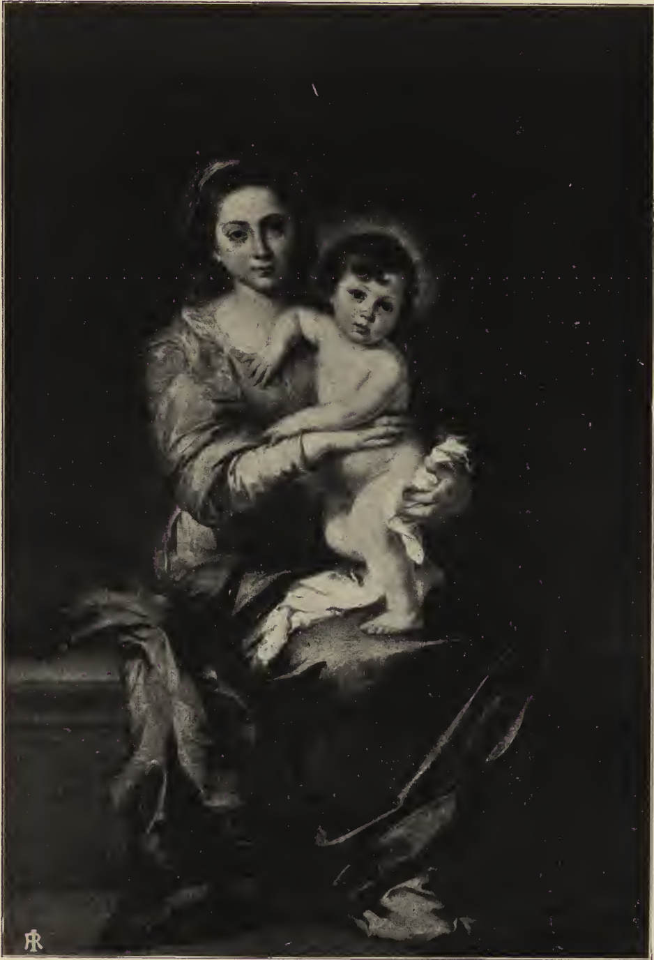
Abb. 63. Madonna. In der Sammlung des Palastes Pitti zu Florenz.