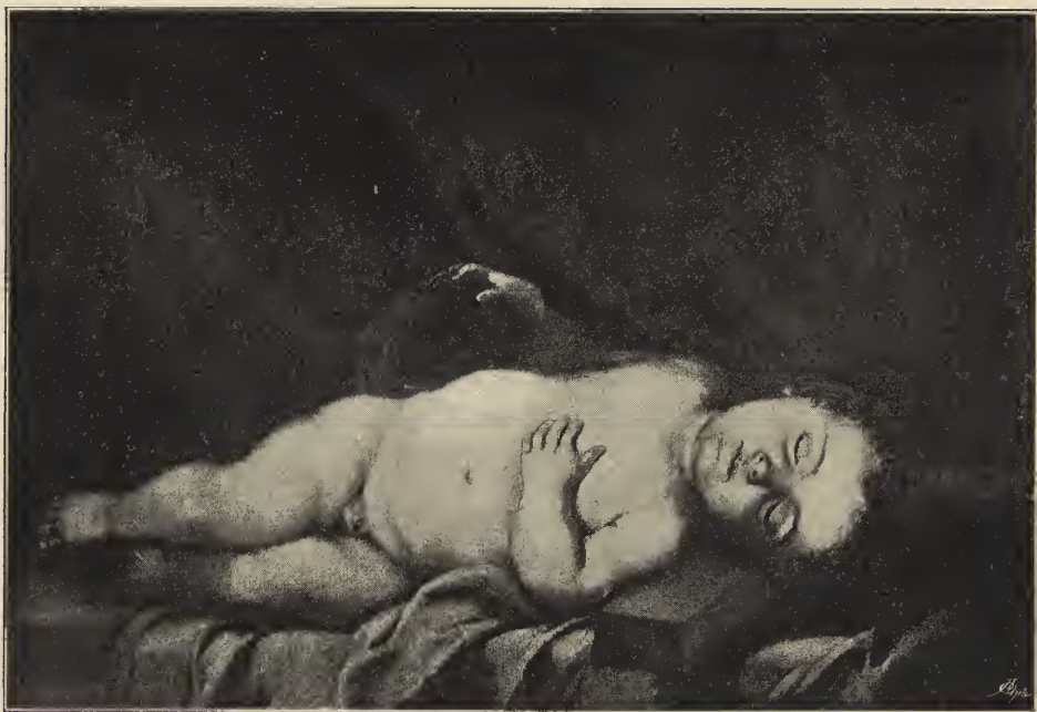
Abb. 13. Das auf dem Kreuze schlafende Christuskind. Im Pradomuseum zu Madrid.

für Form, Bewegung und Ausdruck der Kinder. Und ehe noch im übrigen seine künstlerische Entwicklung völlig zur Reife gelangte, war er schon ein thatsächlich unerreichter Meister in diesen Dingen. Gern malte er Kinder allein. Der als Kind auf der Erde erschienene Gott gab ja für einen phantasiebegabten Künstler Stoff genug zu derartigen Bildern. So zeigt ein eigentümlich ergreifendes Gemälde im Prado das Christuskind auf dem Kreuze schlummernd, das rechte Händchen auf einen Totenkopf gelegt; etwas wie eine schmerzliche Ahnung