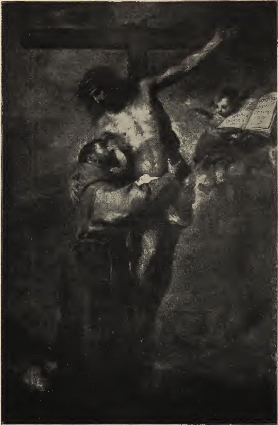
Abb. 47. Die Weltentfagung des heiligen Franciscus. Altargemälde aus der Kapuzinerkirche, jetzt im Museum zu Sevilla.