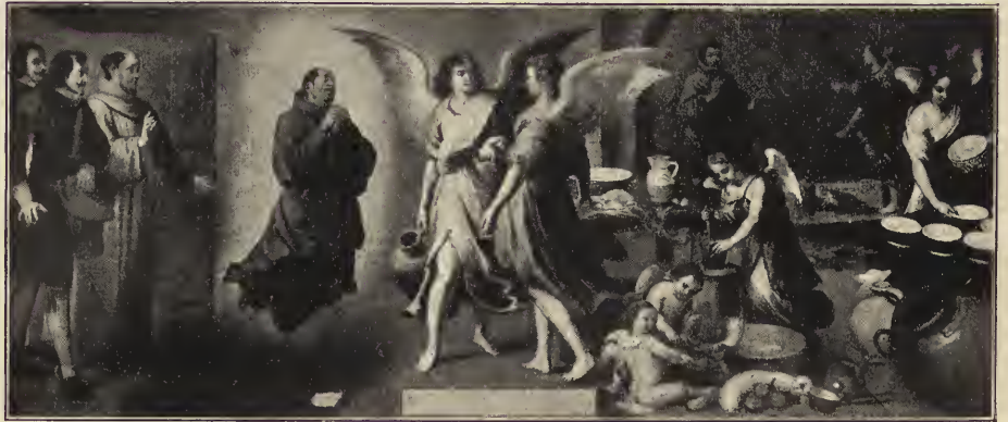
Abb. 3. Das Wunder des heiligen Diego („Die Engelfische“). Im Louvremuseum zu Paris.

Es handelte sich um eine Reihe von Darstellungen aus der Geschichte von Heiligen des Franziskanerordens. Dieselben waren als einzelne Ölgemälde auszuführen, denn die Kunst der Freskomalerei hatte in Andalusien keinen Boden gefunden. Murillo malte diese Bilder, elf an der Zahl, die einen von größerer, die anderen von geringerer Breitenausdehnung, in den Jahren 1645 und 1646. Durch sie wurde er mit einem Schlage zum berühmten Mann. Ganz Sevilla staunte ihn an. Denn niemand wußte, so heißt es in der alten Lebensbeschreibung, woher er den neuen, meisterhaften, unbekanntem Stil hatte, für den es in Sevilla weder Vorbild noch Lehrer gab. Man glaubte, da die Reise nach Madrid Murillos Geheimnis blieb, er habe sich während der zwei Jahre in seiner Wohnung eingeschlossen gehalten, um unausgesetzt Naturstudien zu malen. Daß in dem eingehenden und erfolgreichen Studium der Natur das Geheimnis der überraschenden Wirkung dieser Gemälde lag, das war allerdings zutreffend. — Das Kloster war stolz auf den außerordentlichen Kunstbesitz. Die Bilder wurden zum Schutz mit Vorhängen versehen und nur an Festtagen enthüllt. Aber das schlimme Jahr 1810 gab sie den Räuberhänden preis. Als Joseph Bonaparte am 1. Februar jenes Jahres seinen Einzug in Sevilla gehalten hatte, wurde