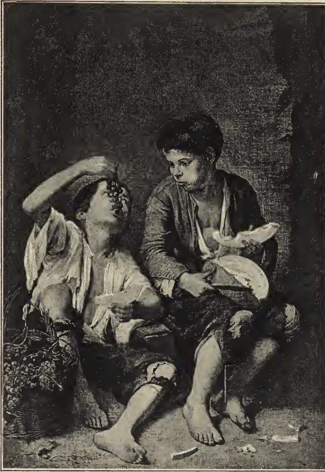
Abb. 15. Die schmausenden Gassenbuben. In der königl. Pinakothek zu München.