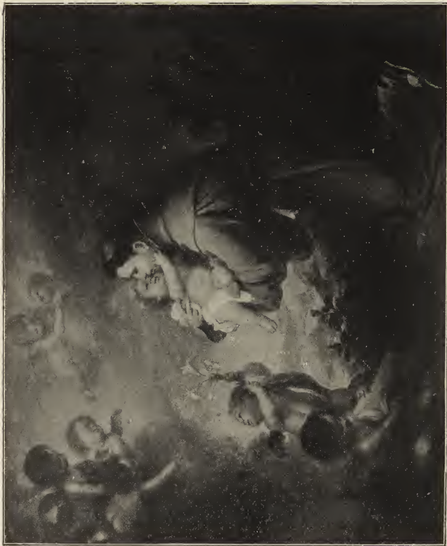
Abb. 26. Der heilige Antonius. Im königl. Museum zu Berlin.

der Lauretanischen Litanei genannt werden. dem Monde das Erhabensein über die — Zu Murillos Zeit war man dazu über- Wandelbarkeit ausgedrückt werden solle. An gegangen, unter Weglassung des gesamten das Sonnenkleid erinnert noch der goldfar- schwerfälligen Beiwerks sich auf das Bild bige Lichtton, von dem die Gestalt sich ab- hebt. Die Gestalt selbst ist heller als dieser