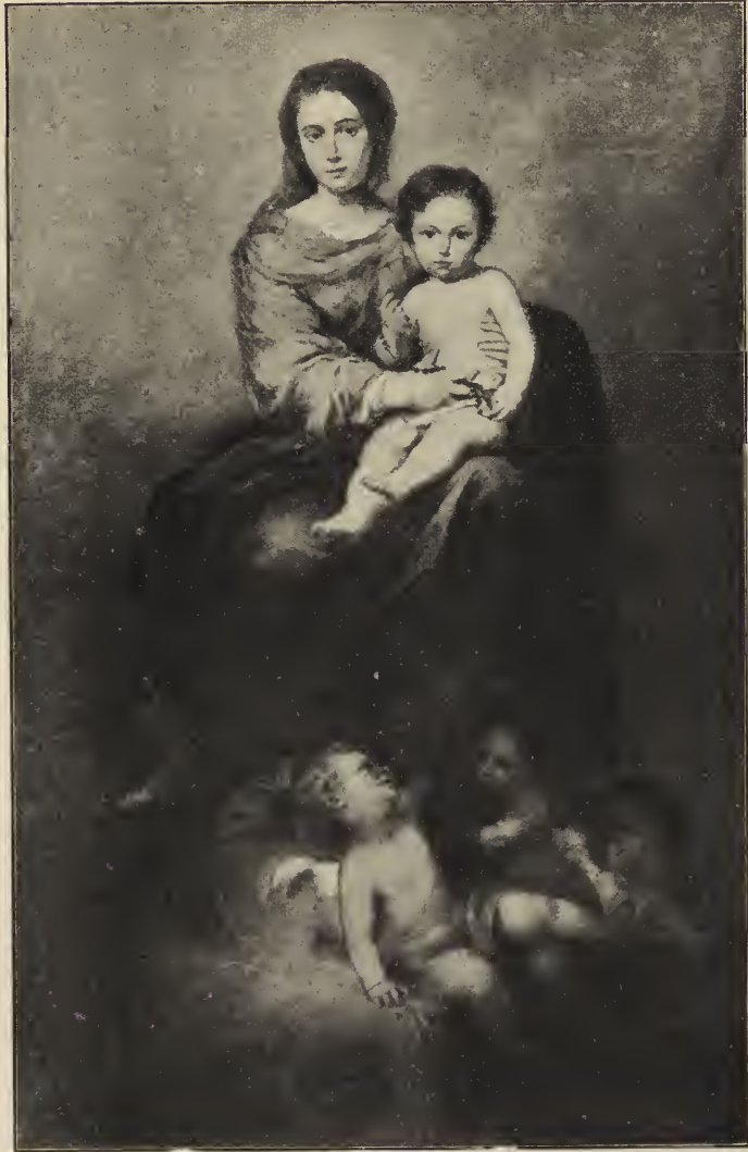
Abb. 64. Die Jungfrau mit dem Rosenkranz. In der Dulwichgalerie in London.

Kinde sitzt. Das helle und doch kräftige Rot und Blau ihrer Kleidung heben sich prächtig ab von dem Silberton und verbinden sich mit dem ebenso kräftigen Gelb der Gewandung eines hinter ihr stehenden einen Mantel von Goldbrokat. Große Engel mit farbigen Gewändern und Fittichen — in den Köpfen Abbilder andalusischer Mädchen — stehen auf beiden Seiten. Aus dem Lichtgewölk lösen sich, etwas körperhafter