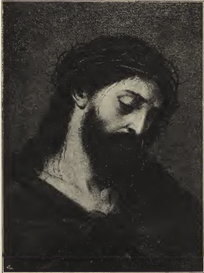
Abb. 23. Ecco homo. Im Museum des Prado zu Madrid.

Rechte des Heiligen gelegt, dem es mit einer lieblichen Wendung des lockigen Köpfchens in die Augen schaut (Abb. 25). Während hier eine heilige Scheu den Sterblichen noch zurückhält, auch nur seine Hand um diejenige des in Kindergestalt zu ihm gekommenen Gottes zu schließen, sehen wir in