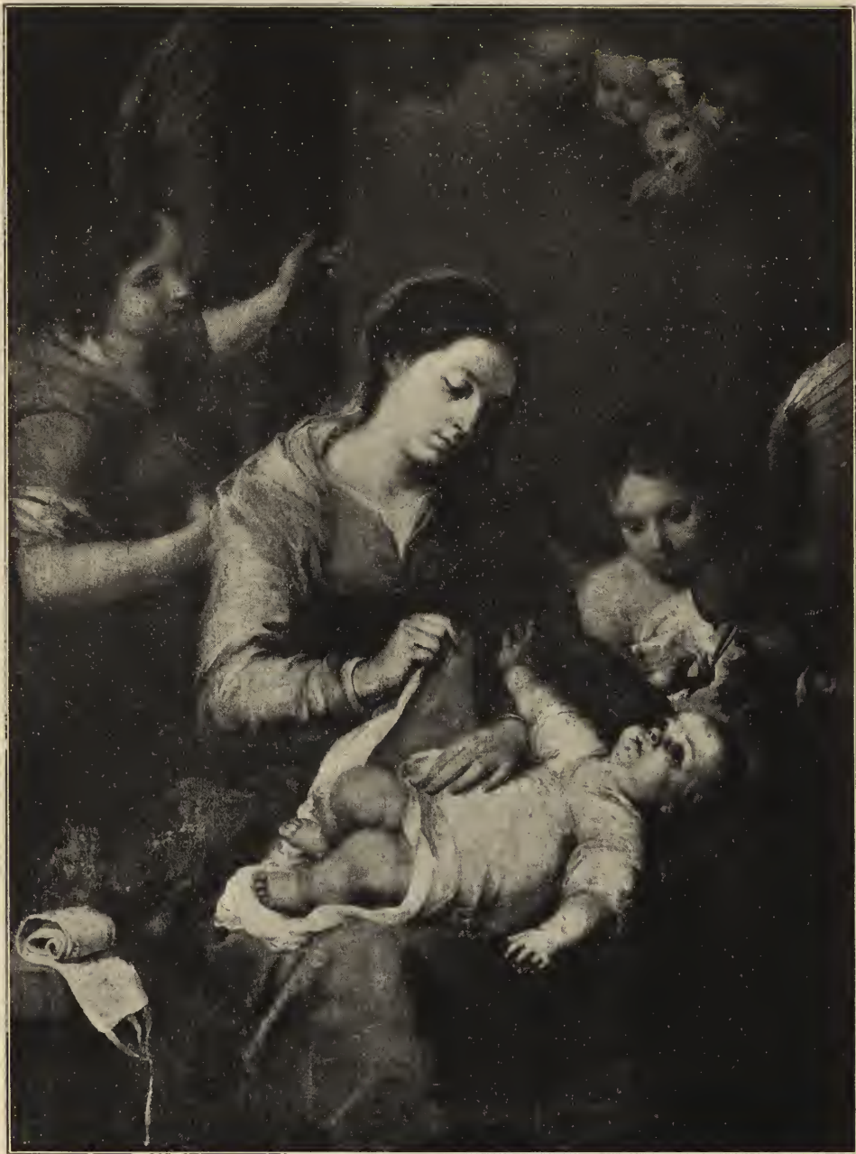
Abb. 65. Madonna, zubenannt mit dem Wickelband (de la faja). Im Besitz des Prinzen Don Antonio zu Madrid.