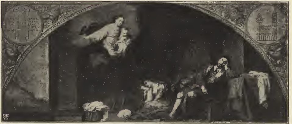
Abb. 29. Der Traum des Patriziers Johannes. Gemalt für die Kirche Santa Maria la Blanca in Sevilla jetzt in der Akademie San Fernando zu Madrid.

stellung der unbefleckten Jungfrau und der katholischen Kirche — auch diese unter dem Bilde einer Jungfrau dargestellt — gewählt. Das Jahr 1665 wird als dasjenige angegeben, in welchem Murillo diesen Auftrag zu Ende führte. Die Gemälde schmückten die Kirche bis zur Besetzung Sevillas durch die Franzosen. Der Marschall Soult ließ sie bei der Plünderung der Kirchen und Klöster alle vier als seinen eigenen Beuteanteil einpacken. Doch gelang es, wenigstens die beiden größeren für Spanien zurückzugewinnen; sie befinden sich in der Akademie S. Fernando zu Madrid. Von den beiden kleineren ist das eine nach England in eine Privatsammlung gekommen,