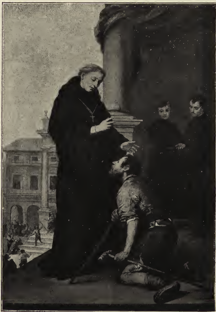
Abb. 50. Die Heilung eines Lahmen durch einen Heiligen des Augustinerordens (Thomas von Villanueva?).

Die beiden aus der Augustinerkirche geretteten Gemälde des Museums zu Sevilla sind diesem Bild sehr ähnlich im Ton und wetteifern mit demselben in der Pracht der Wirkung. Beide stellen den heiligen Augustinus dar, in Anschauung von Erscheinungen, welche sich auf Stellen aus den Schriften des großen Kirchenlehrers beziehen. Hier reicht derselbe sein flammendes Herz dem Jesuskind dar, und dieses durchbohrt dasselbe mit dem Pfeil der Liebe. Dort offenbart sich ihm die heiligste Dreifaltigkeit.