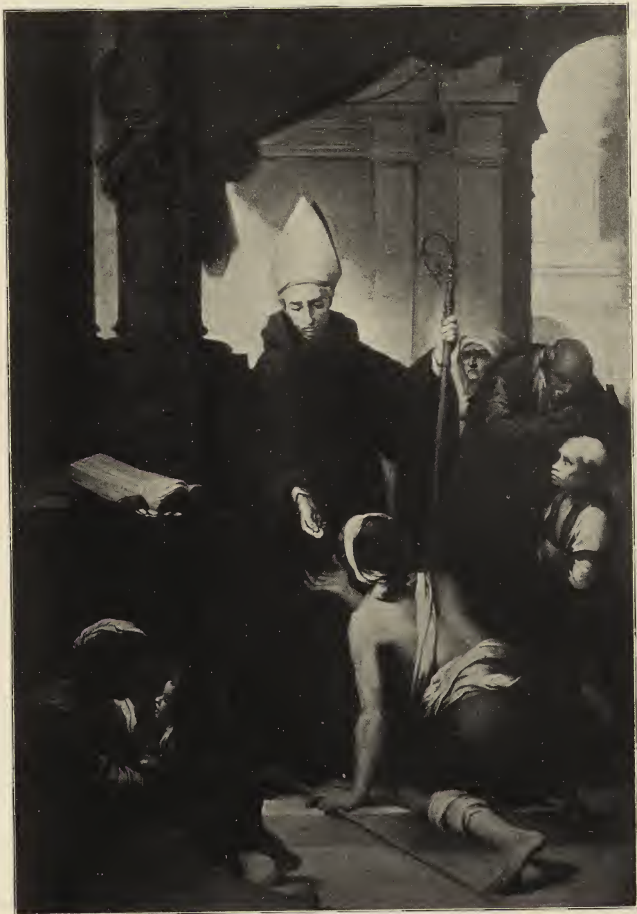
Abb. 48. Der heilige Thomas von Villanueva als Almosen spender. Altargemälde aus der Kapuzinerkirche, jetzt im Museum zu Sevilla.