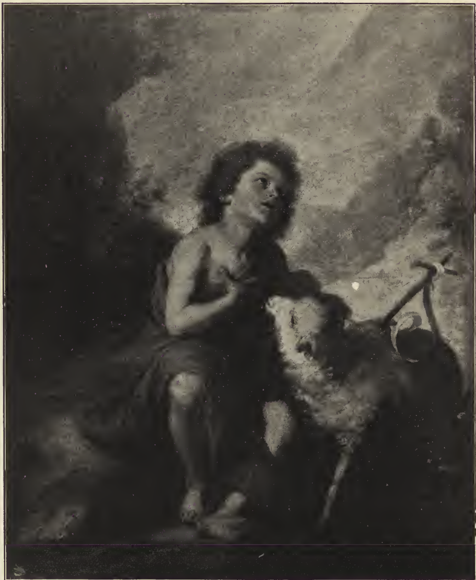
Abb. 20. Das Kind Johannes. Im Museum des Prado zu Madrid.

deren dunkles Grau mit dem der Wände zusammengeht; die Wolke öffnet sich, ihr Inneres ist hellgoldiges Licht, und in dem hellsten, strahlenden Lichtkern zeigt sich, selbst eine Lichtgestalt, das Jesuskind. Engelscharen umgeben das Kind in weitem Kreise, allerliebste Kinderengel, die im Lichtmeer schwimmen, sich auf den silbergrauen beleuchteten Innenrändern der Wolke umher-