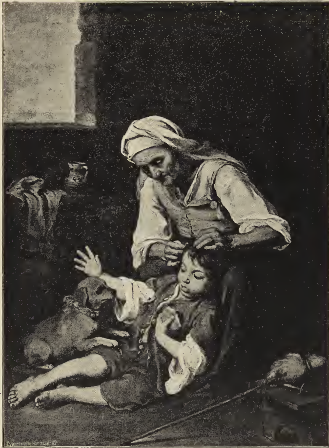
Abb. 17. Die Kopfreinigung. In der königl. Pinakothek zu München. (Nach ein Originalphotographie von Frau J. Hauskängl in München.)

rand dem Hervortreten naher Sonne, erscheint den kleinen Hirten und wirft auf das blühende Fleisch, das blaßviolette Röschchen und die bräunlich-weiße Wolle des Lammes einen lichtgoldigen Schein, daß die Lichter sich hell abheben von dem blauen, weißbewölkten Himmel (Abb. 21). Hier ist göttliche Ruhe, die noch mehr hervorgehoben wird durch den Gegensatz der Erregung in dem Bilde des Vorläufers. Der kleine Johannes, bekleidet mit einem bräunlichen Fleeß und rotem Überwurf, kniet in einer wilden Landschaft, in einer Felseneinöde, deren braunes Gestein sich in der Ferne in kahler, grauer Kette fortsetzt. Er berührt mit der einen Hand, die einen Kreuzesstab hält, ein Lamm, dessen sinnbildliche Bedeutung das an dem Stab befestigte Schrift-