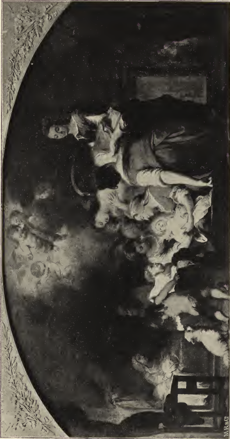
Abb. 22. Die Geburt Marias. Im Souverainmuseum zu Paris.