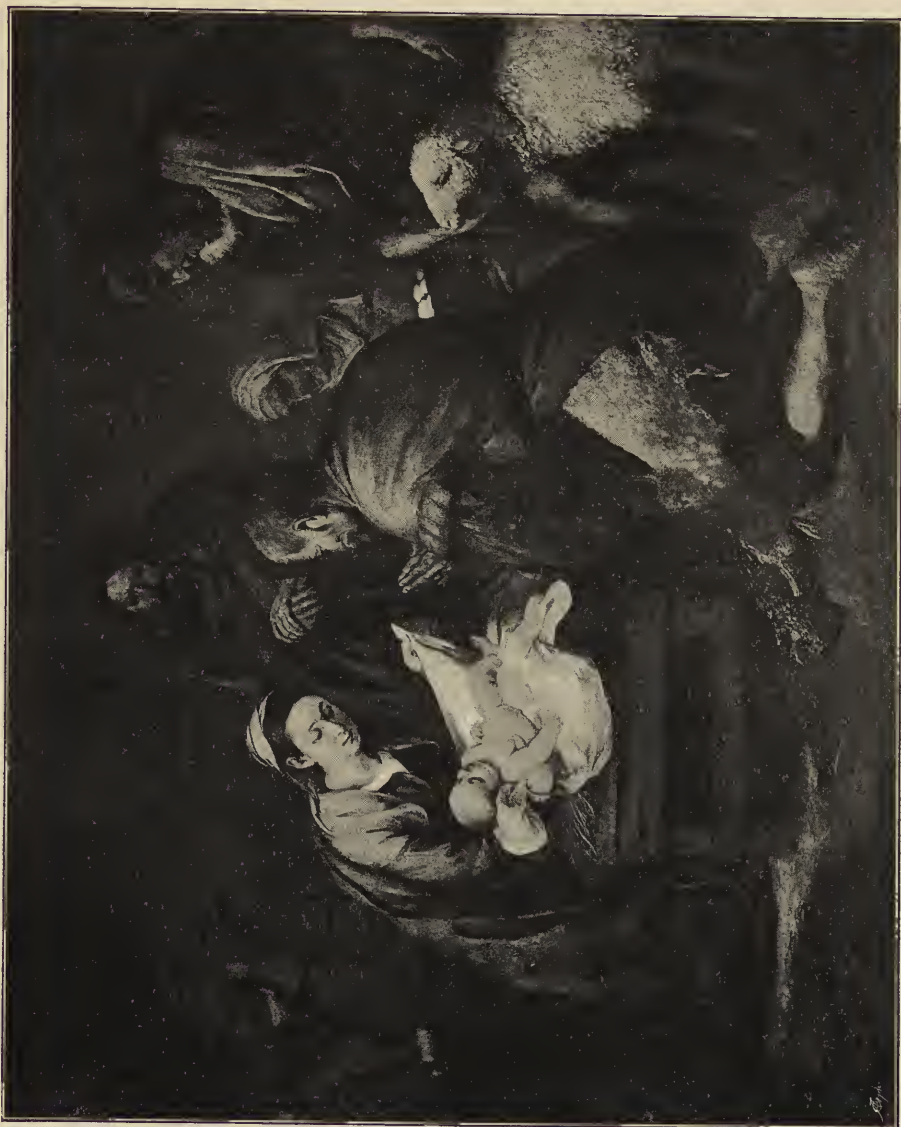
Abb. 8. Die Anbetung der Hirten. Im Museum des Prado zu Madrid.

in vorherrschend bräunlichen Tönen, die sich im Hintergrund zum Schwärzlichen vertiefen; darin stehen das rote Kleid und der grüne Mantel Marias als kräftige Farben, und der feine Kopf der Jungfrau, deren