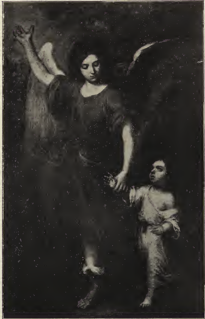
Abb. 36. Der Erzengel Raphael als Schutzengel. Vom Hauptaltar der Kapuzinerkirche, jetzt in einer Sakristei der Kathedrale zu Sevilla.

ten, ging aus seiner Anregung hervor. Er fand seinen Tod in einem Liebeswerke. Bei der Rettung eines Ertrinkenden aus dem