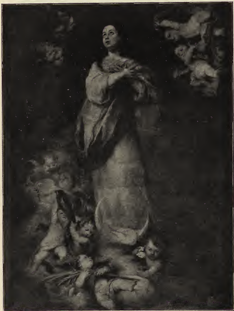
Abb. 44. Die unbefleckte Empfängnis. Aus der Kapuzinerkirche, jetzt im Museum zu Sevilla.