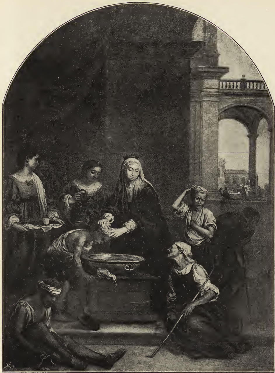
Abb. 31. Die heilige Elisabeth die Kranken pflegend.

Gemälde aus der Kirche des Hospitals de la Caridad zu Sevilla, in der Akademie San Fernando zu Madrid.