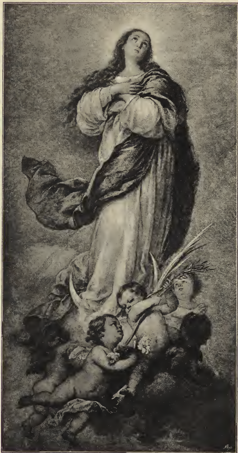
Abb. 60. Die unbefleckte Empfängnis. Im Prado-Museum zu Madrid.