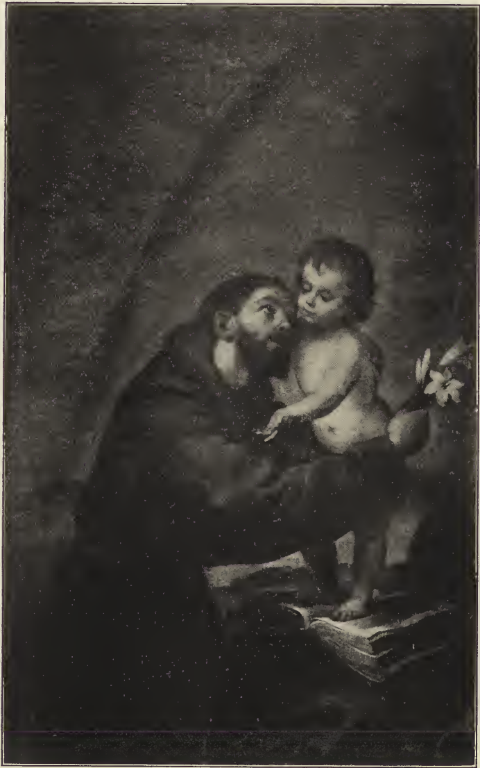
Abb. 40. Der heilige Antonius von Padua mit dem Jesuskind. Vom Hauptaltar der Kapuzinerkirche, jetzt im Museum zu Sevilla.

Dabei handelte es sich um einen großen, aus einem Hauptbild und mehreren an dasselbe angeschlossenen Nebenbildern zusammen-