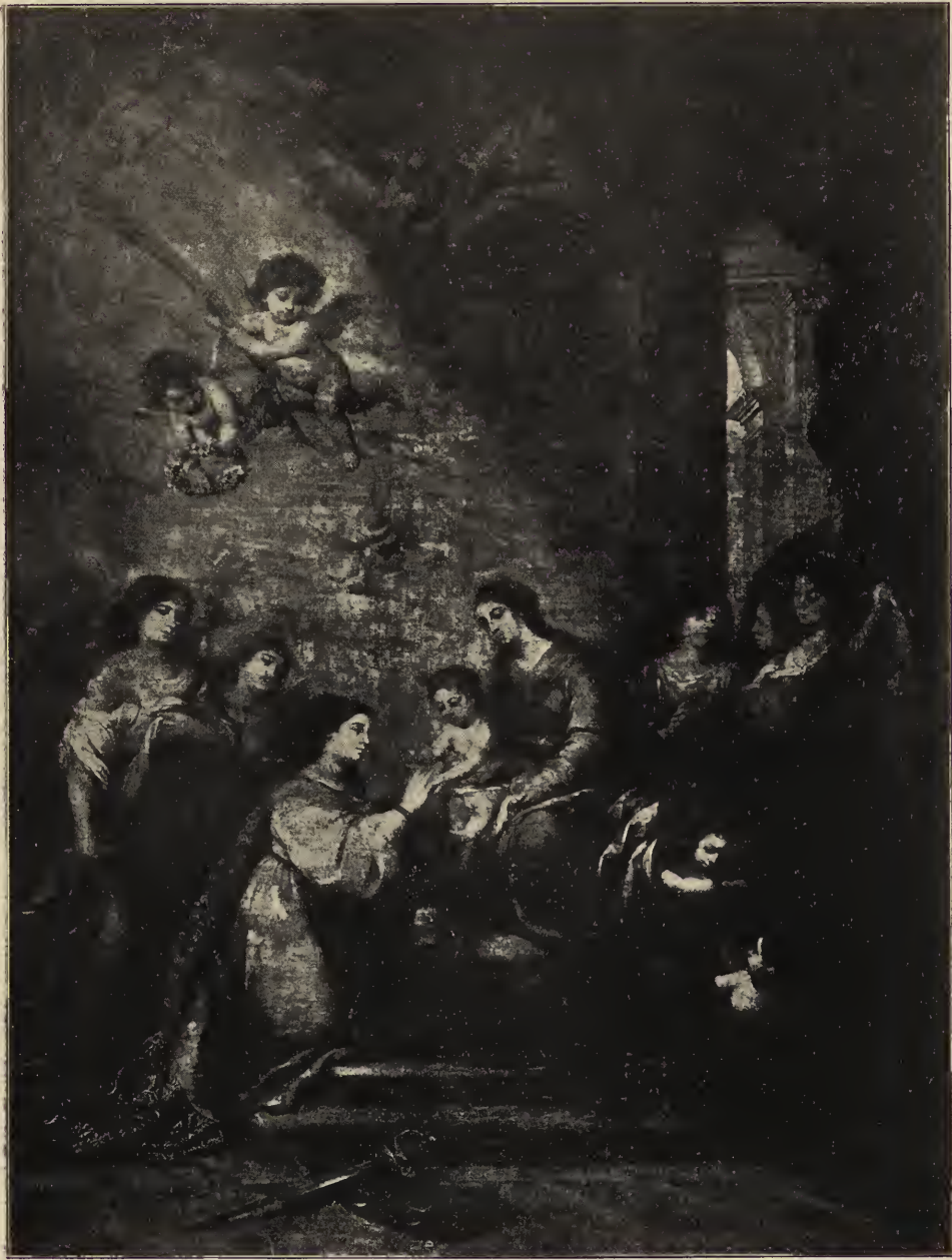
Abb. 67. Die Verlobung der heiligen Katharina.

Mittelbild des Altarwertes in der Kapuzinerkirche zu Cadix.