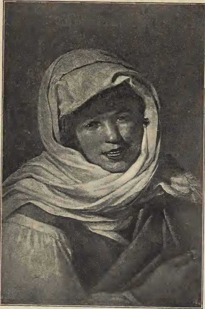
Abb. 7. Das Mädchen mit dem Geldstück. Im Prado-Museum zu Madrid.

runden Schulter dem Beschauer entgegen, und man könnte bedauern, daß das große weiße Tuch und die über das rotbraune Nieder geschlagene graue Decke die Umrisse der Gestalt so vollständig verbergen. Dem in fester und gediegener Malerei sorgfältig ausgeführten Kopf ist eine flüchtig gemalte Hand hinzugefügt, die ein blankes Silberstück hält: eine äußerliche Begründung des lachenden Ausdrucks, durch die der Maler seine fleißige Studie zu einem verwertbaren Bild gemacht hat (Abb. 7).