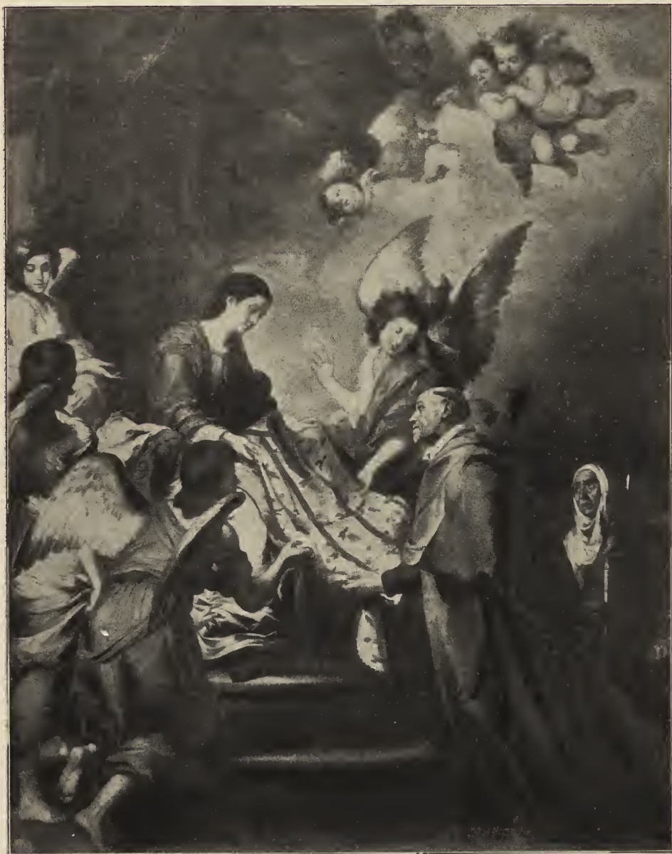
Abb. 52. Der heilige Idefons.

umwendet, da ein aus den Himmelschören leicht die großartigste unter den vielen herabgestiegenes Engelkind seine Schulter Farbendichtungen Murillos, welche ein Hin-