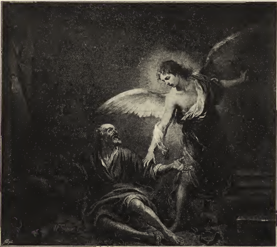
Abb. 35. Die Befreiung des heiligen Petrus.

Das der Hospitalkirche erhalten gebliebene Gegenstück zu dem Altarbild der heiligen Elisabeth ist einem Helden der Nächstenliebe gewidmet, der in Spanien thätig war und der so viel Gutes wirkte, daß schon die Mitwelt zu seinem Namen Johannes den Beisatz „von Gott“ hinzufügte. Der heilige Johannes von Gott — mit diesem Namen war er kurze Zeit vor der Errichtung des Hospitals de la Caridad unter die