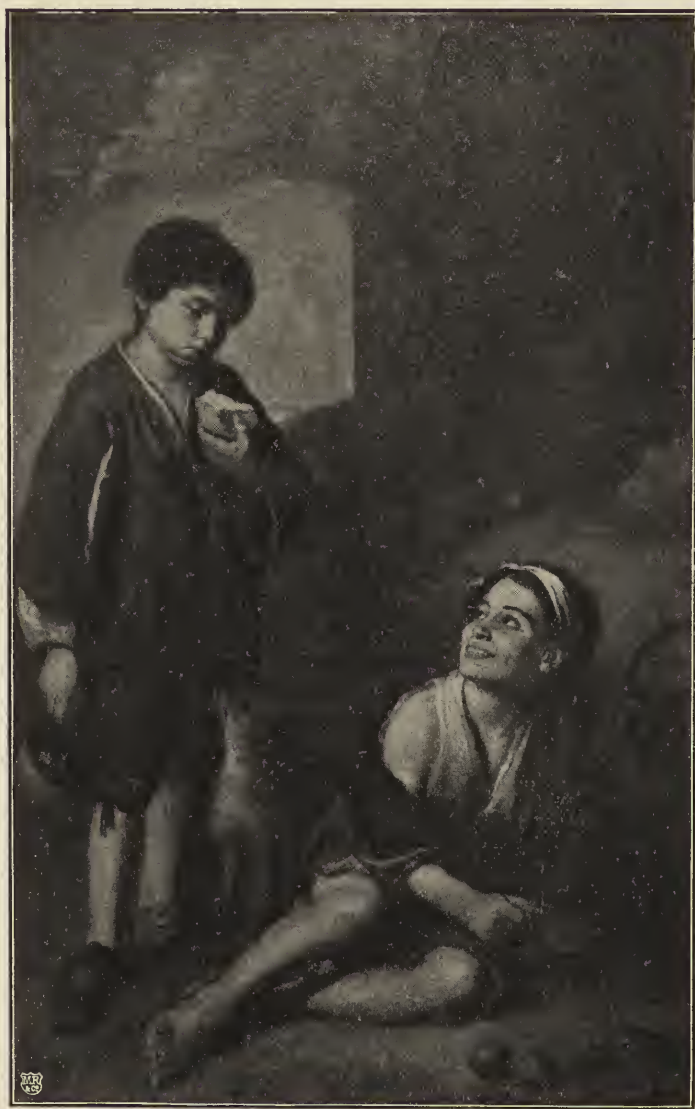
Abb. 18. Zwei Bauernjungen. In der Dulwichgalerie zu London. (Nach einer Originalphotographie von Gray & Davies in Bathwater.)

er, als ihm im Jahre 1655 der Auftrag zu teil wurde, ein großes Gemälde für die Kathedrale seiner Vaterstadt auszuführen. Dieses prächtige Bild, das die Geburt Marias darstellt, in einer Auffassung, die ganz Murillos besonderster Eigenart entspricht, ist in der Franzosenzeit entführt worden und befindet sich jetzt im Louvre (Abb. 22). Es ist ein wunderbares Werk; ein duftiger, farbiger Lichtzauber. In der Mitte des langgestreckten Bildes ist ganz im Vordergrund das neugeborene Kind