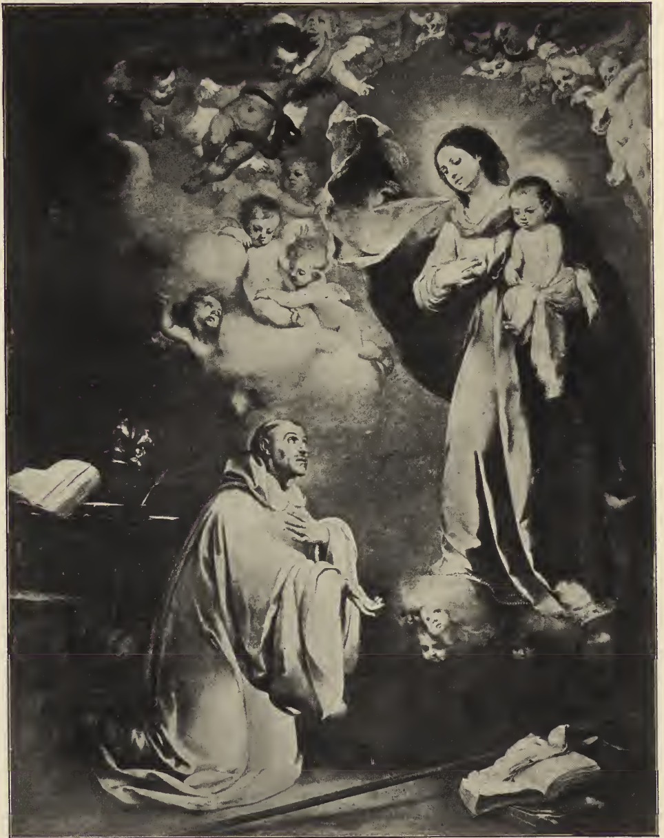
Abb. 51. Der heilige Bernhard von Clairvaux. Im Museum des Prado zu Madrid.

Augustinus erscheint als ein schwarzbärtiger und schwarzlockiger Mann in schwarzer | Gegensatz verschärft zwischen dem irdischen Wirklichen und den himmlischen Gesichten.