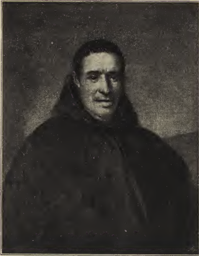
Abb. 53. Bildnis des Vaters Cavanillas. Im Pradomuseum zu Madrid.