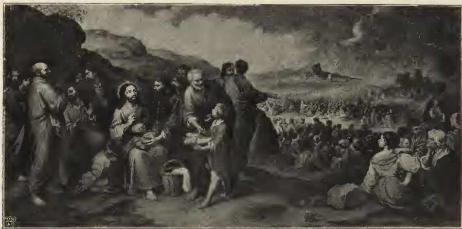
Abb. 33. Die Speisung der Fünftausend. In der Kirche des Hospitals de la Caridad zu Sevilla. (Nach einer Originalphotographie von J. Laurent & Cie. in Madrid.)

von der Heiligthuerei, die den Kirchenbildern unserer Zeit eigen zu sein pflegt. Die Ruhe der Heiligen wirkt auch auf die sie bedienenden Hofdamen hinüber, obgleich die eine derselben es doch nicht vermeiden kann, den Kopf ein wenig zur Seite zu wenden. Eine alte Hofmeisterin, die weiter zurück im Schatten steht, scheint das Thun ihrer jungen Herrin zwar sehr entschieden zu mißbilligen, aber sie wagt doch nichts zu sagen. Das ist alles ganz einfach, ganz natürlich. Wie in der Auffassung, so ist auch in der malerischen Erscheinung das vollständig gelungene Vermeiden von allem, was wie Absichtlichkeit aussehen könnte, die hervorstechendste Eigenschaft dieses Bildes. Was vom malerischen Gesichtspunkte aus zuerst und am meisten an demselben überrascht,