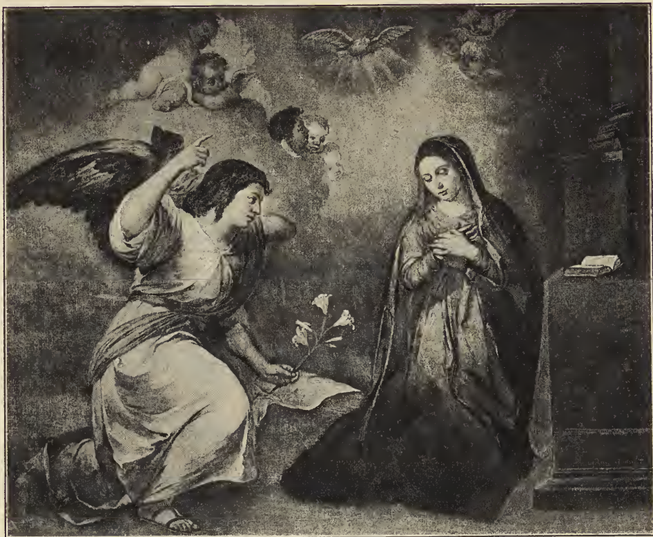
Abb. 9. Mariä Verkündigung. Im Museum des Prado zu Madrid.

gewissen Mangel an künstlerischer Unmittelbarkeit; das etwas trocken gemalte Bild macht den Eindruck des „Komponierten“. Bei den Figuren der Hirten ist Murillo noch nicht darauf gekommen, frei in das Leben hineinzugreifen und solche Hirten, wie sie die Wirklichkeit ihm zeigte, zu malen, sondern er hat sich hier mehr nach der Art und Weise gerichtet, wie Ribera — an dessen Auffassung überhaupt das ganze Bild ein wenig erinnert — diese Gestalten zu bilden pflegte.