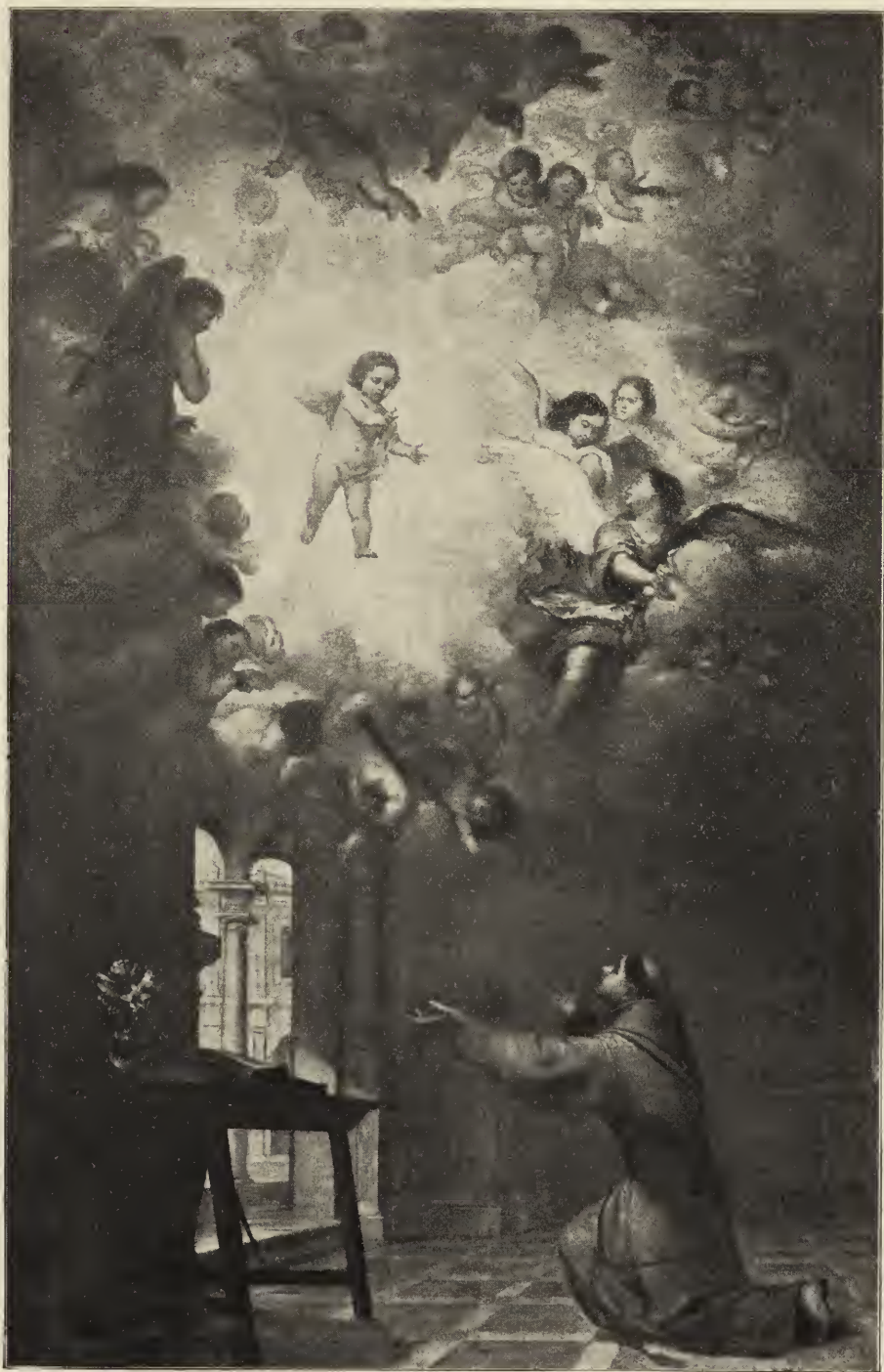
Abb. 24. Das Jesustind erscheint dem heiligen Antonius von Padua. Altargemälde in der Kathedrale zu Sevilla.