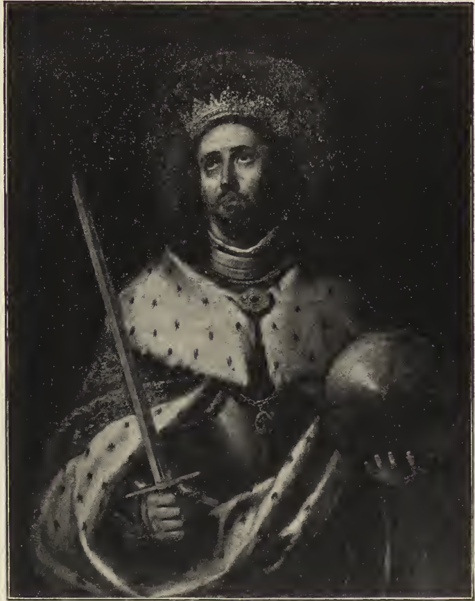
Abb. 27. Der heilige Ferdinand. Im Kapitelsaale der Kathedrale von Sevilla.

allgemein verständliches Sinnbild, welches die Keinheit bezeichnet — wie eine Lilie oder einen Spiegel —, in den Händen hält, so ist das nur eine ganz nebensächliche Beigabe, der keine wesentliche Bedeutung mehr beigelegt wird. — Murillo hat diese Darstellungsform nicht geschaffen; aber er hat sie mit der größten Vollkommenheit ausgestaltet. Keiner hat so wie er in der Gestalt der betenden Jungfrau selber die Keinheit zu verkörpern gewußt. Jedes von seinen Bildern der unbefleckten Empfängnis trägt mit vollem Recht den Namen, mit dem der Spanier die Darstellung dieses Geheimnisses zu bezeichnen pflegt; la Purissima, die Allerreinste. Und seine Farbentöne sind die wunderbarste Musik zu dem geistlichen Lobgesang von der Allerreinsten.