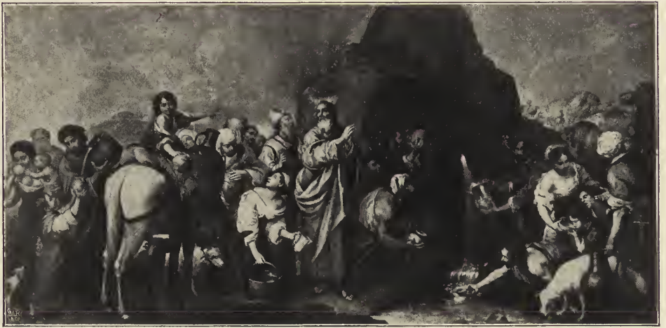
Abb. 32. Moses schlägt Wasser aus dem Felsen. In der Kirche des Hospitals de la Caridad zu Sevilla.

dem waren an zwei Seitenaltären Bilder anzubringen, welche Heilige der Nächstenliebe in der Ausübung von Liebeswerken zeigten. Dazu kamen noch ein paar kleinere Bilder. Das in Rede stehende Bild der Landgräfin Elisabeth ist eines jener beiden Altargemälde (Abb. 31). Die Darstellung bewegt sich ganz in der Welt der irdischen Dinge. Sein geliebtes Bettelvolk hat Murillo mit der nämlichen Treue aus der Wirklichkeit heraus auf die Leinwand gebracht, wie er es vor zwanzig Jahren gethan. Er hat nichts gespart, um durch die Widerlichkeit der Gebrechen, die da zu sehen sind, die Selbstverleugnung der fürstlichen