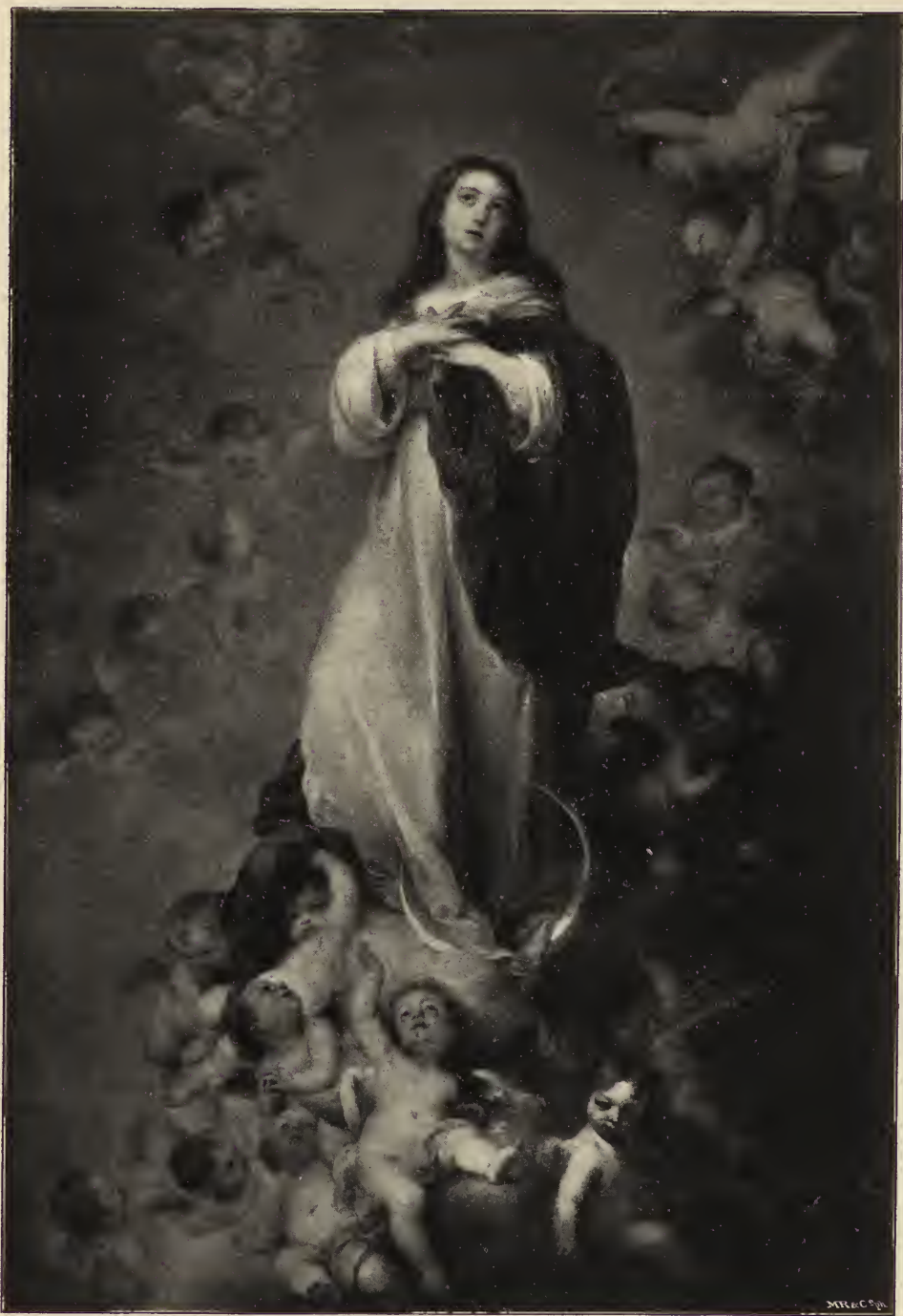
Abb. 61. Die unbefleckte Empfängnis. Im Museum des Louvre zu Paris.