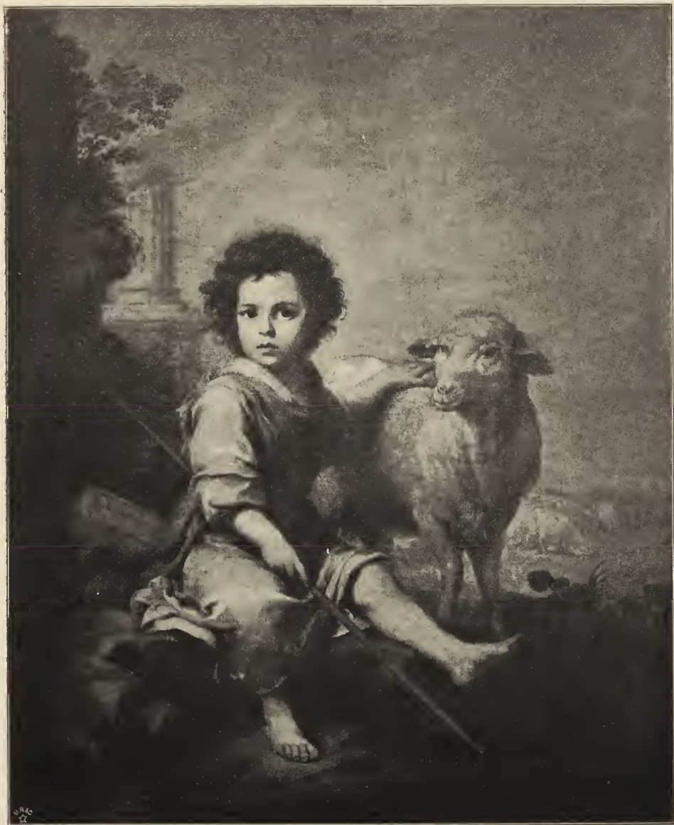
Abb. 21. Der gute Hirt. Im Museum des Prado zu Madrid.

den begnadigten Menschen, dem dieser himmlische Besuch zu teil wird. Ein Engel in gelbem Gewande, mit weißen Fittichen, ist gleichsam der Führer; seine Hand hat den Wolkenballen, der bis dahin noch zwischen dem Jesuskind und den Blicken des jungen Mönches lag, beiseite geschoben, und indem er sich umwendet, macht er dem Kind den Weg zu diesem frei. Das Kind löst sich