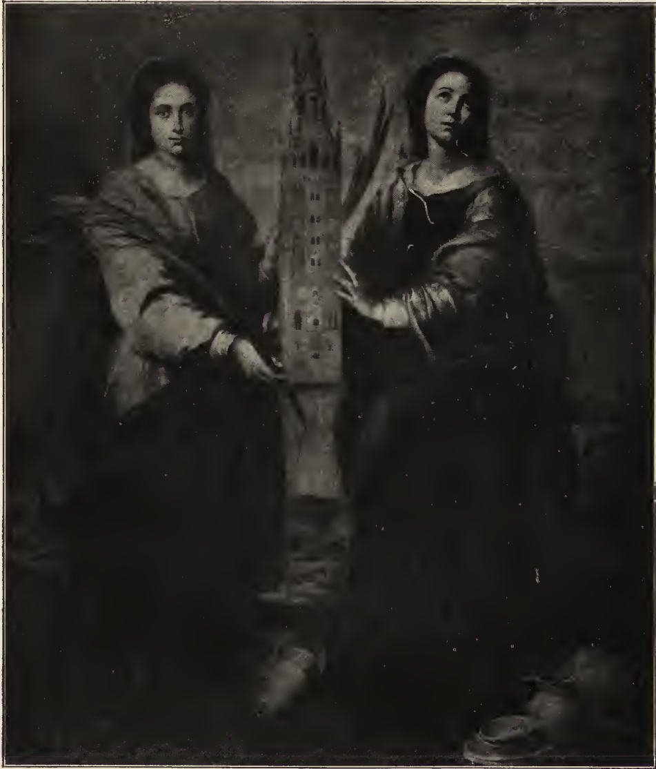
Abb. 37. Die heilige Justa und die heilige Rufina, Schutzpatroninnen von Sevilla. Vom Hauptaltar der Kapuzinerkirche, jetzt im Museum zu Sevilla.

Liebeswerkes sich verspätet und den Weg verfehlt hatte, wie durch ein Wunder der Aufrichtens würde ihn ins Wasser führen. Da tritt ein Engel ihm zur Seite, um ihn zu halten. Der Retter ist im Augenblick Gefahr eines Sturzes in den Zenit ent-