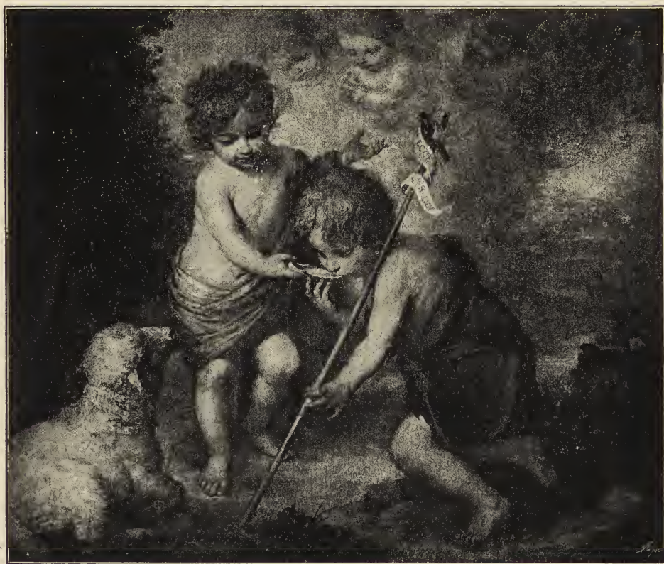
Abb. 57. Die Kinder Jesus und Johannes. Im Prado-Museum zu Madrid.

Ton der Wolke; der Kopf Marias hebt sich mit seinem blonden Haar gegen einen bläulich-weißen leuchtenden Strahlenschein ab. Ähnlich wie in jenem Bild aus der Franziskanerkirche zu Sevilla geht ein Zug der Aufwärtsbewegung durch das Bild. Aber nicht auf göttliche Hoheit, sondern auf die Entfaltung der höchsten Anmut und Gold-