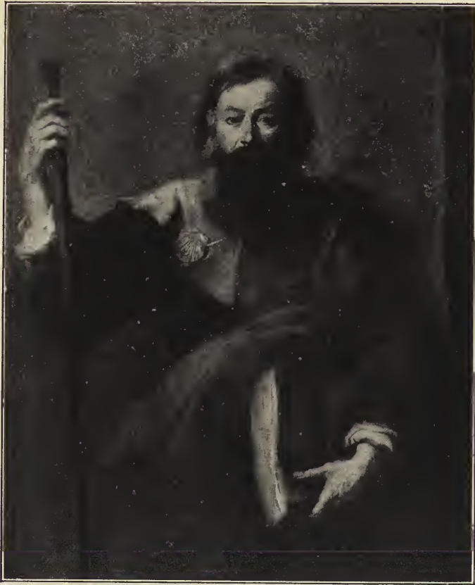
Abb. 49. Der Apostel Jakobus der Ältere. Im Museum des Prado zu Madrid.