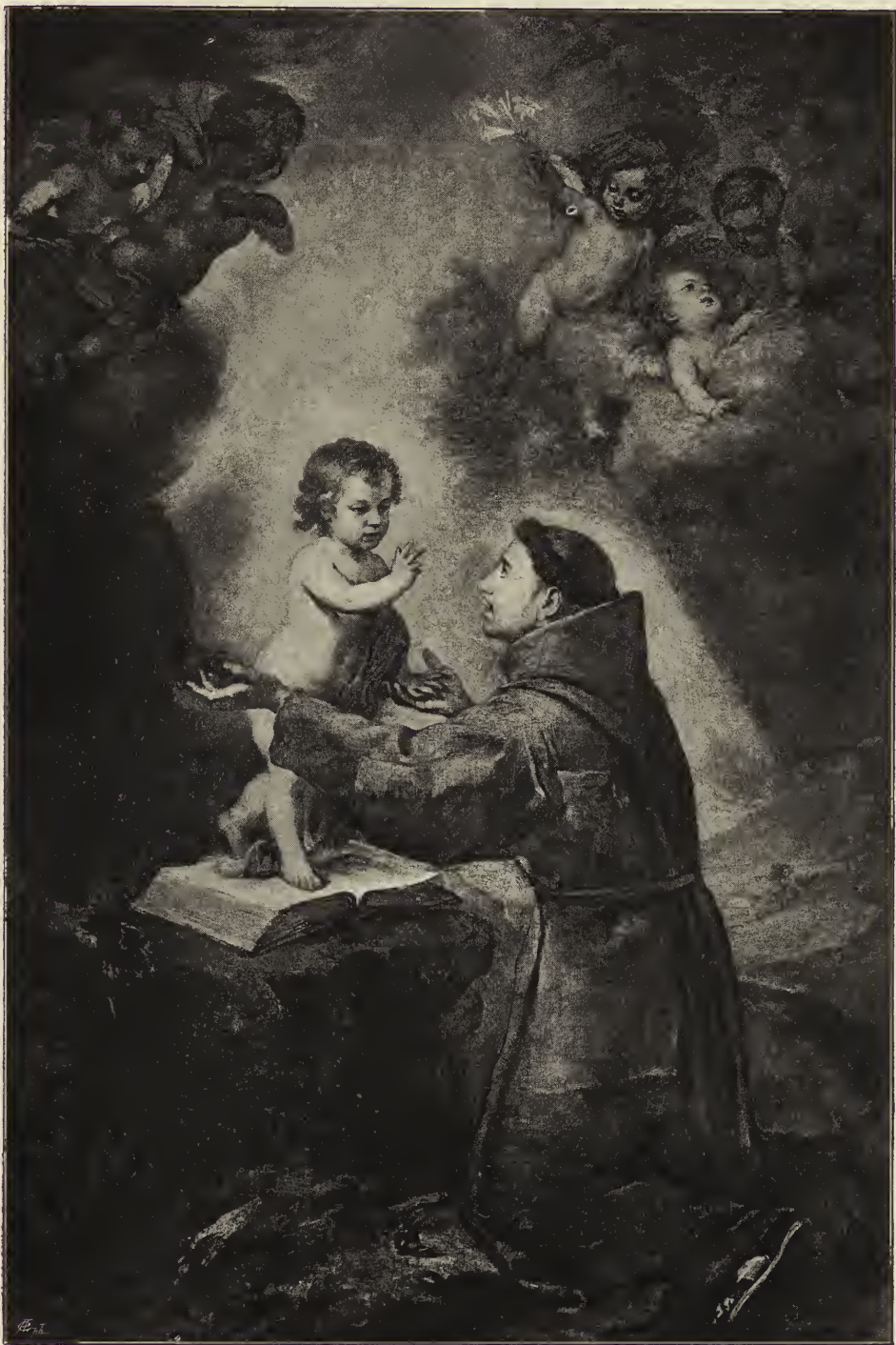
Abb. 25. Das Jesuskind erscheint dem heiligen Antonius. Im Ermitagemuseum zu Petersburg.