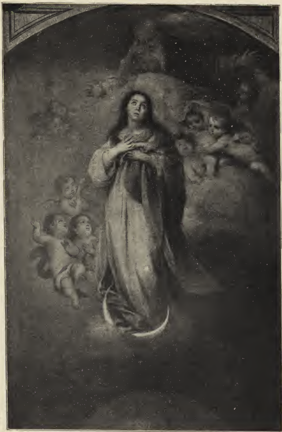
Abb. 45. Die unbefleckte Empfängnis. Altargemälde aus der Kapuzinerkirche, jetzt im Museum zu Sevilla.