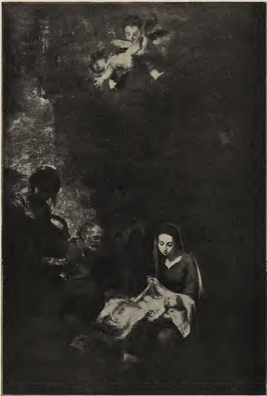
Abb. 43. Die heilige Nacht. Altargemälde aus der Kapuzinerkirche, jetzt im Museum zu Sevilla.