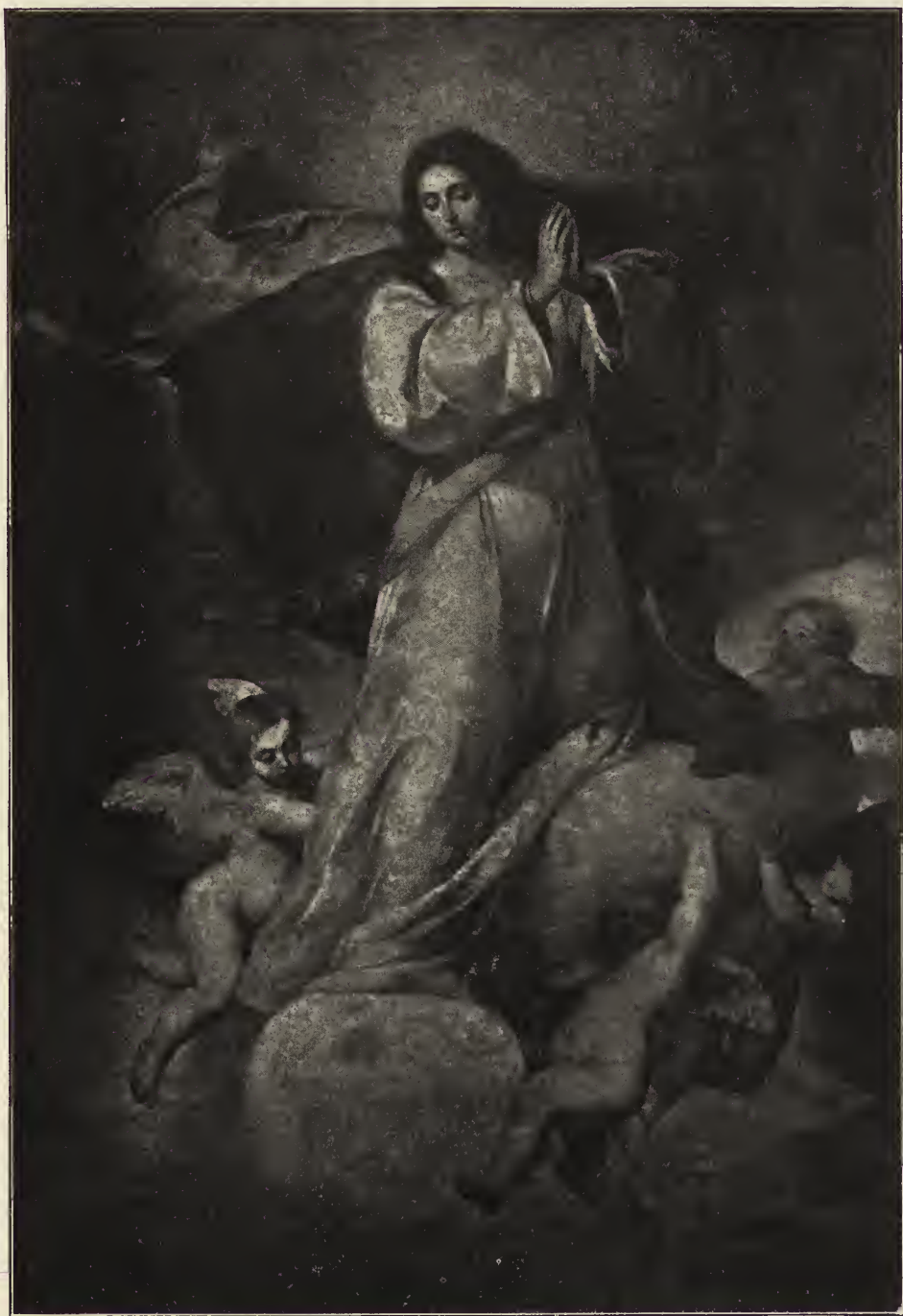
Abb. 28. Die unbefleckte Empfängnis. Altargemälde aus dem großen Franziskanerkloster zu Sevilla; jetzt im Museum zu Sevilla.