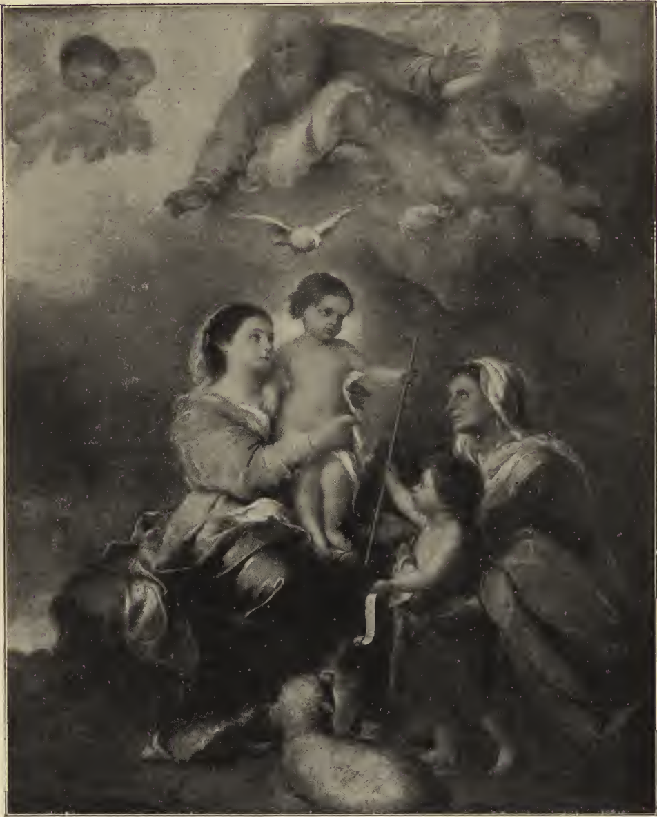
Abb. 62. Jesus und Maria mit Elisabeth und Johannes. Im Museum des Louvre zu Paris.

römische Cäsaren abenteuerliche Summen aufwendeten, um die alten Meisterwerke hellenischer Kunst aus dem Besitz griechischer freilich schon zweimal noch höhere Preise bezahlt worden (für Meissoniers Kirassiere und Millets Abendläuten).