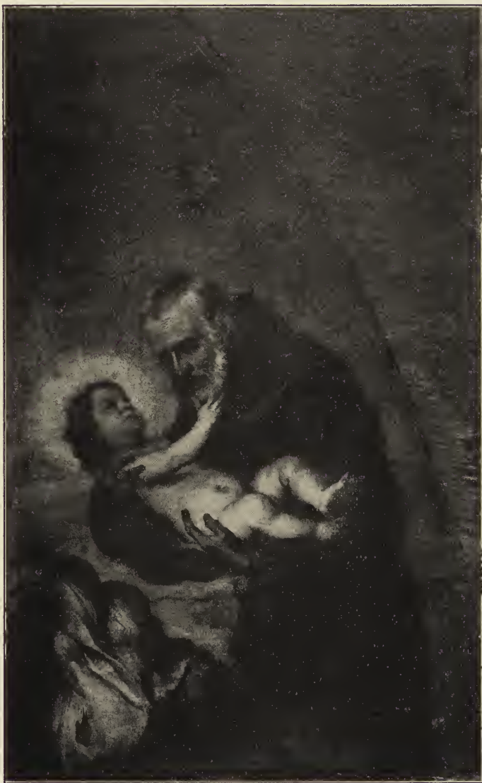
Abb. 41. Der heilige Feltz von Cantalicio mit dem Jesuskind. Vom Hauptaltar der Kapuzinerkirche, jetzt im Museum zu Sevilla.

In diesen Werken hat Murillo sein Bestes gegeben. Man muß das Provinzialmuseum zu Sevilla, wo die Mehrzahl der annähernd den Eindruck von der Größe seiner Meisterschaft wie hier.*) Von den Bildern aus der Kapuziner-