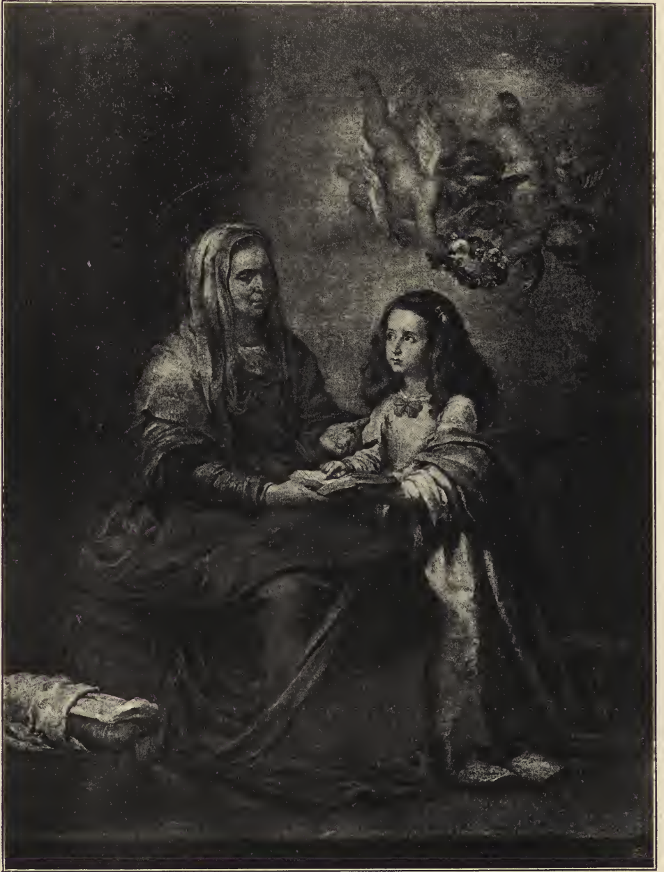
Abb. 56. Die heilige Anna mit der Jungfrau Maria. Im Prado-Museum zu Madrid.

in eine Halbfigur von den sonstigen Darstellungen ab; der Kopf, mit sehr heller, mäßig kräftigen Farben gehalten ist, zeigt