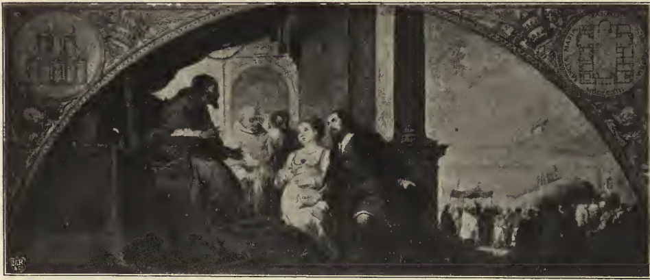
Abb. 30. Der Patrizier Johannes vor dem Papst und die Gründung der Kirche Santa Maria ad nives in Rom. Gemalt für die Kirche Santa Maria la Blanca in Sevilla; jetzt in der Akademie San Fernando zu Madrid.

schen Zeitgenossen Rembrandt erinnert; aber der Unterschied ist der, daß die mächtige Lichtwirkung sich mit der reichsten, blühendsten Farbenpracht vereinigt, mit einer Farbenpracht, die derjenigen der großen Venezianer des XVI. Jahrhunderts nicht nachsteht. — Die in den beiden Gemälden behandelte römische Legende erzählt folgendes: Einem frommen Patrizier mit Namen Johannes erschien im Traum die Mutter Gottes und befohl ihm, an derjenigen Stelle der Stadt eine Kirche zu bauen, wo am nächsten Morgen Schnee liegen würde. Auf Bureden seiner Gemahlin begab sich Johannes gleich nach Tagesanbruch zum Papst Liberius, um diesem den wunderbaren Traum zu berichten.