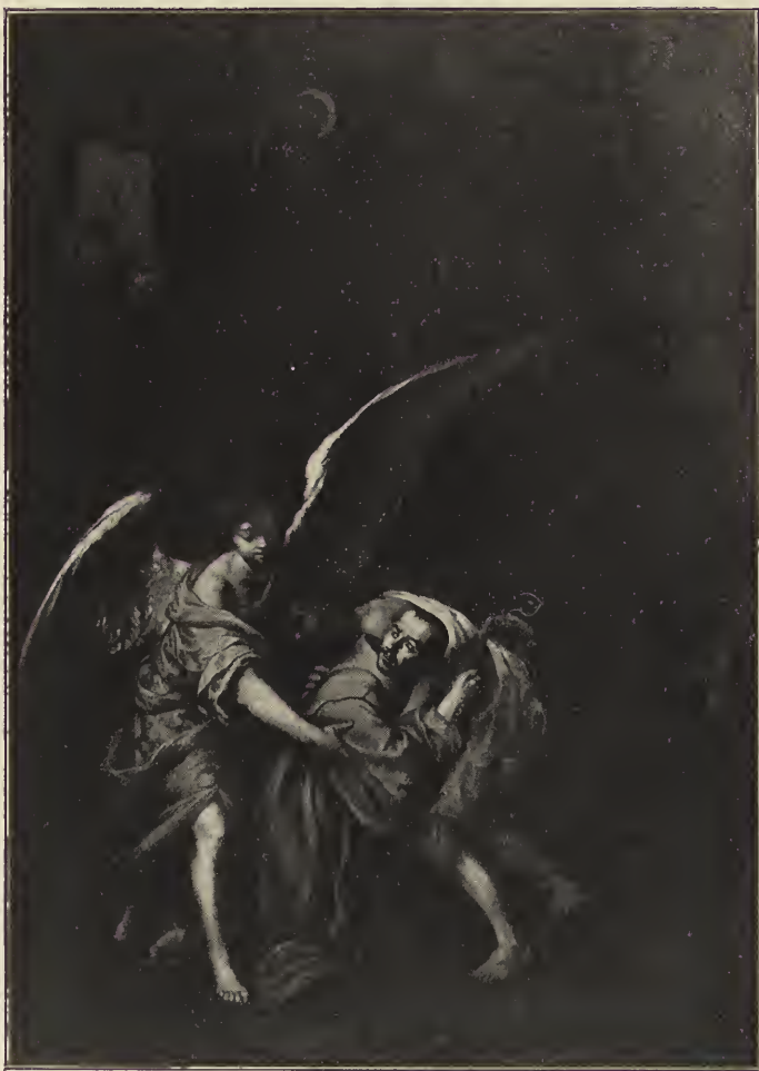
Abb. 31. Der heilige Johannes von Gott einen Kranken tragend. In der Kirche des Hospitals de la Caridad zu Sevilla. (Nach einer Originalphotographie von J. Laurent & Cie. in Madrid.)

dem Felsen, Abraham bewirtet die Engel, der Vater des verlorenen Sohns giebt diesem das beste Kleid. An der nördlichen Wand die aus den Evangelien und der Apostelgeschichte entnommenen Darstellungen des Speisens der Hungrigen, des Pflagens der Kranken, des Befreiens der Gefangenen: Christus speist die Fünftausend, er heilt den Lahmen am Teich Bethesda, der Engel des Herrn führt den Apostel Petrus aus dem Kerker. Die Verbildlichung des siebenen Barmherzigkeitswerkes, des Begrabens der Toten, kam nicht zur Ausführung, wohl nur aus Rücksichten auf die Symmetrie der Anordnung; ein gezeichneter Entwurf Murillos zu der Darstellung, wie Tobias die