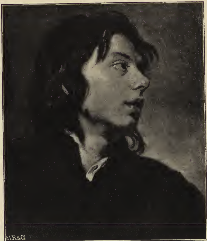
Abb. 6. Studienkopf. In der königl. Gemäldegalerie im Haag.

Kind stampft im Mörser. Ein Engelmädchen stellt die Eßnäpfe auseinander, ein anderes weiter hinten sieht am Herd nach dem kochenden Wasser. Die ganze geflügelte Gesellschaft ist so in Anspruch genommen von der ungewöhnlichen Beschäftigung, daß sie weder den in der Hinterthür der Küche erscheinenden Frater, der stumm vor Staunen die Hände spreizt, bemerken, noch auch den Prior, der in Begleitung zweier schwarzgekleideten vornehmen Herren durch die vorn am Bildrand befindliche Thür hereintritt und so Zeuge des Wunders wird. — Murillo hat die Sache in einer Weise dargestellt, als ob er selbst auch