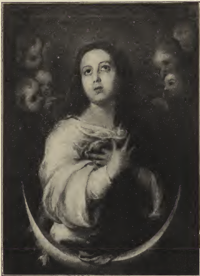
Abb. 58. Die unbefleckte Empfängnis. Im Prado-Museum zu Madrid.

In der Gestalt Marias ist hier weniger Bewegung. Die Jungfrau ist in feierlicher Ergriffenheit in die Anschauung der Gottheit verloren. Um so lebendiger ist die Bewegung in der endlosen Schar der Engeln, die sie mit festlichem Jubel umschwär-