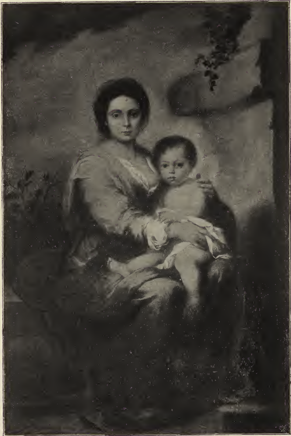
№6. 39. Madonna. In der Gemäldesammlung des Palastes Corsini zu Rom.