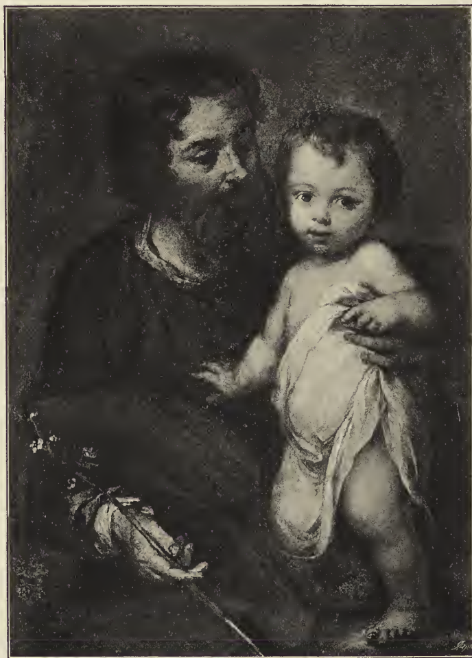
Abb. 38. Der heilige Joseph mit dem Jesuskind. Im Ermitagemuseum zu Petersburg.

In ähnlicher Wirkung als ein plötzlich im Dunkel aufflammendes Licht erscheint der Engel, welcher die Kerkerbände des heiligen Petrus löst und den Apostel von der Seite des schlafenden Wächters hinweg ins Freie