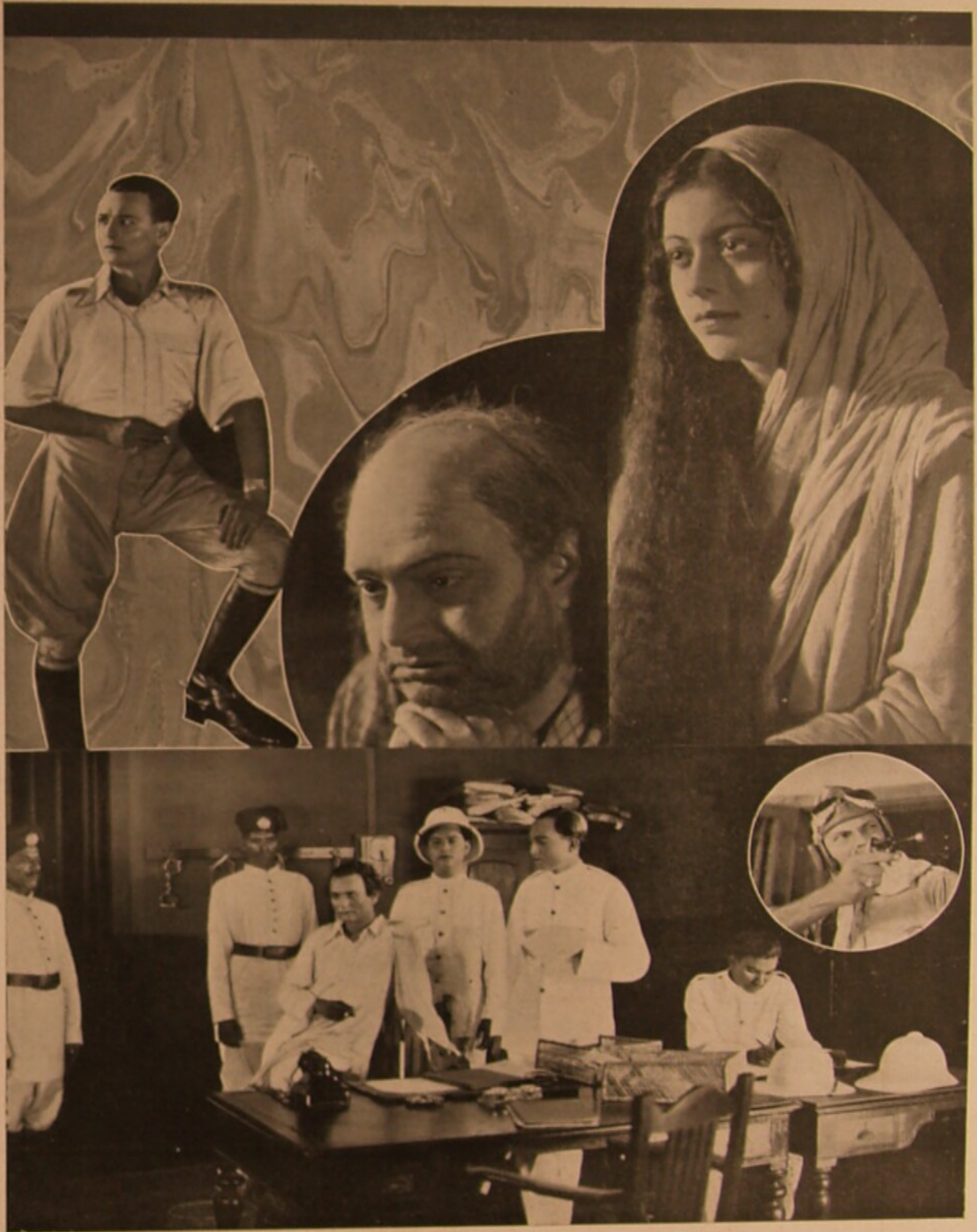
‘কর্ডহার’ চিত্রের বিভিন্ন দৃশ্যাবলী ।