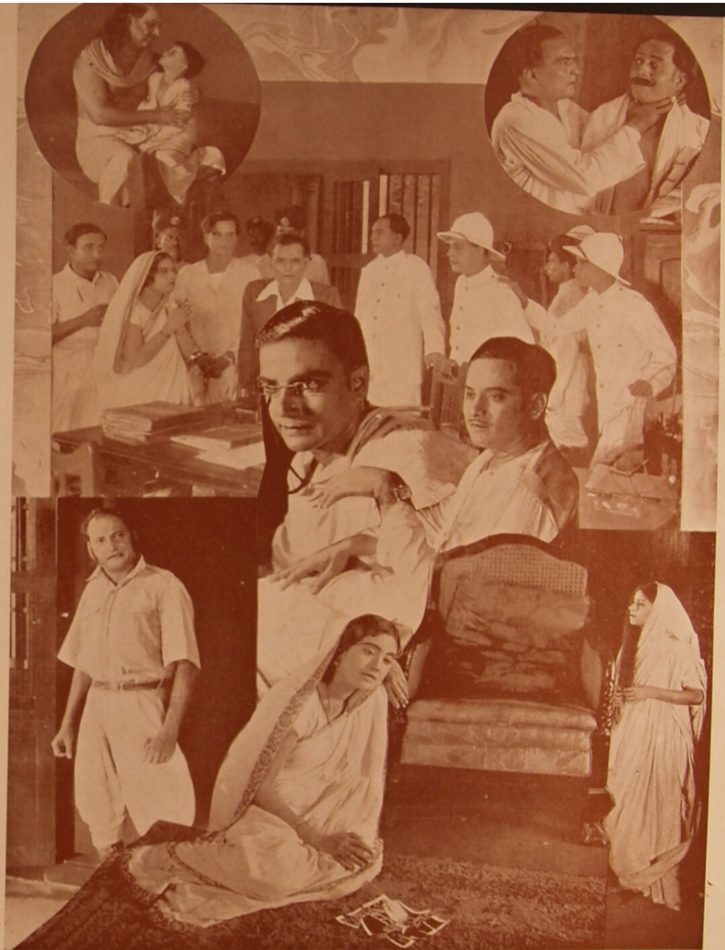
'কর্মহার' চিত্রের বিভিন্ন দৃশ্যাবলী।