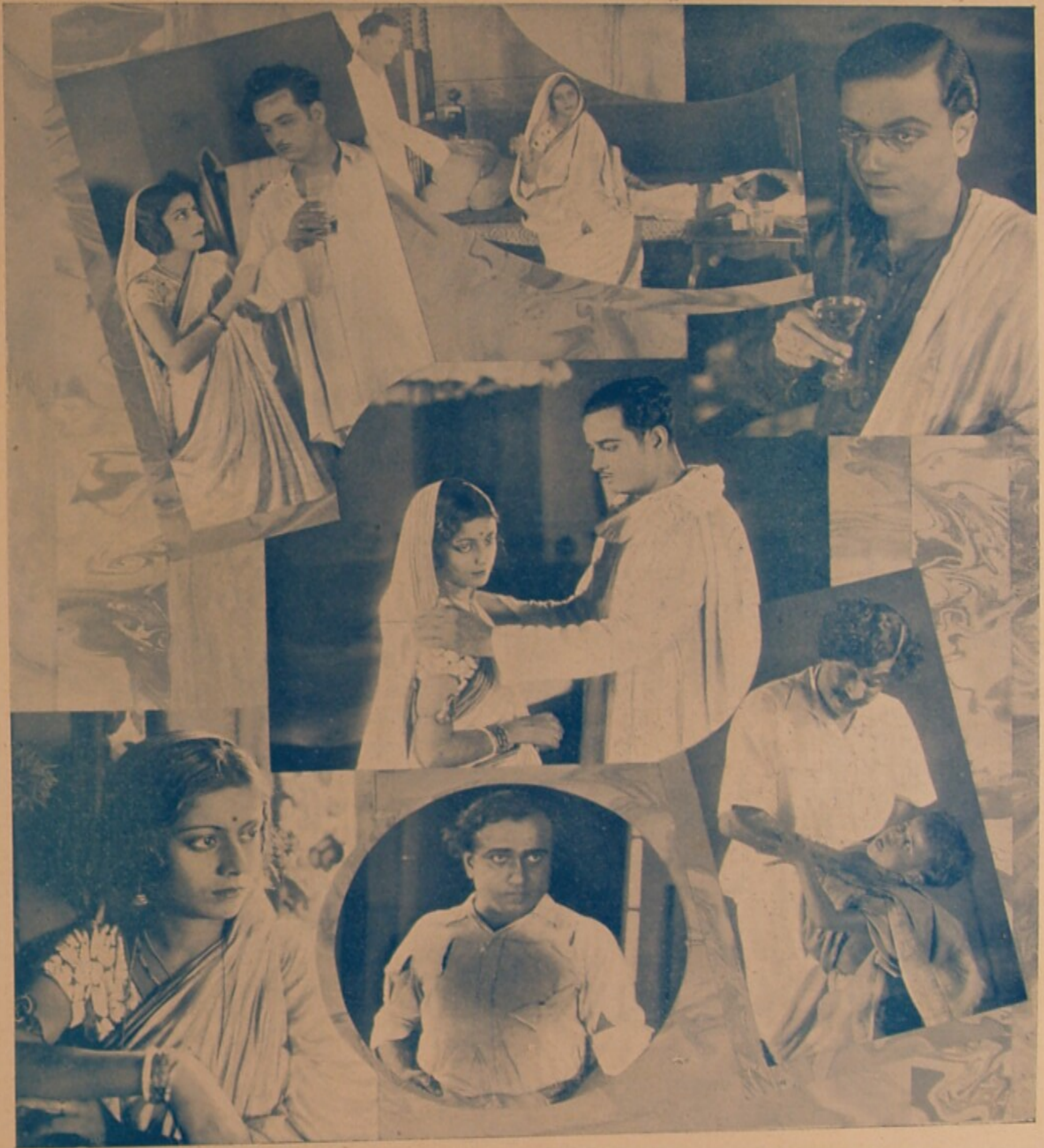
‘কঠহার’ চিত্রের বিভিন্ন দৃশ্যাবলী ।