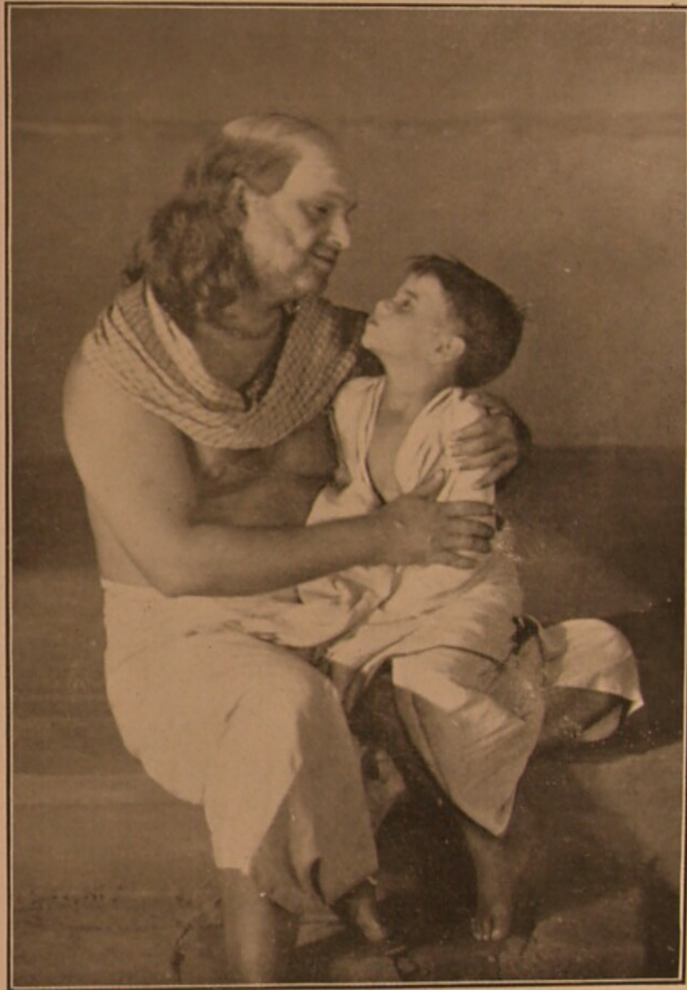
মধু ও শ্যামল