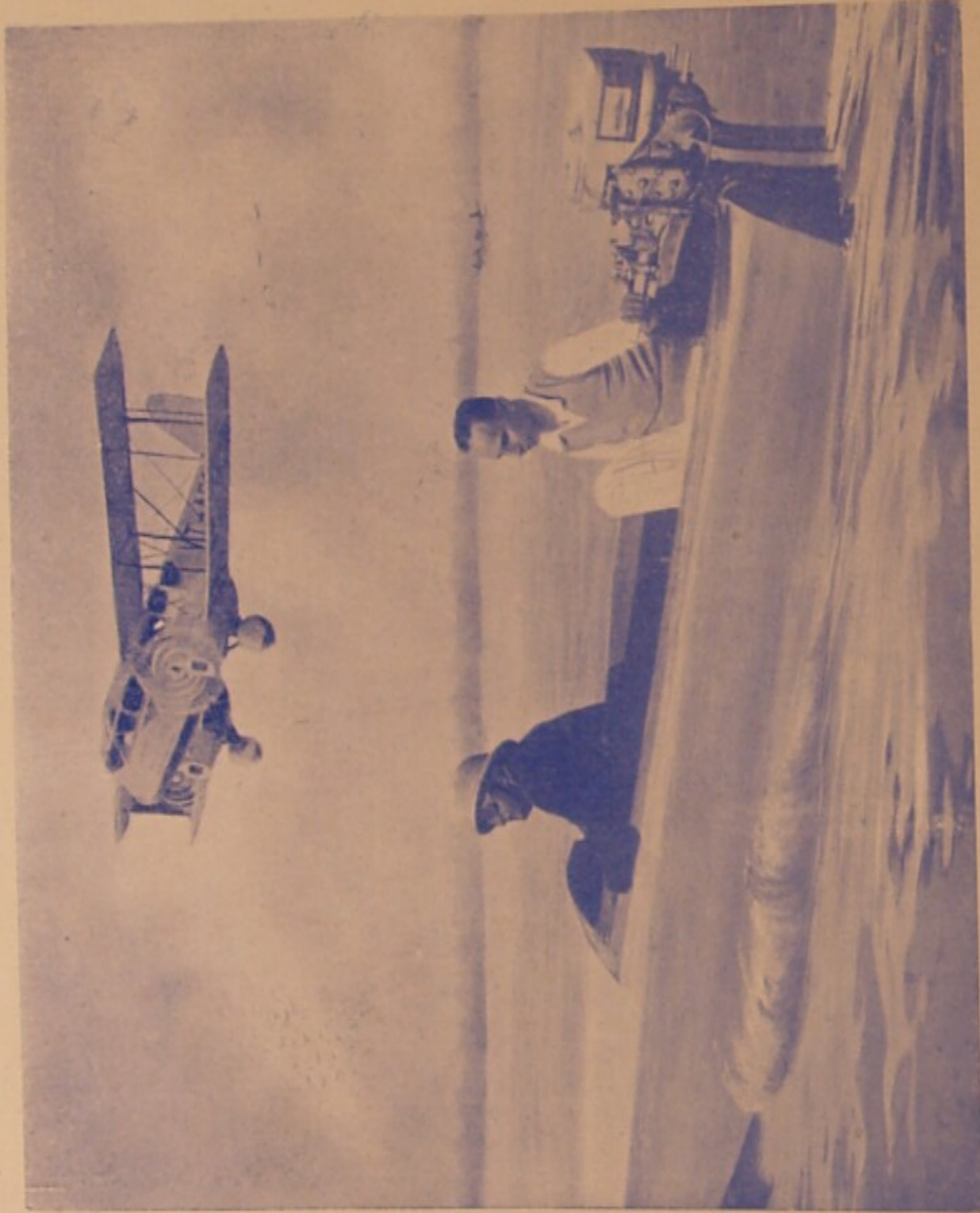
“কণ্ঠহার” সর্বক-চিত্রের —একটি দৃশ্য—