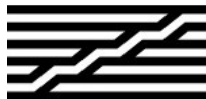
Logo du Centre Pompidou

documentaires et bibliographiques du Centre Pompidou, avec le soutien des professionnels du musée et de la bibliothèque.