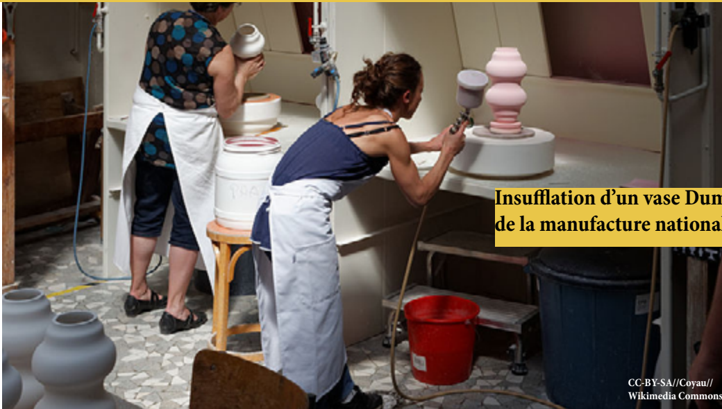
Insufflation d'un vase Dumas, à l'atelier d'Émaillage de la manufacture nationale de Sèvres.