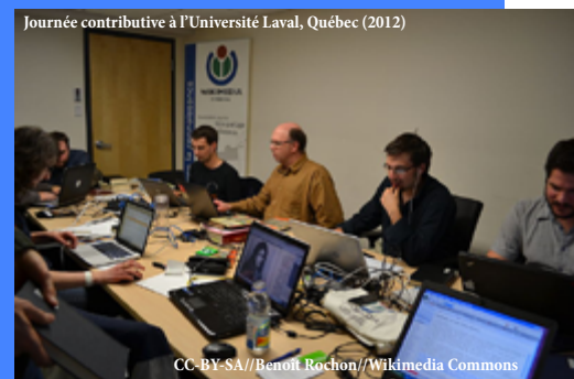
Journée contributive à l'Université Laval, Québec (2012)

Voir la page sur Wikipédia : http://fr.wikipedia.org/wiki/Wikipédia:Mois_de_la_contribution