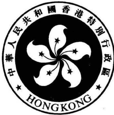
香港特别行政区区徽图案