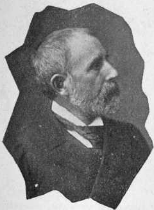
GASPAR NÚÑEZ DE ARCE