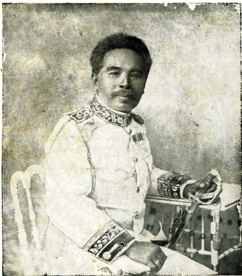
นายพลตรี พระยาวิชิตณรงค์ ( ก๊ีบ สุวรรณทัต )