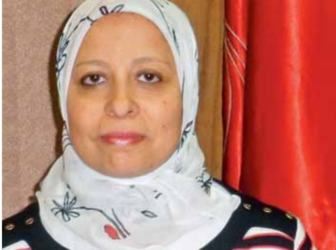
لفارس الحويلي (CC-BY-SA 3.0)

وقد تعلم الطلاب التفوق في مجالات الترجمة التخصصية ومعرفة الجوانب النظرية والعملية لهذه المجالات. لقد فهموا ضرورة تطوير مهاراتهم والمشاركة في الممارسة المتواصلة للعمل في مجموعات والتعامل مع الأدوات التكنولوجية مثل الإنترنت من أجل جمع المعلومات.