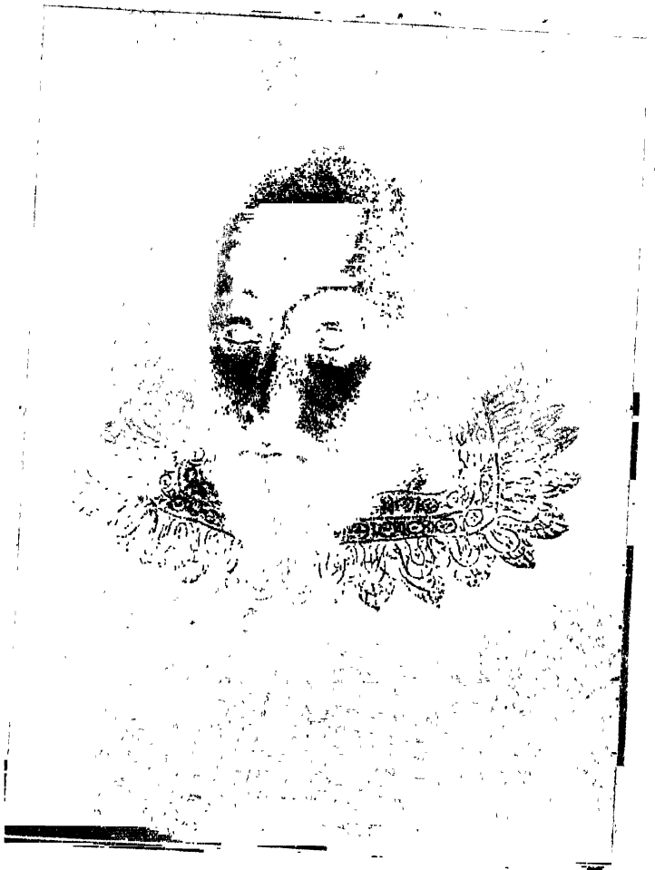
জগদ্বিখ্যাত মহাকবি সেক্সপিয়র ।