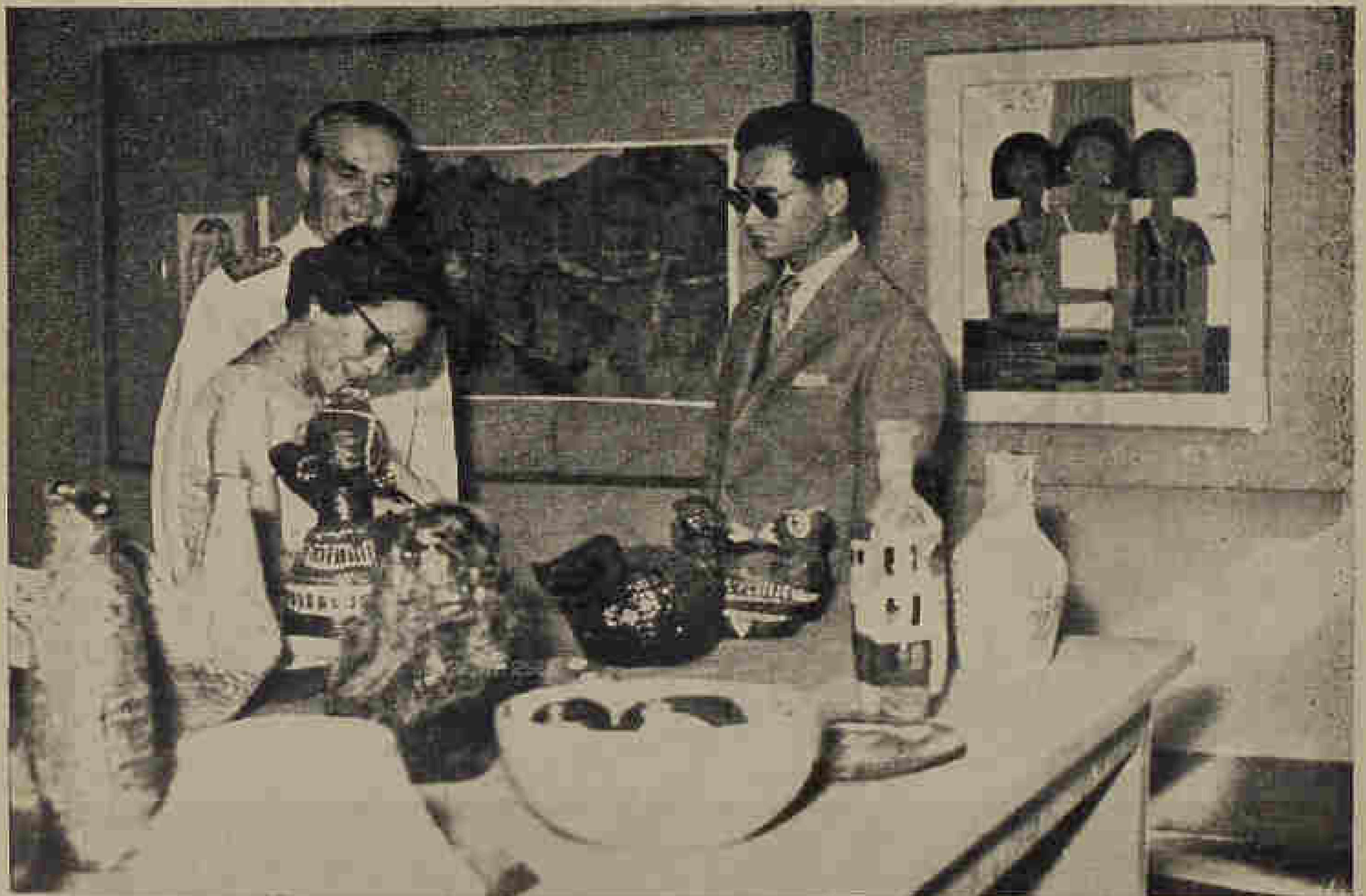
ศาสตราจารย์ ศิลป์ พีระศรี กำลังกราบทูลถวายคำอธิบายเรื่องเครื่องปั้นดินเผา His Majesty the King and H.R.H. the Princess Mother given information about ceramics by Professor Silpa Bhirasri.