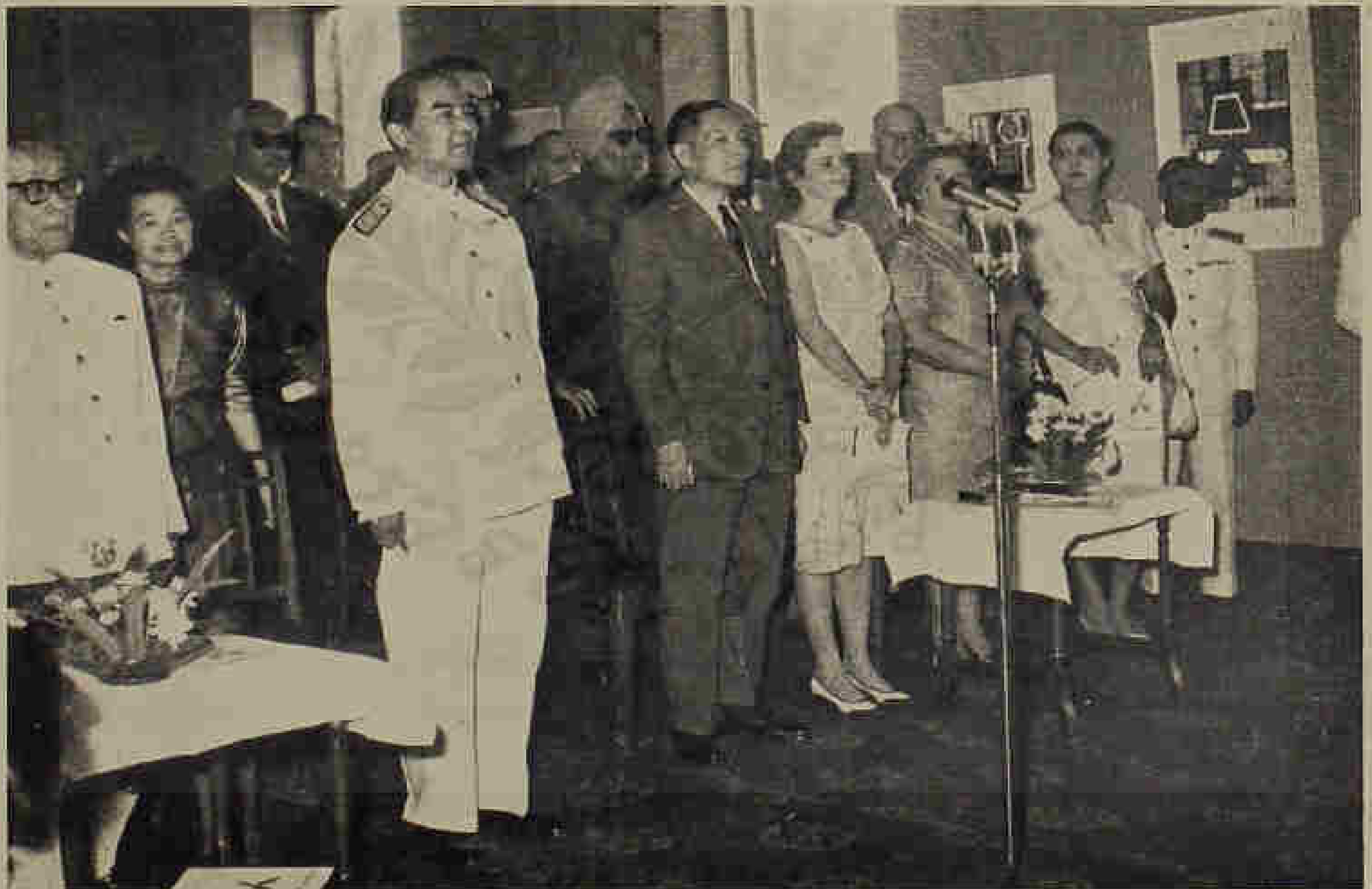
ท่านผู้มีเกียรติที่ได้รับเชิญมาในงานเปิดการแสดงศิลปกรรมแห่งชาติ ครั้งที่ ๑๓ Dignitaries present at the inauguration of the XIII National Art Exhibition.