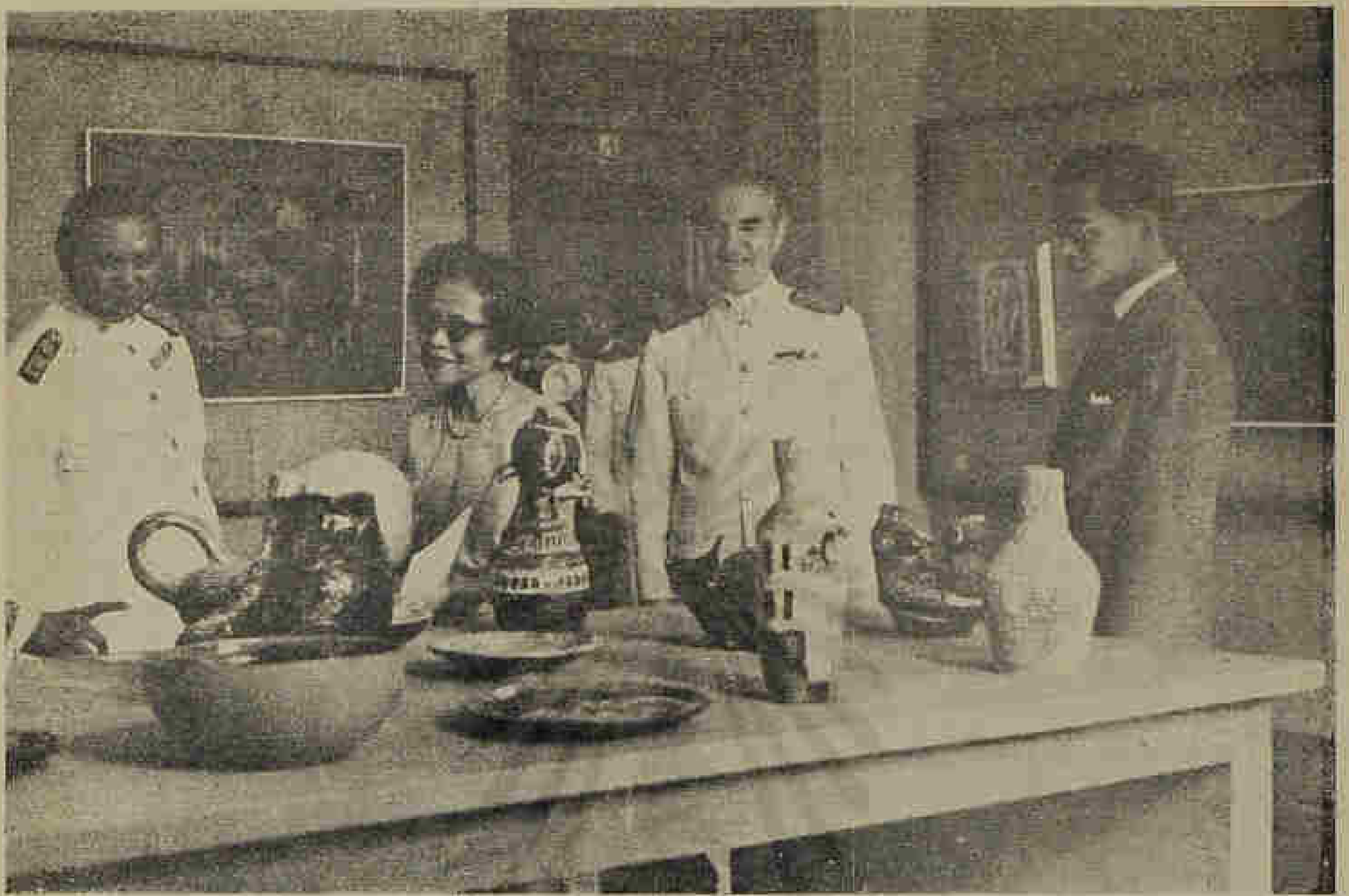
พระบาทสมเด็จพระเจ้าอยู่หัวและสมเด็จพระราชินี ทอดพระเนตรศิลปกรรม ในงานแสดงศิลปกรรมแห่งชาติ ครั้งที่ ๑๓ ณ หอศิลป์ กรมศิลปากร His Majesty the King and H.R.H. the Princess Mother at the Silpakorn Gallery on the occasion of the XIII National Art Exhibition.