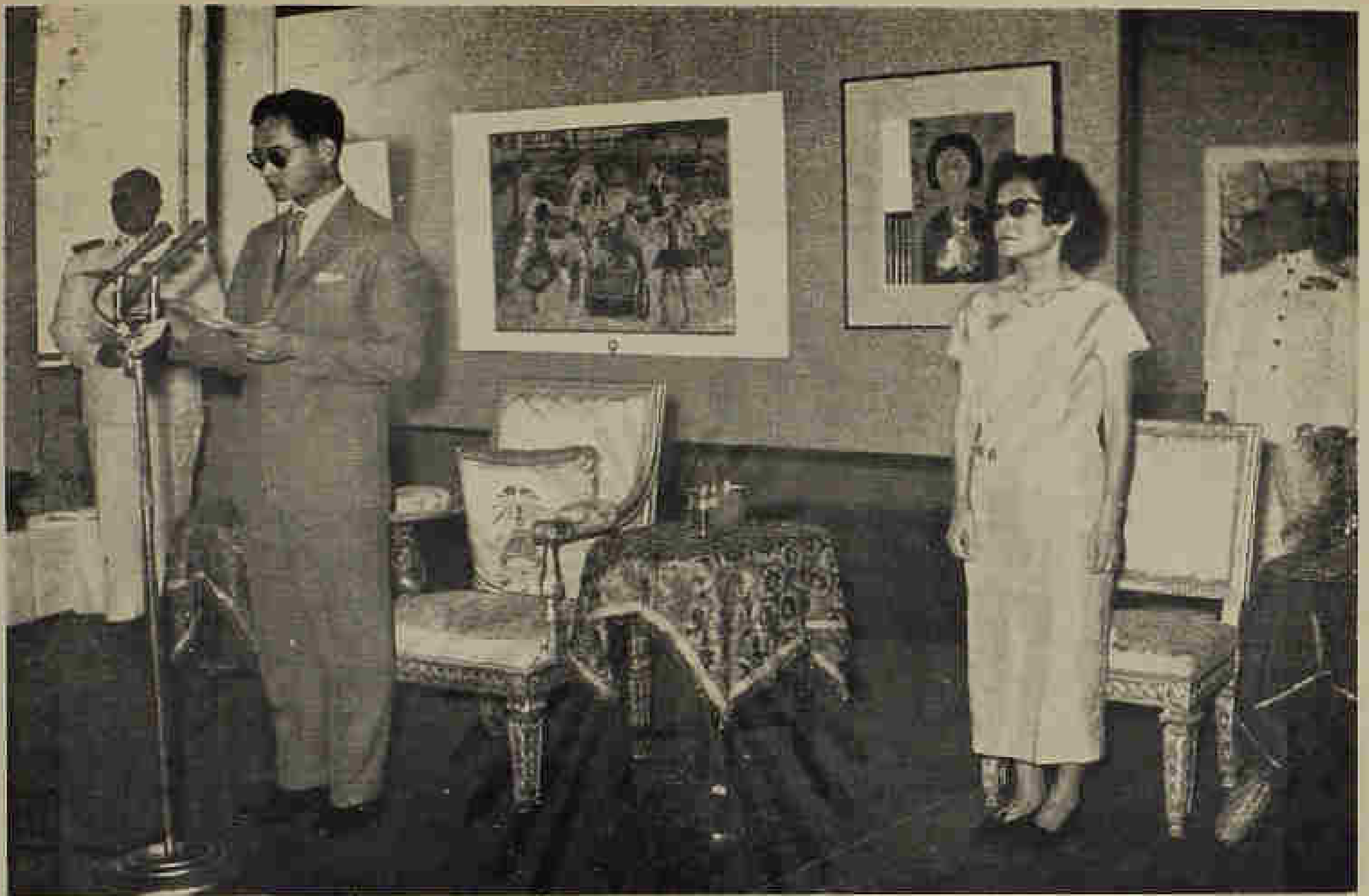
พระบาทสมเด็จพระเจ้าอยู่หัว โปรดพระราชทานกระแสพระราชดำรัส ในวันเปิดการแสดงศิลปกรรมแห่งชาติ ครั้งที่ ๑๓ ณ หอศิลป์ กรมศิลปากร เมื่อวันที่ ๒๐ กุมภาพันธ์ พ.ศ. ๒๕๐๕ His Majesty the King delivering the inaugural speech of the XIII National Art Exhibition at the Silpakorn Gallery, Fine Arts Department on the 20th February B.E. 2505