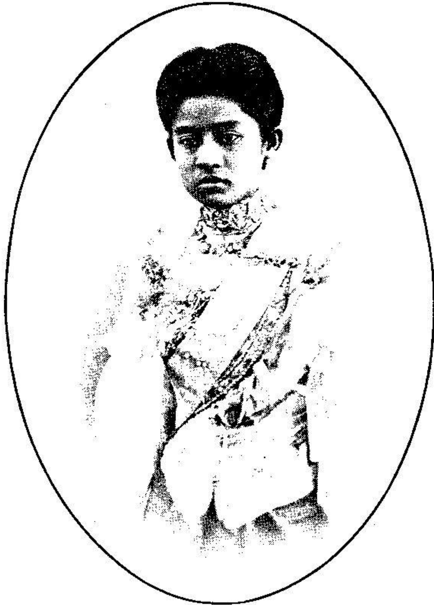
พระเจ้าฟ้างโช พระองค์เจ้าอรประพันธ์รำไพ ถ่ายเมื่อพระชันษา ๑๕ ปี