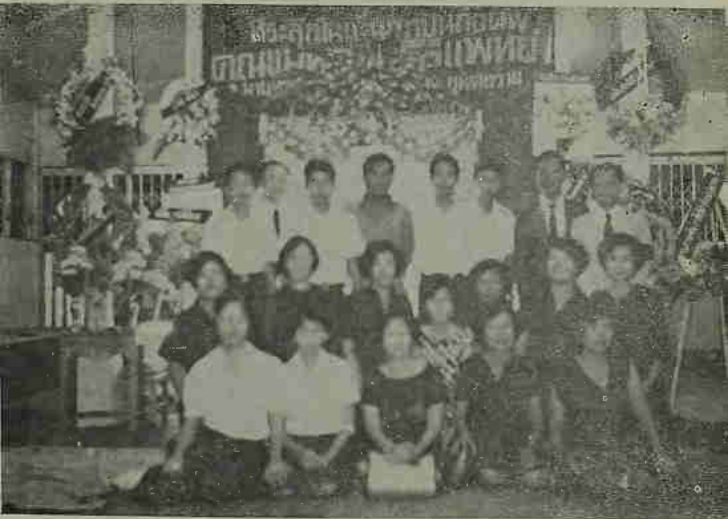
บุตรและหลานของคุณพ่อ