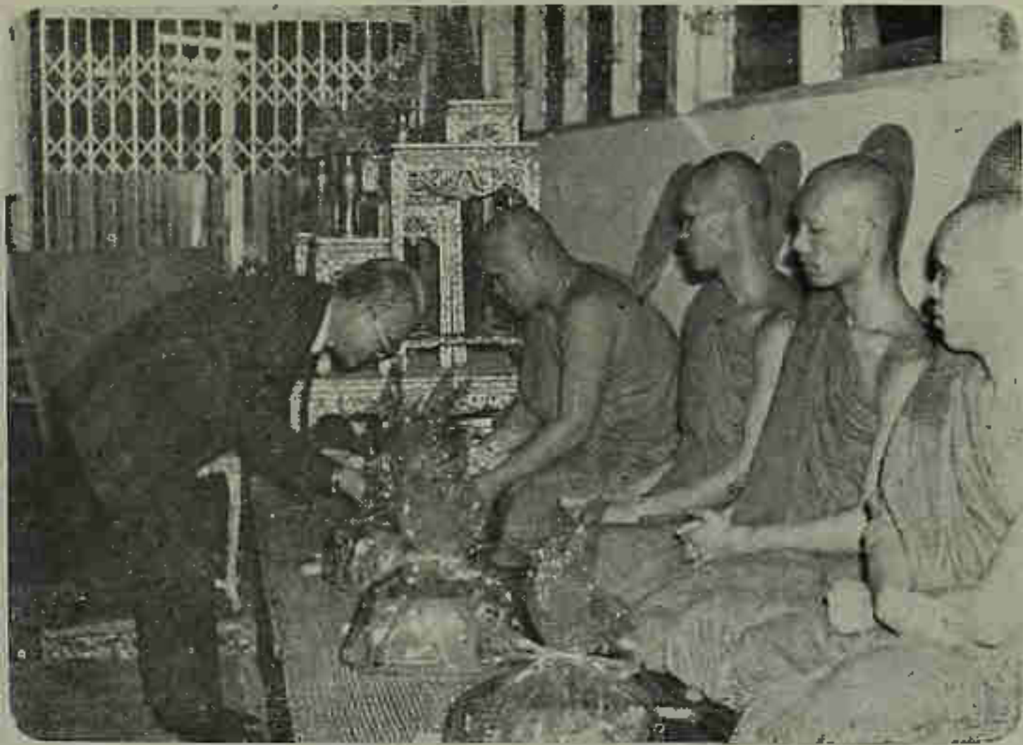
ประธานในพิธีสวดพระอภิธรรมถวายของ