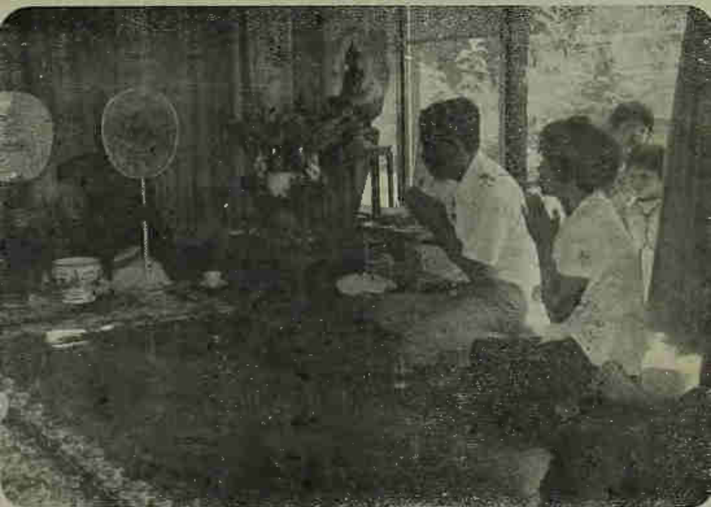
ในงานทำบุญ ๗ วันที่บ้าน