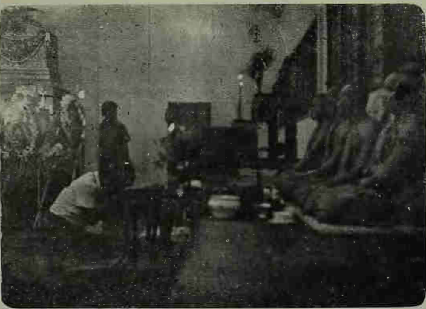
บุตรสาวคนโตของคุณพ่อ