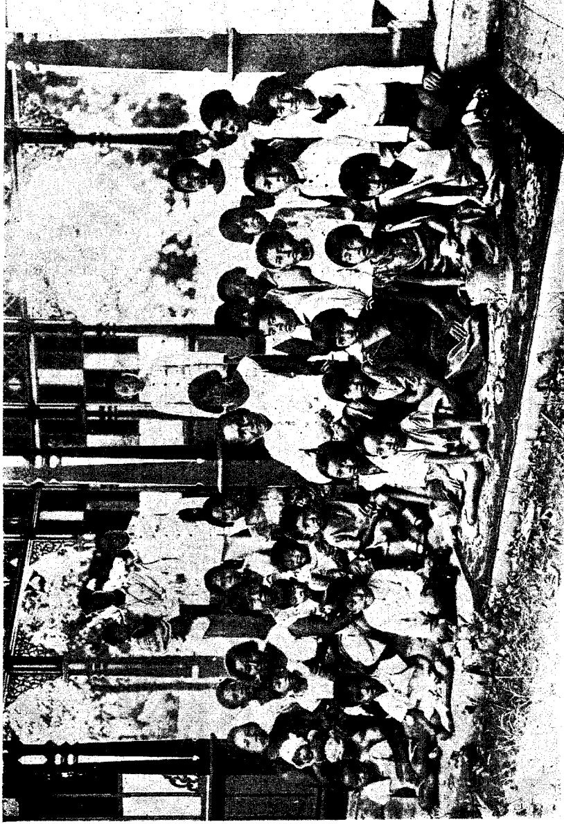
ถ่ายเมื่ออายุครบ ๕๐ ปีบริบูรณ์ พ.ศ. ๒๔๗๑