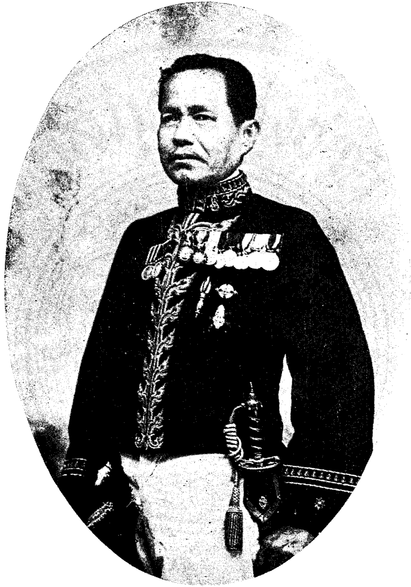
พระสีลปานุจิตรการ (ฉัตร อินทรเสน)