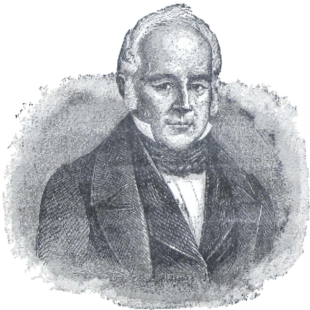
JULIÁN SEGUNDO DE AGÜERO.