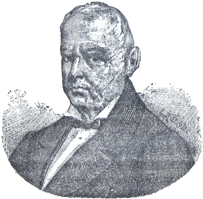
VICENTE LÓPEZ Y PLANES.