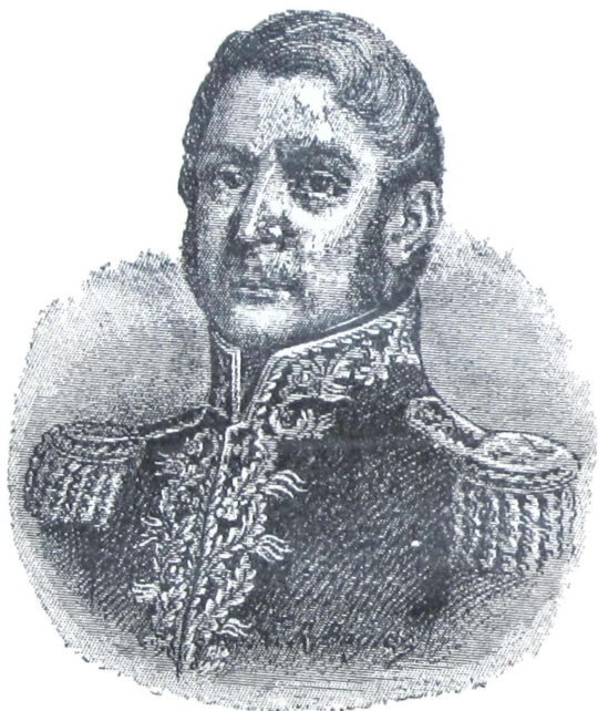
JOSÉ DE SAN MARTÍN.