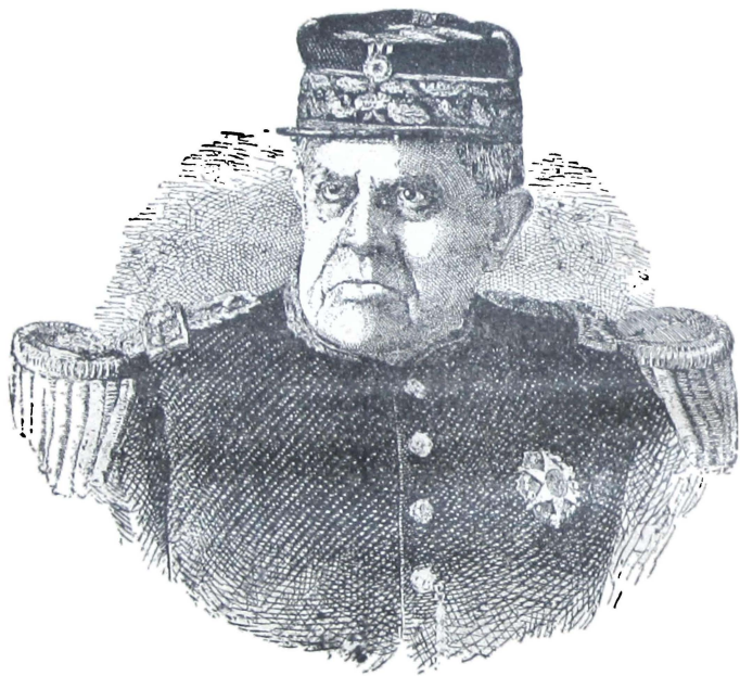
DOMINGO FAUSTINO SARMIENTO.