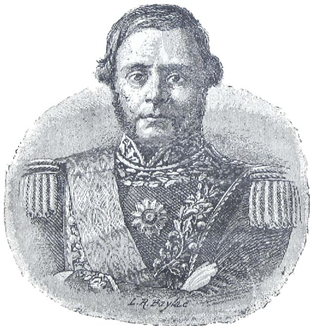
JUSTO JOSÉ DE URQUIZA.