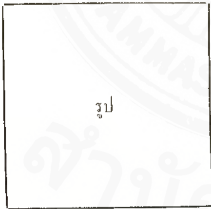
หนังสือสำคัญแสดงรูปพรรณ

เป็นบุคคลซึ่งไม่มีหนังสือเดินทางฉบับสำคัญแสดง สัญชาติอันถูกต้องตามความในข้อ ๑ มาตรา ๖ ของ พระราชบัญญัติว่าด้วยคนเข้าเมือง พ.ศ. ๒๕๗๐ แล มีประสงค์ที่จะอยู่ในพระราชอาณาจักรสยามต่อไป ฉะนั้นขอให้เจ้าพนักงาน ออกหนังสือใบสำคัญแสดง รูปพรรณแล้วอนุญาตให้อยู่ในพระราชอาณาจักรได้ ต่อไป ข้าพเจ้าได้ส่งรูปถ่ายขนาด ๔ นิ้ว ๒ รูป (ไม่ ฉีกกระดาษแข็ง) มาพร้อมกับหนังสือนี้ด้วยแล้ว (ลงลายมือชื่อหรือพิมพ์ลายมือ)