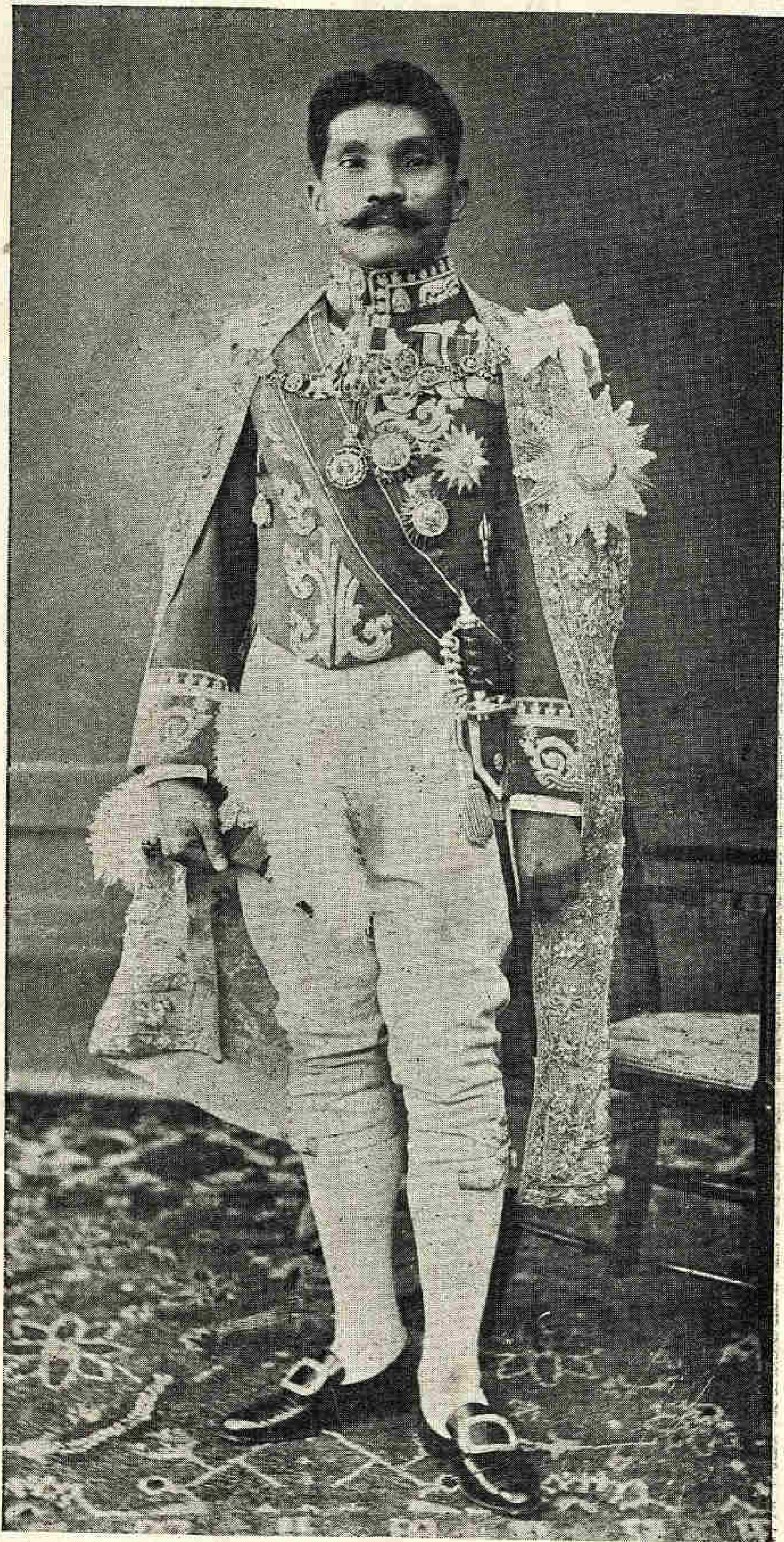
พระยาสนั่น ธรรมศักดิ์มนตรี เทพหัสดิน ณ อยุธยา