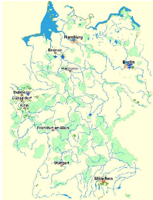
Der Familienname Hipel