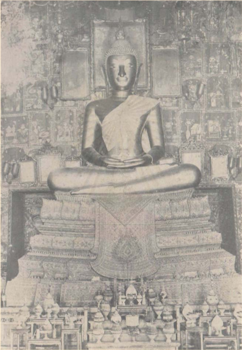
พระพุทธรอนันตคุณ อุดยญาณบพิตร พระประธานในพระอุโบสถวัดราชโอรส