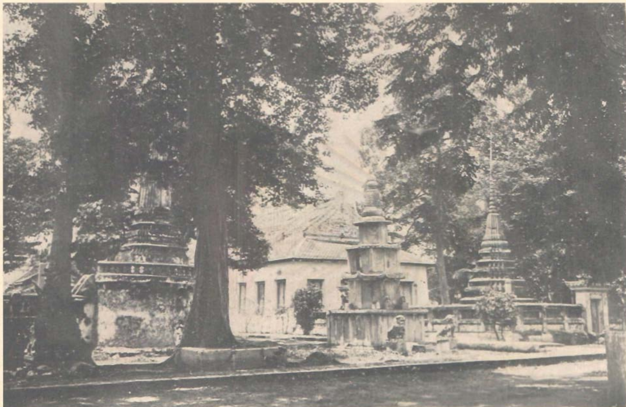
พระวิหารเก๋งกิสเหนือพระอุโบสถวัดราชโอรส