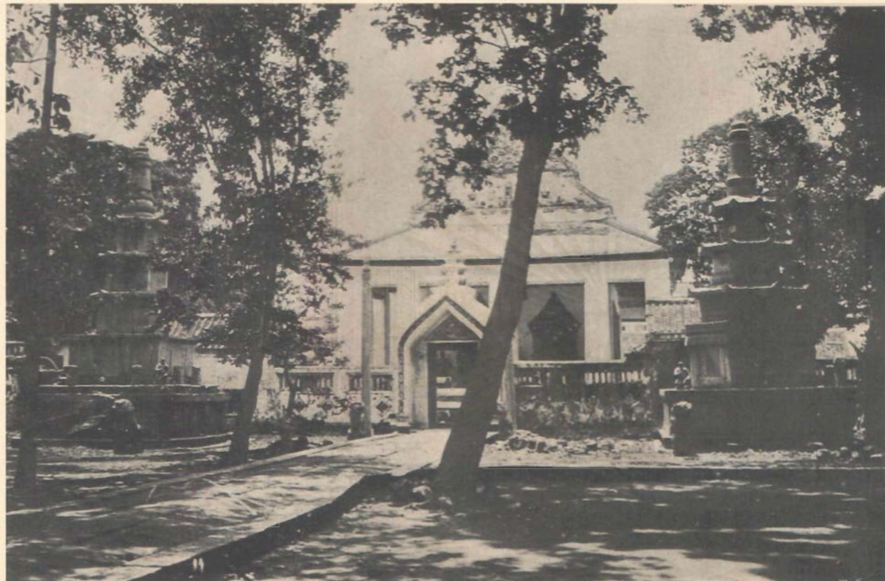
พระอุโบสถวัดราชโอรส