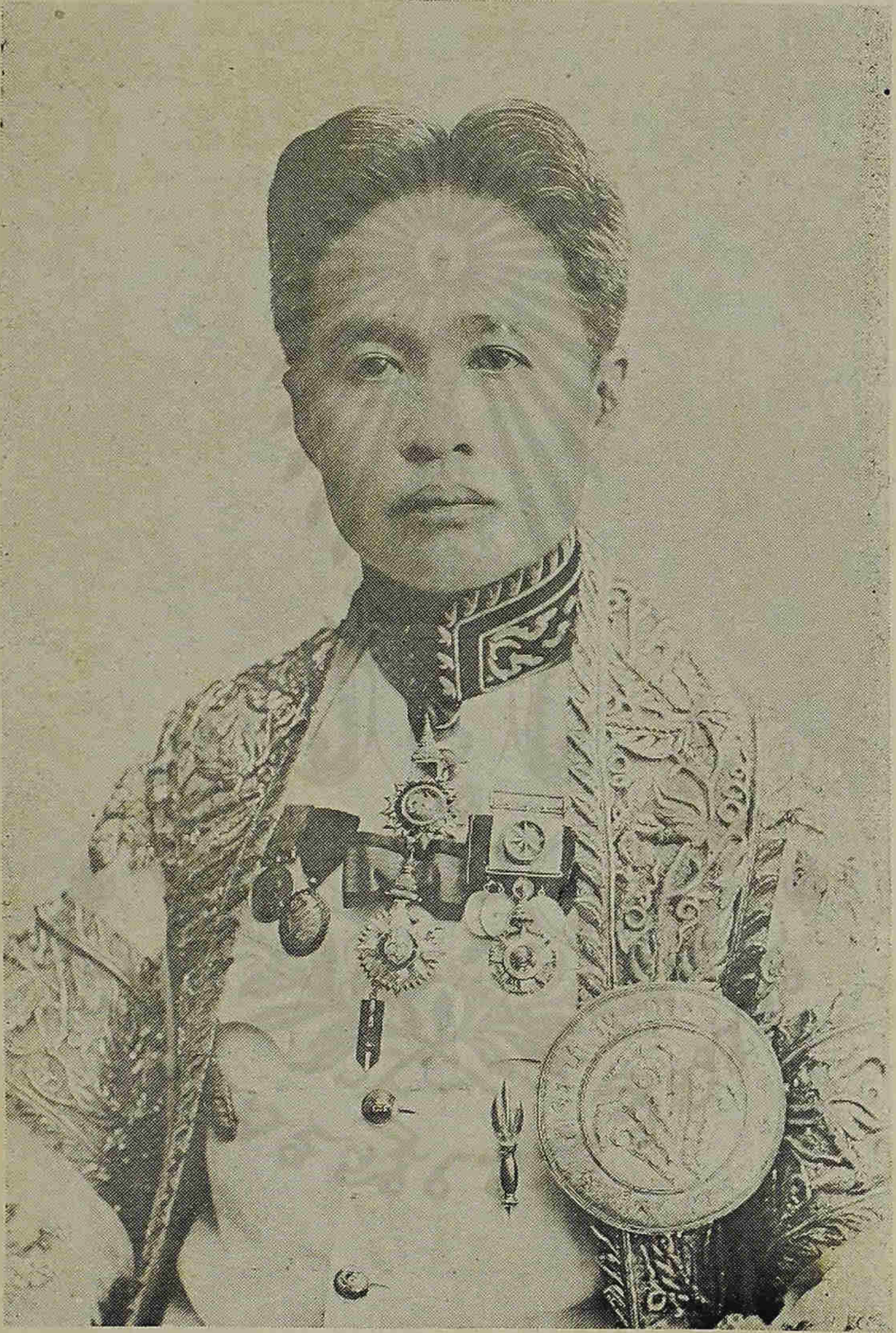
พระยา สุนทรเทพ กิจจารักษ์ (ทอง จันทรางศุ )