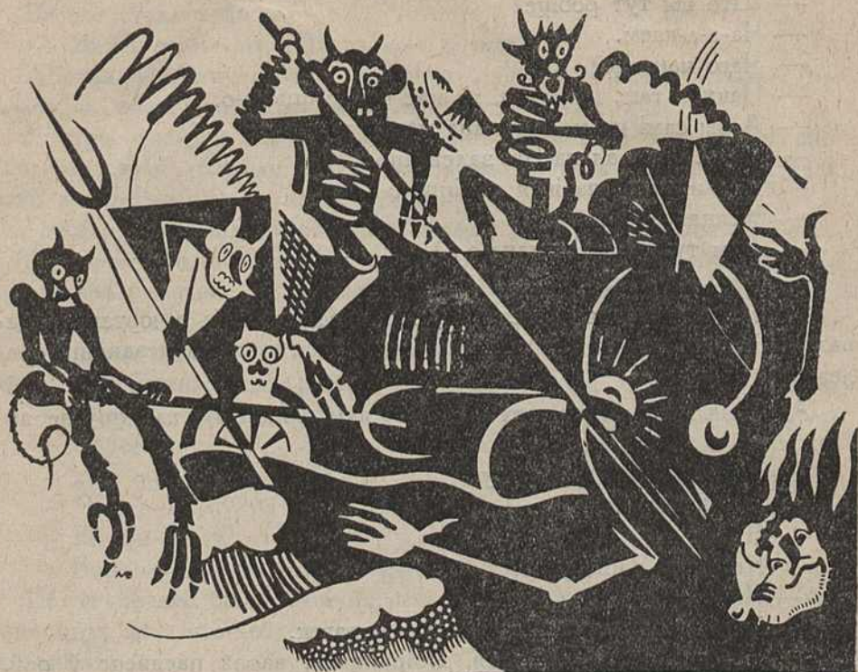
Цягнік з грукатам падляцеў да станцыі.

— А хто яго ведае? У кожным разе тут лепш, чымся на зямлі. Прынамсі, адпачыць можна. А ў рай хай сабе паны ідуць,—куды нам совацца за імі?—махнуў рукою селянін і пашоў далей.