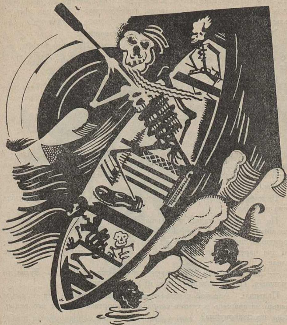
Харон перацягнуў такі іх вяслом па галаву.

— Ур-р-а-а!—зараўлі абодва.—Хай жывуць непераможныя піонэры! Цяпер мы задамо такога перцу, што ўсім чарцям мласна будзе!