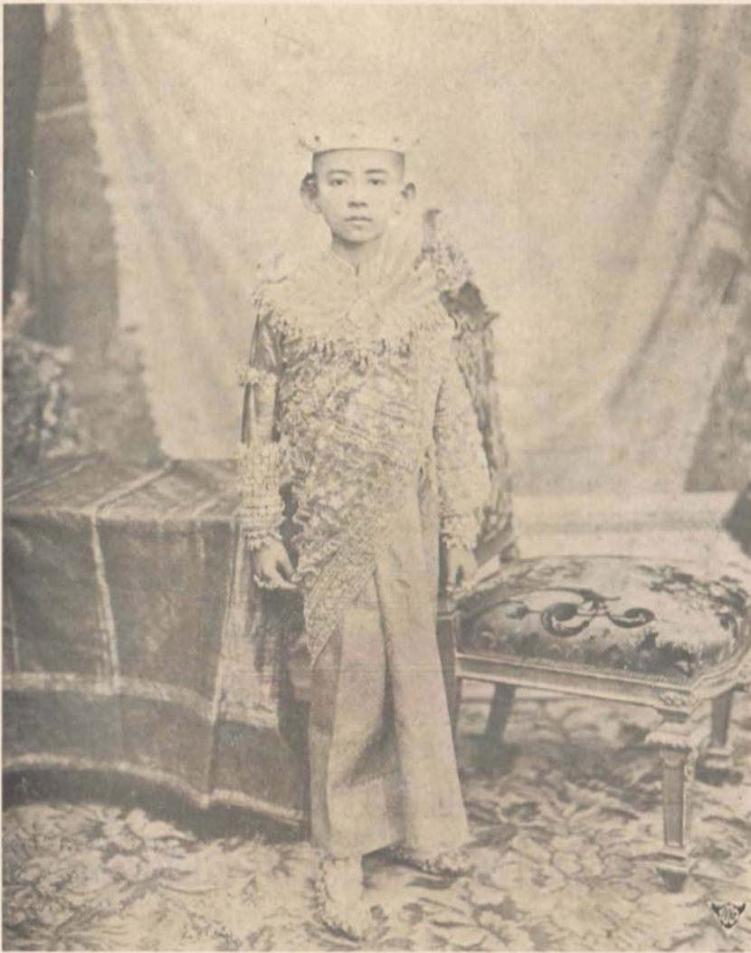
พระรูปสมเด็จพระเจ้าพ้ามืดตลอดยศ กรมขุนสงขลานครินทร์ ทรงเครื่องเมื่อโสกันต์แล้ว ถ่ายเมื่อปีเถาะ พ.ศ. ๒๔๔๖ พระชนมายุ ๑๓