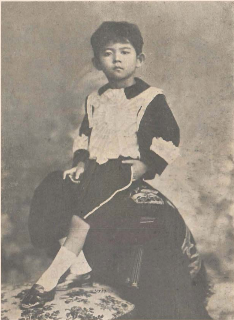
พระรูปสมเด็จพระเจ้าฟ้ามหิตลodayเดช กรมขุนสงขลานครินทร์ เมื่อยังทรงพระเยาว์ ถ่ายเมื่อปีระกา พ.ศ. ๒๔๔๐ พระชันษา ๕