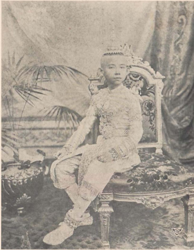
พระรูปสมเด็จพระเจ้าพ้ามืดตลอดยศ กรมขุนสงขลานครินทร์ ทรงเครื่องวันทรงฟังสวดโสกันต์ ถ่ายเมื่อปีเถาะ พ.ศ. ๒๔๔๖