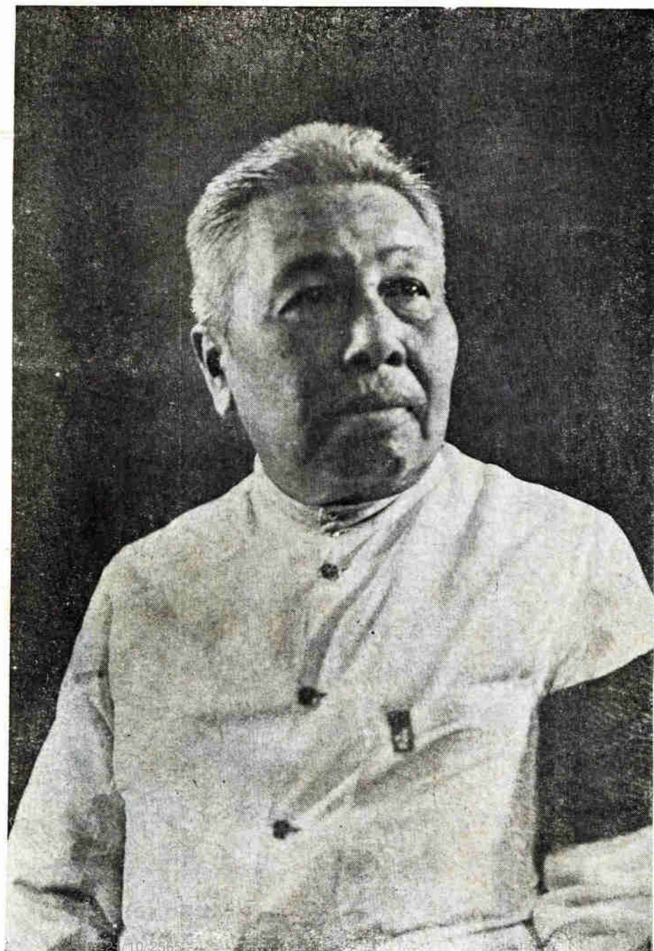
คุณอรุณ อมาตย์กุล ชาติะ ๖ สิงหาคม ๒๔๑๖ มรณะ ๒๘ มิถุนายน ๒๔๘๓