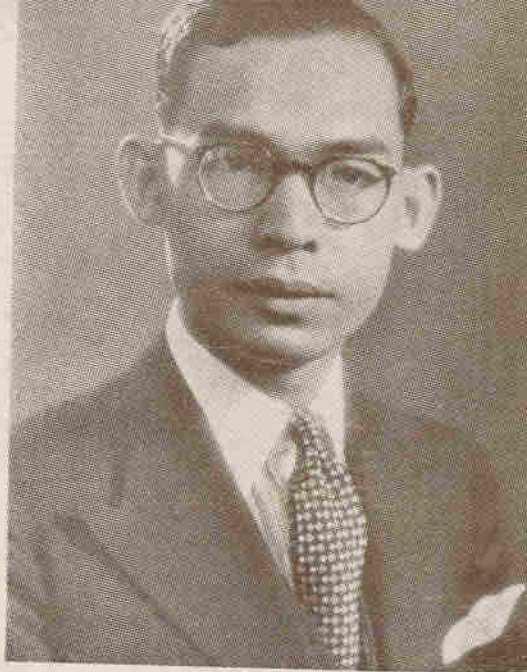
นายดิเรก ชัยนาม รัฐมนตรีช่วยว่าการ กระทรวงการต่างประเทศ